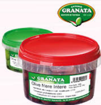
GRANATA OLIVE VERDI/NERE Secchiello - 250 gr