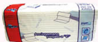
PAPERBLU ASCIUGAMANI PIEGATO A C 150 Pezzi