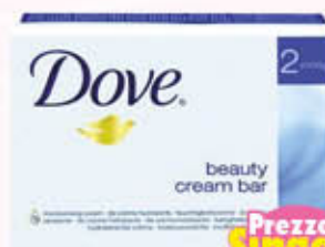
DOVE SAPONETTA 100 gr