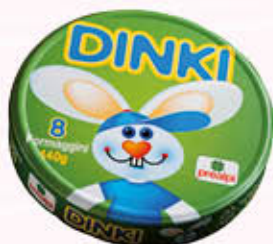
PREALPI FORMAGGINI DINKI 8 Pezzi