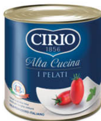
CIRIO PELATI ALTA CUCINA 2,5 Kg