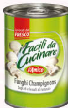
D'AMICO FUNGHI CHAMPIGNONS Tagliati al Naturale 290 gr