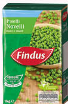
FINDUS PISELLI NOVELLI 1 Kg