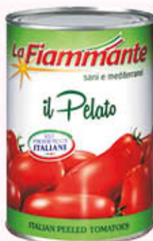
LA FIAMMANTE POMODORI PELATI 400 gr