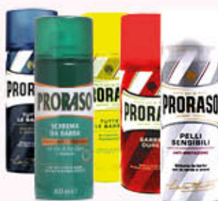
PRORASO SCHIUMA DA BARBA 400 ml