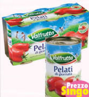
VALFRUTTA POMODORI PELATI 400 gr