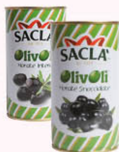
SACLA OLIVE MORATE Intere/Snociolate 330 gr