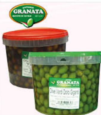
GRANATA OLIVE NERE/VERDI al kg