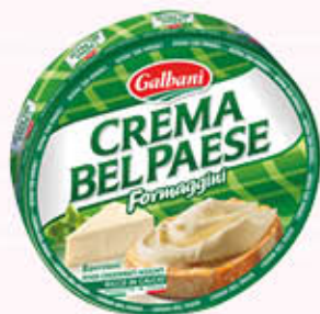
BEL PAESE FORMAGGINI CREMA BEL PAESE 8 Pezzi