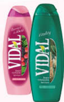
VIDAL BAGNOSCHIUMA Tutte le Profumazioni 500 ml