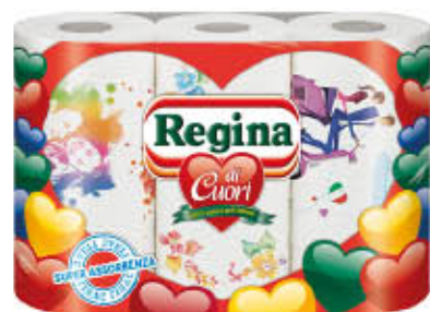
REGINA DI CUORI CARTACASA 3 Rotoli