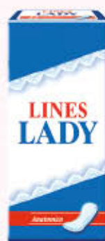
LINES ASSORBENTI LADY ANATOMICI x 10