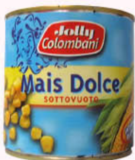
JOLLY COLOMBANI MAIS DOLCE 326 gr