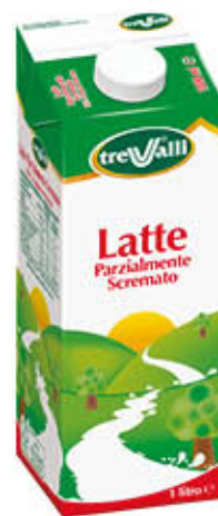
TRE VALLI LATTE UHT PARZIALMENTE SCREMATO 1 Litro