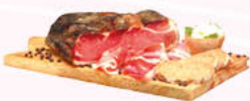
PINI SPECK SQUADRATO STAGIONATO 1/2 SV Al Kg