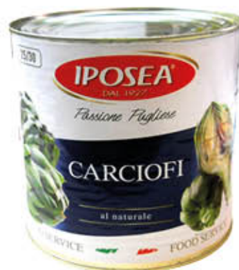
IPOSEA CARCIOFINI AL NATURALE 2,45 Kg