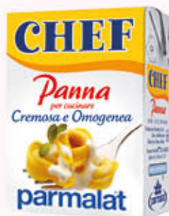
PARMALAT PANNA CHEF 200 ml