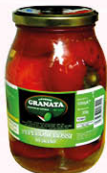
GRANATA PAPACELLE Vetro - 500 gr