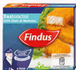
FINDUS BASTONCINI DI MERLUZZO x 6 - 150 gr