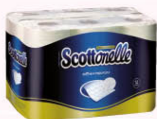
SCOTTONELLE CARTA IGIENICA 12 Rotoli