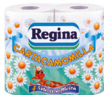
REGINA CARTA IGIENICA CAMOMILLA 4 Rotoli