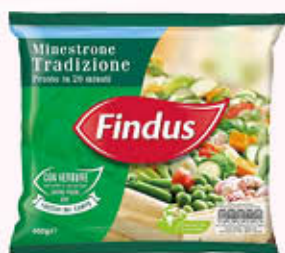
FINDUS MINISTRONE TRADIZIONE 450 gr