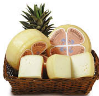
BRIGANTE FORMAGGIO SARDO Al Kg