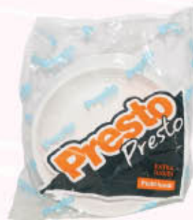
PRESTO PRESTO PIATTO EXTRARIGIDO CONVENIENZA Piani/Fondi T.K