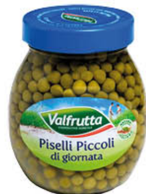
VALFRUTTA PISELLI PICCOLI Vetro - 360 gr