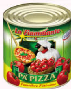
LA FIAMMANTE POLPA P'A PIZZA T.3