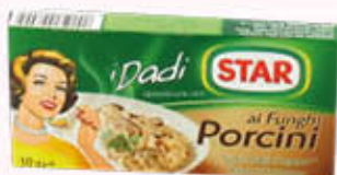
STAR DADO FUNGHI PORCINI 10 Cubi