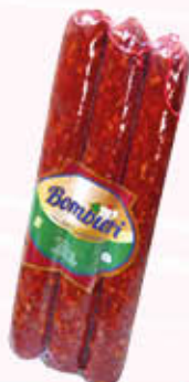
BOMBIERI SALSICCIA NAPOLI PICCANTE Al Kg