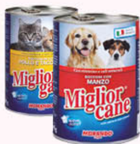
MIGLIOR CANE/ MIGLIOR GATTO BOCCONCINI Vari Gusti 405 gr