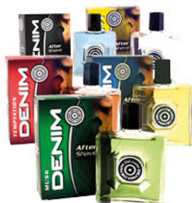
DENIM AFTER SHAVE 100 ml