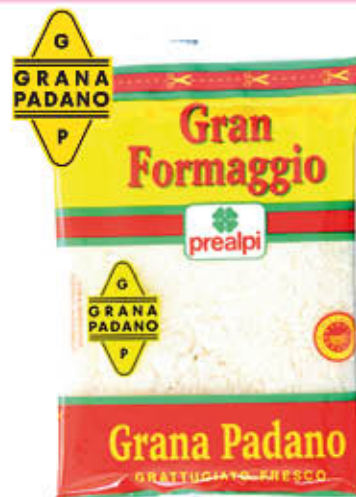
PREALPI GRANA PADANO 100 gr