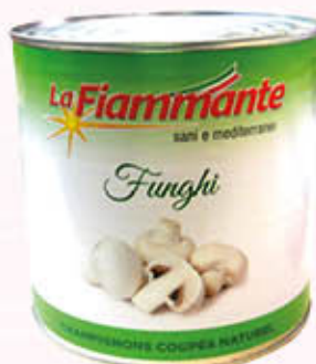
LA FIAMMANTE FUNGHI CHAMPIGNON AL NATURALE 2,5 Kg