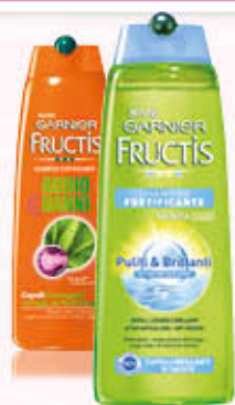
GARNIER FRUCTIS SHAMPOO Vari Trattamenti