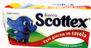
SCOTEX TOVAGLIOLI MONOVELO COMPATTO 128 Pezzi