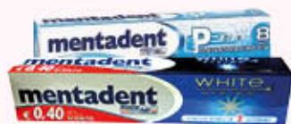
MENTADENT DENTIFRICIO Vari Tipi 75 ml