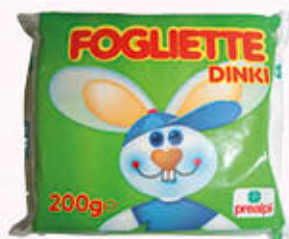
PREALPI FOGLIETTE 8 FETTE 200 gr