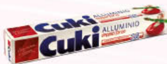
CUKI ALLUMINIO 16 Metri