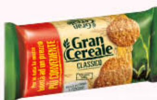
MULINO BIANCO BISCOTTI GRANCEREALE 500 gr