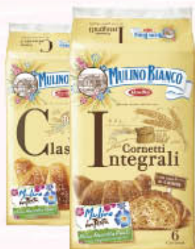
MULINO BIANCO CORNETTI Classici/Integrali x 6