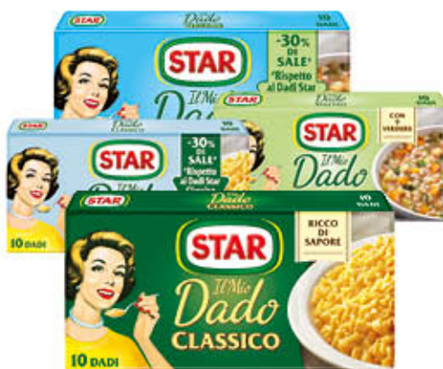
STAR DADO Classico/Vegetale/ -30% di Sale 10 Cubi