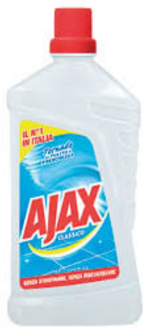
AJAX MULTISUPERFICIE Tutti i Tipi 1 Litro