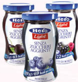
HERO LIGHT CONFETTURA Frutti di Bosco/ Mirtillo/Ciliegia 240 gr