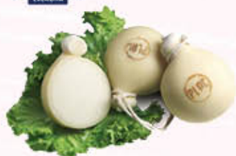
PLAC FIASCHETTA Al Kg