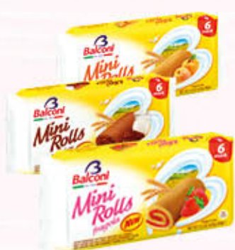
BALCONI MINI ROLLS x 6