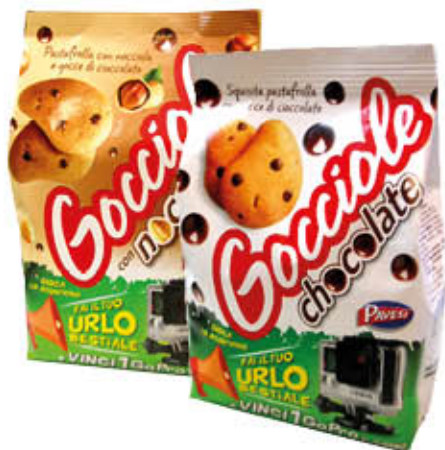
PAVESI GOCCIOLE CLASSICHE 500 gr/ NOCCIOLA 400 gr