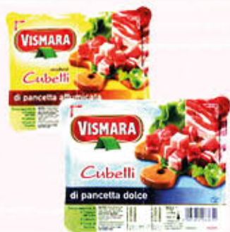
VISMARA PANCETTA A CUBETTI 80 gr x 2