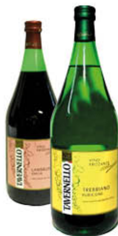
TAVERNELLO VINO Tutti i Tipi 1,5 Litri