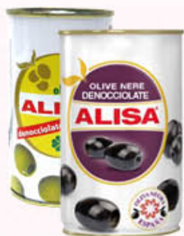
ALISA OLIVE NERE/VERDI DENOCIOLATE 350 gr