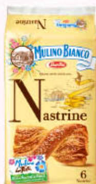
MULINO BIANCO NASTRINE x 6