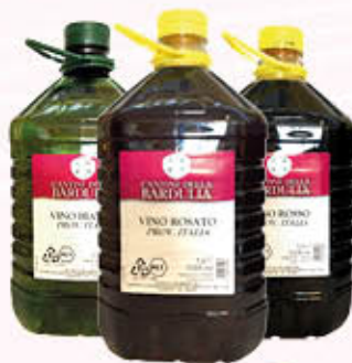
CANTINE DELLA BARDULLA VINO Pet 5 Litri