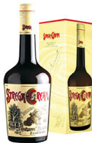
STREGA CREAM 70 cl