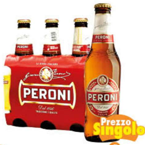
PERONI BIRRA Vetro 33 cl