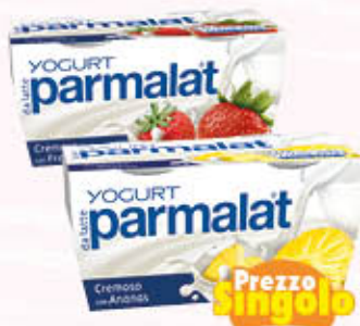
PARMALAT YOGURT Tutti i Tipi 125 gr x 2