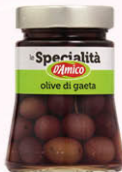
D'AMICO OLIVE DI GAETA 300 gr