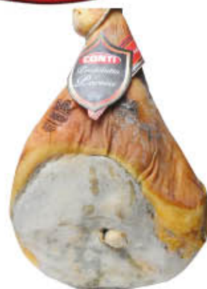
CONTI PROSCIUTTO CRUDO DI PARMA CON OSSO Al Kg