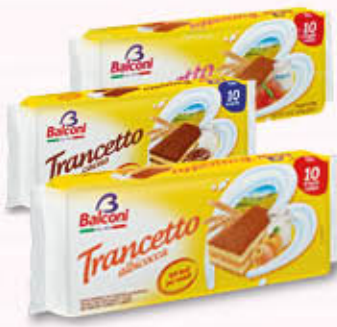
BALCONI TRANCETTO 10 Merendine