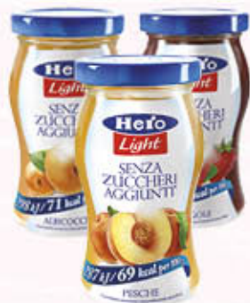
HERO LIGHT CONFETTURA Albicocca/Fragola/Pesca 240 gr