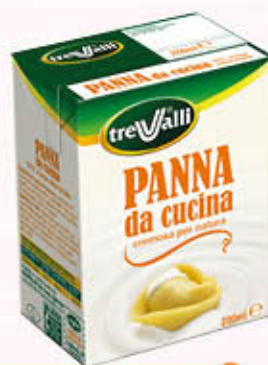
TRE VALLI PANNA DA CUCINA 200 ml