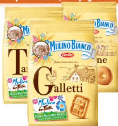
MULINO BIANCO BISCOTTI 700/800 gr

Galletti/Molinetti/ Tarallucci/ Biscottone/Macine/Rigoli/ Spicchi di Sole/Campagnole