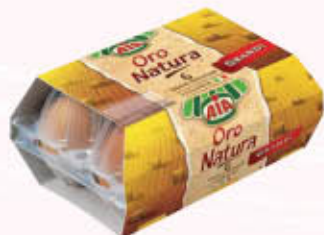
AIA UOVA FRESCHE MEDIE ORO NATURA 6 Pezzi