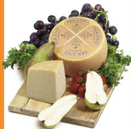
BRIGANTE FORMAGGIO SARDO Al Kg