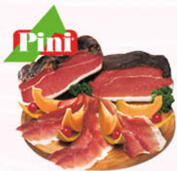
PINI SPECK SQUADRATO STAGIONATO 1/2 SV Al Kg