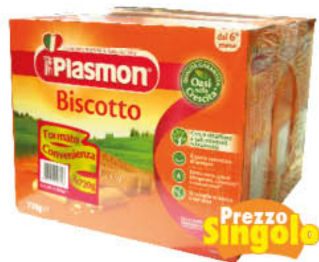
PLASMON BISCOTTI TRIPACK 720 gr