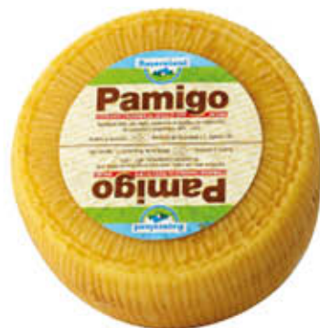
BAYERNLAND FORMAGGIO RIGATINO PAMIGO Sottovuoto Al Kg