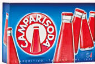
CAMPARI SODA CONFEZIONE 5 Pezzi