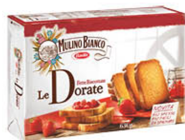
MULINO BIANCO FETTE BISCOTTATE DORATE 630 gr