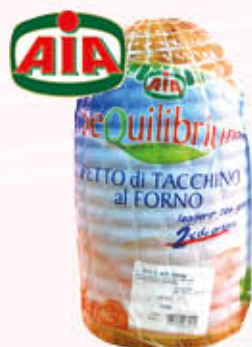
TARKY PETTO DI TACCHINO ROAST Al Kg