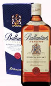
BALLANTINE'S WHISKY 70 cl