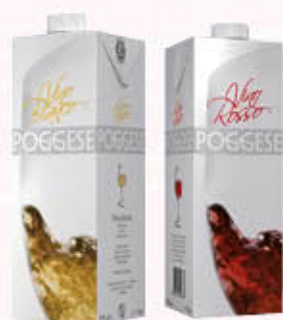
POGGESE VINO BRIK 1 Litro