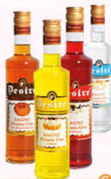
DESIRE BAGNA PRONTO USO Tutti i Tipi 50 cl