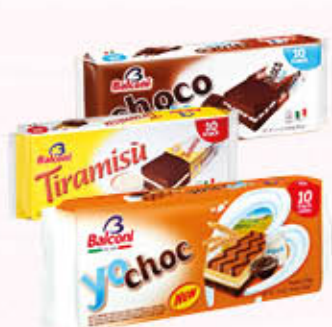
BALCONI YOCHOC/CHOCOLATE/TIRAMISU 10 Merendine