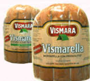
VISMARELLA MORTADELLA CON PROSCIUTTO con/senza pistacchi Al Kg