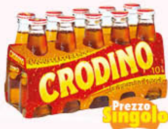
CRODINO APERITIVO 10 cl