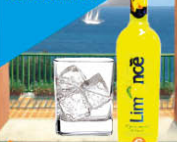
STOCK LIMONCELLO 50 cl