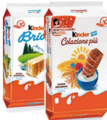
KINDER Colazione/Brioss x 10