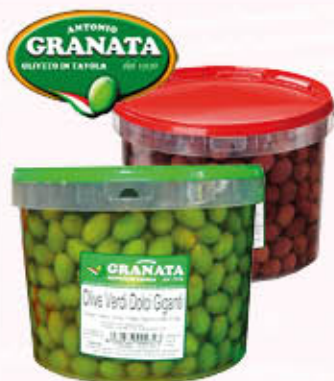
GRANATA OLIVE VERDI GIGANTI/ NERE PASSOLONI in Secchio