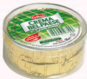
GALBANI FORMAGGINI CREMA BEL PAESE 2 Pezzi