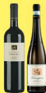
€ 4,29 CANTINA DEL TABURNO DOC AGLIANICO FIDELIS/FALANGHINA DEL SANNIO - 75 CL