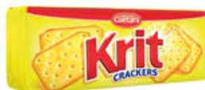
KRIT CRACKERS 100 GR