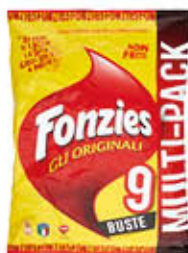
FONZIES MULTIPACK 212 GR