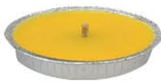
CANDELA CITRONELLA ALLUMINIO #17