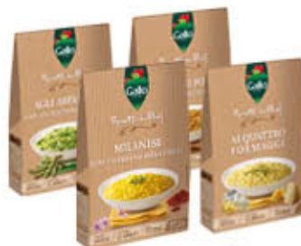
GALLO RISOTTI DA CHEF 175 GR