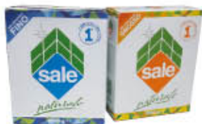
ITALKALI SALE ASTUCCIO 1 KG