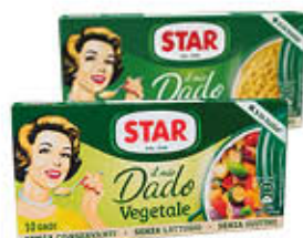
STAR DADO CLASSICO/ VEGETALE X 10