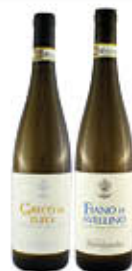
MASTROBERARDINO FIANO E GRECO DOCG 75 CL € 7,29