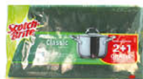
SCOTCH-BRITE SPUGNA+ABRASIVO 3 PEZZI