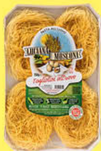
LUCIANA MOSCONI PASTA ALL'UOVO VARI TIPI 500 GR