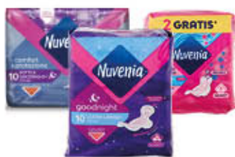
NUVENIA ASSORBENTI ULTRA/NOTTE TUTTI I TIPI