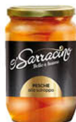
O'SARRACINO PESCHE SCIROPATE VETRO 400 GR SGOCCIOLATO