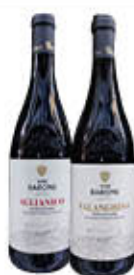
BARONE VINO AGLIANICO/ FALANGHINA IGP BN 75 CL € 1,95