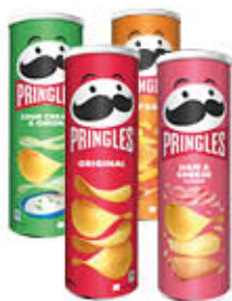
PRINGLES TUTTI I TIPI 160/175 GR