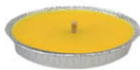
CANDELA CITRONELLA ALLUMINIO #11