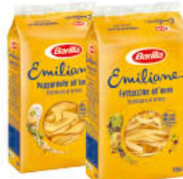
BARILLA EMILIANE ALL'UOVO TUTTI I TIPI 250 GR