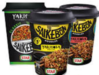
STAR YAKISOBA 93 GR