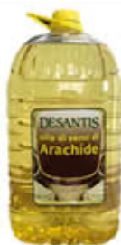
DESANTIS OLIO SEMI ARACHIDE PET - 5 LITRI