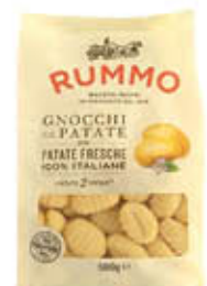
RUMMO GNOCCHI /GNOCCHETTI DI PATATE 500 GR