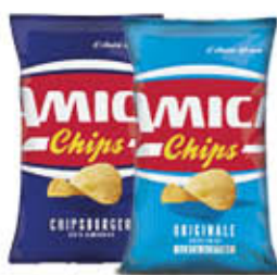
AMICA CHIPS PATATINE TUTTI I TIPI 100 GR