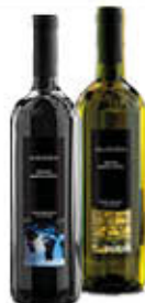
PENGUE AGLIANICO/ FALANGHINA IGP 75 CL € 1,49