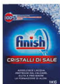
FINISH SALE PURISSIMO PER LAVASTOVIGLIE 1 KG