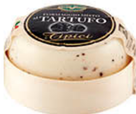
TREVALLI CACIOTTA MISTA TARTUFO 180 GR