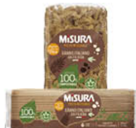
MISURA PASTA DI SEMOLA INTEGRALE 500 GR