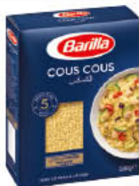
BARILLA COUS COUS 500 GR