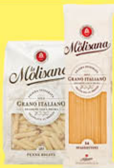
LA MOLISANA PASTA DI SEMOLA TRAFILE NORMALI 500 GR