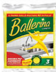
PANNO BALLERINA ORIGINALE 3 PZ