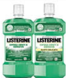
LISTERINE COLLUTORIO DENTI E GENGIVE CLASSICO/ZERO 500 ML