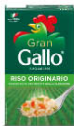
GALLO RISO ORIGINARIO 1 KG