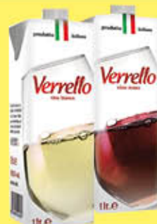
€ 0,69 VERRELLO VINO BRIK 1 LITRO