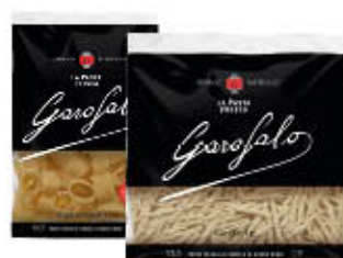
GAROFALO PASTA FRESCA 400 GR