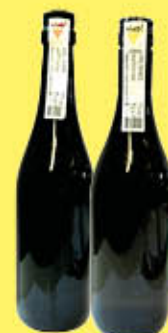
€ 1,05 PENGUE VINO VIVO 75 CL