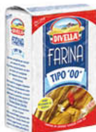
DIVELLA FARINA 00 1 KG