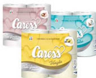
CARESS CARTA IGIEENICA COLORATA PROFUMATA 2 VELI 4 ROTOLI