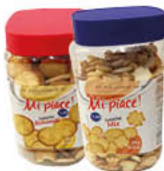
MI PIACE SALATINI 300 GR