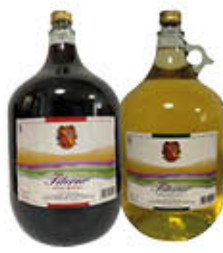
VINICOLA DEL TITERNO DAMA BIANCO/ROSSO 5 LITRI € 5,99