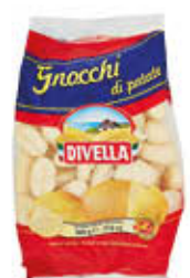
DIVELLA GNOCCHI DI PATATE 500 GR