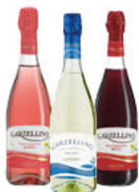
GARZELLINO VINO VARI TIPI 75 CL € 1,49