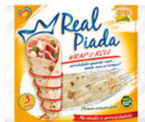
STER REAL PIADA 330 GR