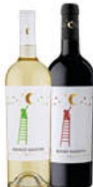
NOTTE ROSSA VINI IGP ROSSO SALENTO/ BIANCO SALENTO 75 CL € 2,39