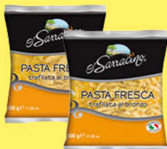
O' SARRACINO PASTA SPECIALE FRESCA TRAFILATA AL BRONZO 500 GR