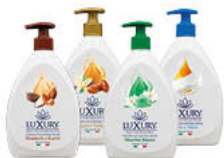
LUXURY SAPONE MANI VARIE PROFUMAZIONI 750 ml