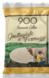
900 COLLINE GRATTUGIATO MIX 100 GR