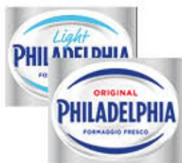
PHILADELPHIA CLASSICA/ LIGHT 80 GR