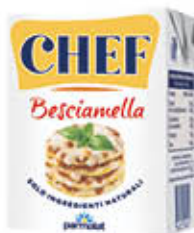
PARMALAT BESCIAMELLA CHEF 200 ML