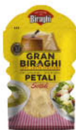
GRANBIRAGHI PETALI SOTTILI 80 GR