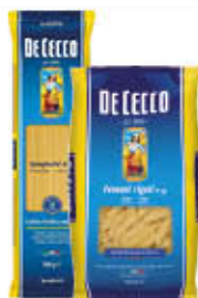
DE CECCO PASTA SEMOLA FORMATI NORMALI VARIE TRAFILE 500 GR