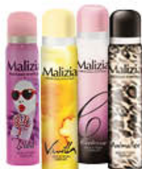
MALIZIA DEODORANTI DONNA TUTTI I TIPI 100 ML