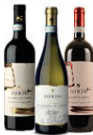
CANTINE IORIO FALANGHINA E AGLIANICO DOP/ BARBERA 75 CL € 2,89