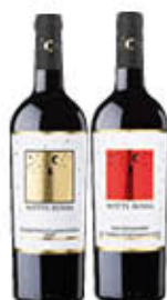
NOTTE ROSSA VINI DOP NEGROAMARO/ PRIMITIVO € 4,59