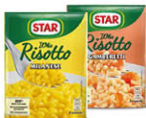
STAR RISOTTI CREMOSI TUTTI I TIPI 2 PORZIONI 175 GR