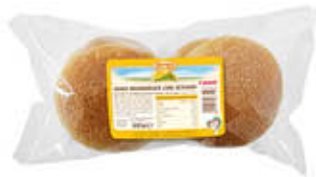
STER MAXI HAMBURGER AL SESAMO 300 GR