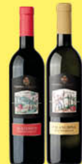
€ 2,09 CANTINA DI SOLOPACA VINO IGP AGLIANICO/FALANGHINA 75 CL