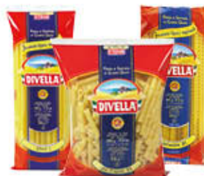
DIVELLA ZITI/ZITONI/ MEZZANI/ MAFALDINE/ TRIPOLINE - 500 GR