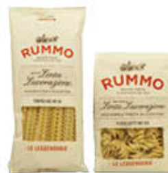
RUMMO PASTA LE LEGGENDARIE 500 GR