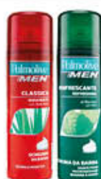
PALMOLIVE SCHIUMA DA BARBA CLASSICA/MENTOLO 300 ML