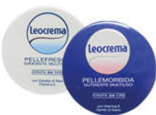
LEOCREMA PELLEFRESCA PELLEMORBIDA 150 ML