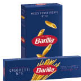
BARILLA PASTA SEMOLA TRAFILE NORMALI 500 GR