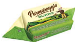
PARMAREGGIO BURRO 200 GR