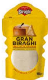
GRANBIRAGHI GRATTUGIATO 100 GR