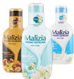
MALIZIA BAGNOSCHIUMA TUTTI I TIPI 1 LITRO