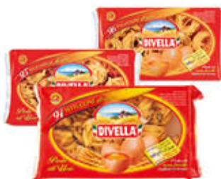
DIVELLA PASTA ALL'UOVO 500 GR