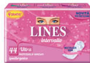
LINES INTERVALLO RIPIEGATO X 40 + 4