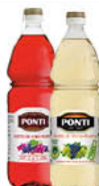
PONTI ACETO DI VINO BIANCO/ROSSO PET - 1 LITRO