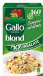
GALLO RISO BLOND PER INSALATE 1 KG