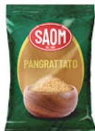
SAOM PANGRATTATO 400 GR