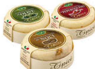
TREVALLI FORMAGGIO MISTO OLIVE/NOCI/ PEPERONCINO 180 GR