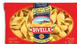
DIVELLA CONCHIGLIONI TRAFILATI AL BRONZO 500 GR