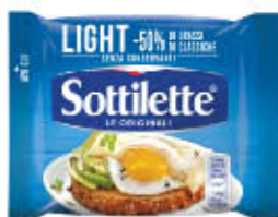
KRAFT SOTTILETTE LIGHT 7 FETTE 200 GR