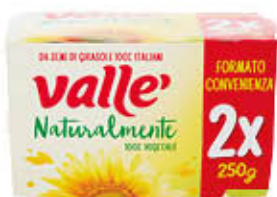
VALLE MARGARINA CLASSICA 250 GR X 2