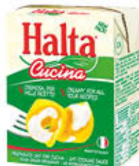
HALTA PREPARATO VEGETALE CUCINA 200 ML