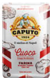
CAPUTO FARINA CUOCO 1 KG