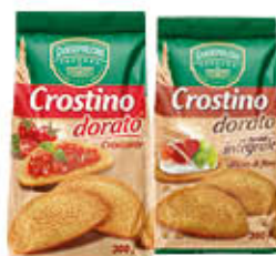
SANSEPOLCRO CROSTINI 300 GR