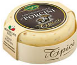
TREVALLI CACIOTTA MISTA FUNGHI PORCINI 180 GR