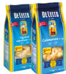
DE CECCO PASTA SEMOLA FORMATI SPECIALI TUTTI I TIPI 500 GR