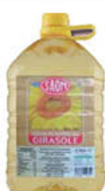
SAOM OLIO SEMI GIRASOLE 5 LITRI