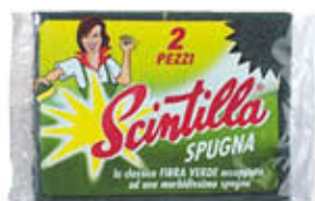
SCINTILLA PULIZIA SPUGNA 2 PEZZI