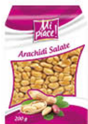
MI PIACE ARACHIDI SALATE 200 GR