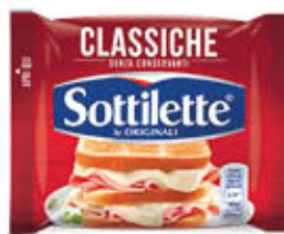
KRAFT SOTTILETTE 400 GR