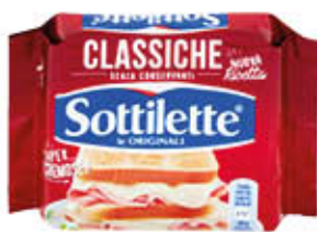
KRAFT SOTTILETTE 200 GR