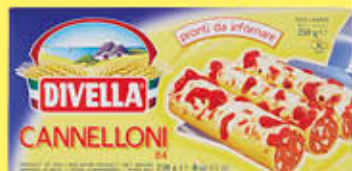
DIVELLA CANNELLONI DI SEMOLA 250 GR