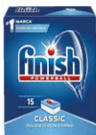
FINISH TABS POWERBALL X 15