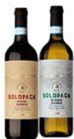
CANTINA DI SOLOPACA VINO SOLOPACA DOP BIANCO/ROSSO 75 CL € 1,55