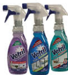
VETRIL SPRAY TUTTI I TIPI 650 ML