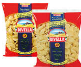
DIVELLA PASTA ORECCHIETTE/ SVENTOLE 500 GR