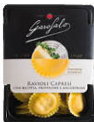
GAROFALO PASTA FRESCA RIPIENA 230 GR