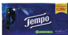
TEMPO FAZZOLETTI X 8