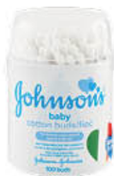
JOHNSON'S COTTON FIOC 100 PEZZI