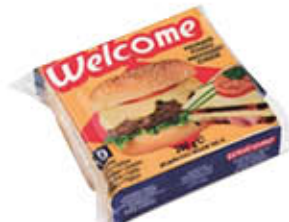
WELCOME FORMAGGIO FETTINE 200 GR