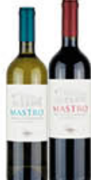
MASTROBERARDINO VINO MASTRO BIANCO/ROSSO 75 CL € 4,39