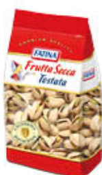
FATINA PISTACCHI TOSTATI SALATI 200 GR