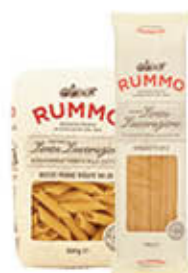
RUMMO PASTA LE CLASSICHE 500 GR