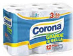
CORONA CARTA IGIENICA GRANDE&BELLA 3V X 12