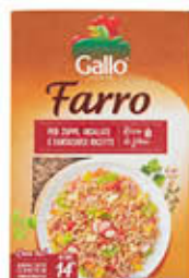
GALLO FARRO NORMALE 400 GR