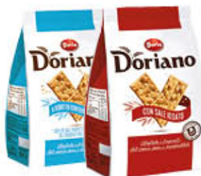
DORIANO CRACKERS SALATI/NON SALATI 700 GR