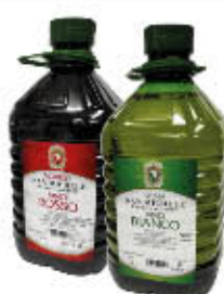
VITIVINICOLA SAN MICHELE VINO ROSSO/BIANCO 3 LITRI € 2,99