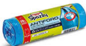
DOMOPAK SPAZZY SACCO SPAZZATURA CON MANICI 28 LITRI 20 PEZZI