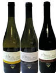
VILLA GRECI AGLIANICO/ FALANGHINA IGP CODA DI VOLPE IGT 75 CL € 2,49