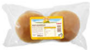
STER MAXI HAMBURGER 300 GR