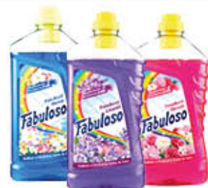
FABULOSO PAVIMENTI TUTTI I TIPI 1,25 LITRI