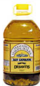
DESANTIS OLIO EXTRAVERGINE SAN GIOVANNI 5 LITRI