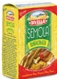
DIVELLA SEMOLA RIMACINATA 1 KG