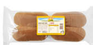
STER MAXI HOT DOG 300 GR