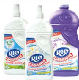
RIO CASAMIA VARI TIPI 1,25 LITRI