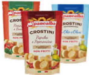
PANEALBA CROSTINI VARI GUSTI 100 GR