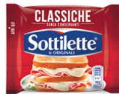
MONDELEZ SOTTILETTE 400 GR