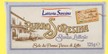
SORESINA BURRO S/LATTOSIO 125 GR