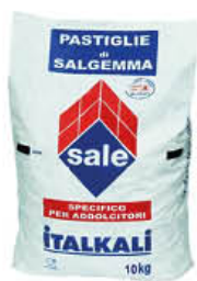
SALE ADDOLCITORE IN PASTIGLIE 10 KG