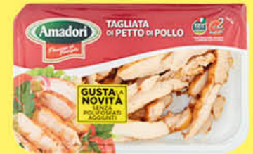
AMADORI TAGLIATA DI POLLO 280 GR