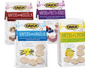
CRICH WAFERS SACCHETTO 250 GR