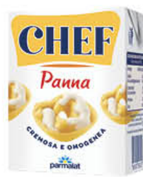
PARMALAT PANNA CHEF 200 ML