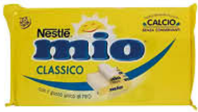
NESTLÉ FORMAGGINO MIO 125 GR