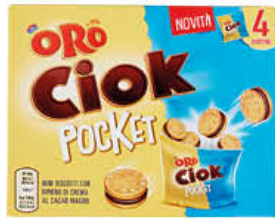
ORO CIOK POCKET 160 GR