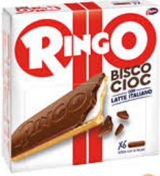
RINGO BISCOCIOC CACAO/LATTE 6BARRETTE GR168