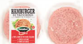
AMADORI HAMBURGER TACCHINO 80 GR X 2 STD