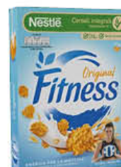
NESTLE CEREALI FITNESS 375 GR