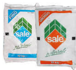
ITALKALI SALE 10 KG