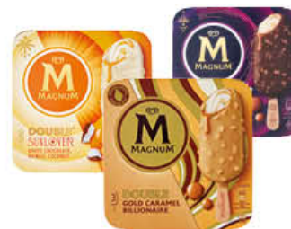
MAGNUM STARCHAISER/ SUNLOVER/ BILLIONAIRE 3 PZ