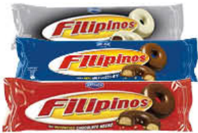
FILIPINOS DARK/WHITE E LATTE 128 GR