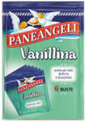
PANEANGELI VANILLINA PURA 6 BUSTE