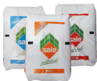
ITALKALI SALE SACCHI DA 25 KG