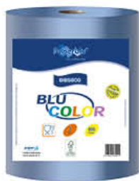
PAPERBLU BOBINA BLUCOLOR S800 3 VELI