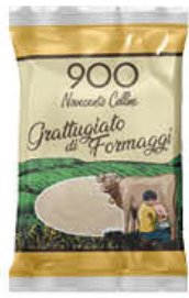
900 COLLINE GRATTUGIATO MIX 100 GR