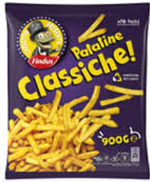
FINDUS PATATINE FRITTE CARLETTO 900 GR