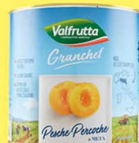
VALFRUTTA PESCHE SCIROPATE GRAN CHEF T3