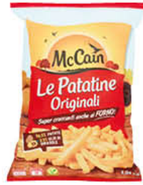
MC CAIN PATATE 1 KG