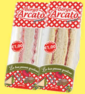
BORG ARCATO TRAMEZZINI FARCITI 140 GR