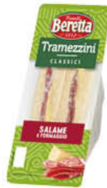
BERETTA TRAMEZZINI SALAME E FORMAGGIO 140 GR