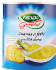
VALFRUTTA GCHEF ANANAS SCIROPATO T3