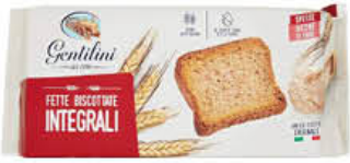
GENTILINI FETTE BISCOTTATE INTEGRALI 175 GR