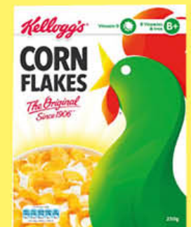
KELLOGG'S CORN FLAKES ORIGINAL 250 GR