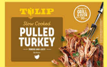
TULIP PULLED TURKEY 500 GR