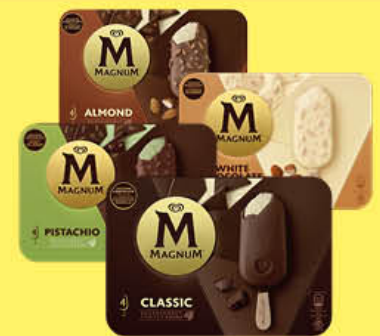
ALGIDA MAGNUM CLASSICO/ BIANCO/ MANDORLE/ PISTACCHIO - X 4