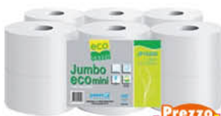
PAPERBLU IGIENICA MINI JUMBO ECO 140 METRI