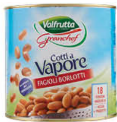
VALFRUTTA CHEF FAGIOLI BORLOTTI 2,10 KG