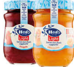
HERO CONFETTURA LIGHT CILIEGIA/ALBICOCCA/ FRAGOLA/PESCA 280 GR