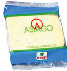
PREALPI ASIAGO PORZIONATO AL KG