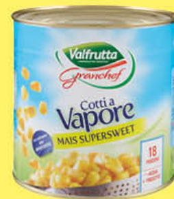
VALFRUTTA MAIS GRAN CHEF 680 GR