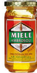
AMBROSOLI MIELE 250 GR