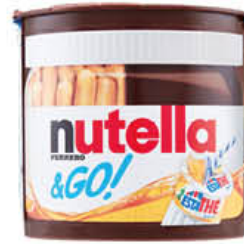
FERRERO NUTELLA & GO 52 GR