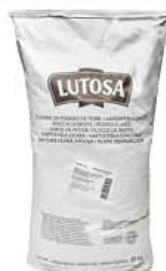
LUTOSA FIOCCHI DI PATATE 5 KG