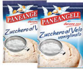
PANEANGELI ZUCCHERO A VELO CLASSICO/VANIGLIATO 125 GR