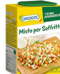
OROGEL MISTO PER SOFFRITTO 150 GR