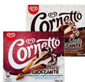
ALGIDA CORNETTO CUORE CROCCANTE CIOCCOLATO/BIANCO X 6