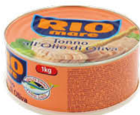
RIO MARE TONNO 1 KG