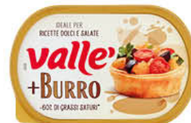
VALLÉ+ BURRO MARGARINA 250 GR