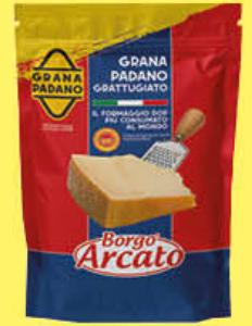
BORGO ARCATO GRATTUGIATO GRANA PADANO 80 GR