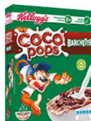
KELLOGG'S COCO POPS BARCHETTE 365 GR