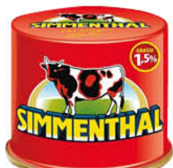
SIMMENTHAL CARNE 90 GR