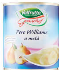
VALFRUTTA GRAN CHEF PERE SCIROPATE T3