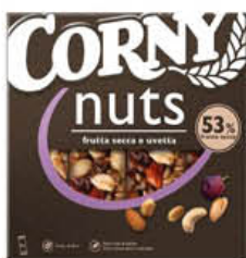
CORNLY NUTS BARRETTE CEREALI 96 GR