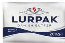
LURPAK BURRO SALATO 200 GR