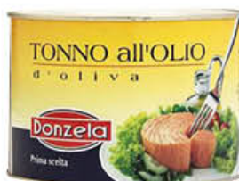
DONZELA TONNO IN OLIO DI OLIVA 1,73 KG