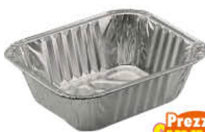
CONTITAL CONTENITORI ALLUMINIO RETTANGOLARI 1 P R10G