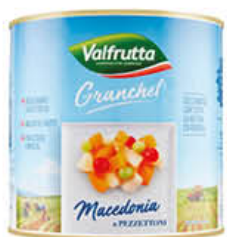
VALFRUTTA MACEDONIA GRANCHIEF 2,9 KG