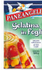
PANEANGELI GELATINA IN FOGLI 12 GR