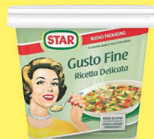
STAR DADO GUSTO FINE 1 KG