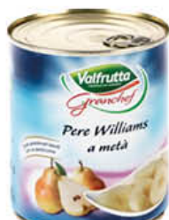
VALFRUTTA PERE SCIROPATE GRAN CHEF 1 KG