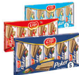
LAGO POKER TUTTI I TIPI 45 GR X 5