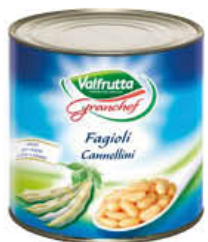
VALFRUTTA GRAN CHEF FAGIOLI CANNELLINI 2,6 KG