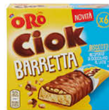
SAIWA BARRETTA ORO CIOK 162 GR