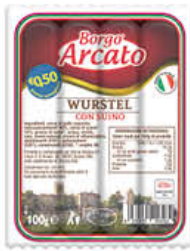
BORG ARCATO WURSTEL SUINO 100 GR