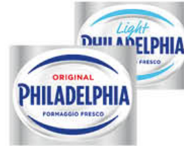
PHILADELPHIA CLASSICA/ LIGHT 80 GR