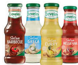
DEVELEY SALSE VARI TIPI 250 ML