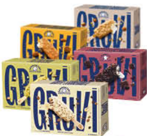
SAMMONTANA STECCO GRUVI X 4