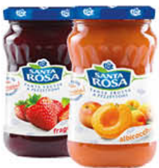
SANTA ROSA CONFETTURE CLASSICHE 350 GR