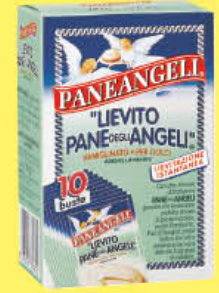
PANEANGELI 10 BUSTE