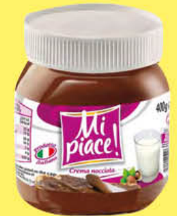
MI PIACE CREMA SPALMABILE NOCCIOLA 400 GR