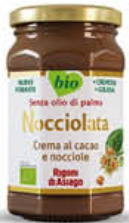
RIGONI DI ASIAGO NOCCIOLATA CON LATTE 250 GR