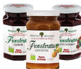
RIGONI CONFETTURE VARI TIPI 250 GR