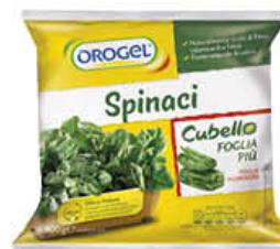
OROGEL SPINACI FOGLIA PIU' 900 GR