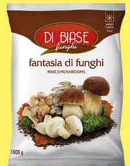
DI BIASE FANTASIA DI FUNGHI 1 KG