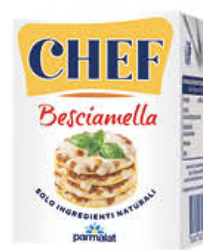
PARMALAT BESCIAMELLA CHEF 200 ML