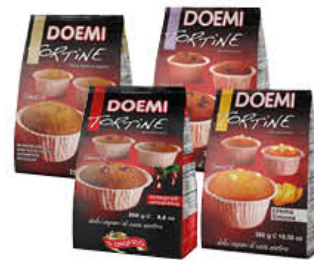
DOEMI TORTINE SPECIALI 300 GR