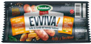
EVVIVA WURSTEL POLLO E TACCHINO 250 GR