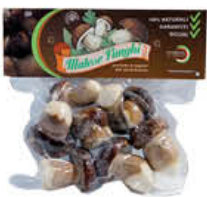
MATESE FUNGHI PORCINI BOCCILO 300 GR