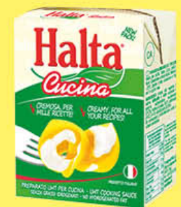
HALTA PREPARATO VEGETALE CUCINA 200 ML