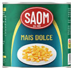
SAOM MAIS DOLCE LATTA 2,6 KG