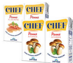
PARMALAT PANNA AGLI AROMI TUTTI I TIPI 125 GR X 2