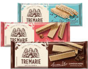
TRE MARIE WAFER 175/140 GR