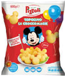
PIZZOLI CROCCOMAGIE TOPOLINO 600 GR