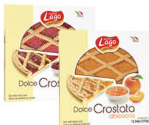
LAGO CROSTATE CLIEGIA/ALBICOCCA 350 GR