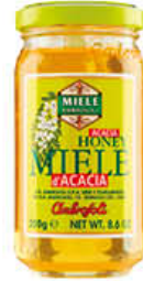
AMBROSOLI MIELE D'ACACIA VASO VETRO 250 GR