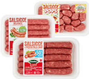
AMADORI SALSICCIA - 50%GRASSI/ DELICATA/POPS 360/400 GR