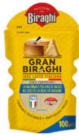
GRANBIRAGHI GRATTUGIATO 100 GR