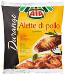
AIA ALI COTTE DURANGO 600 GR