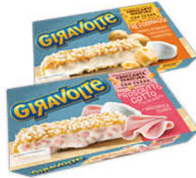
CASA MODENA GIRAVOLTE 170/150 GR