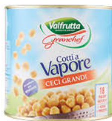
VALFRUTTA GCHEF CECI 2,6 KG