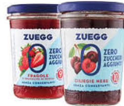
ZUEGG CONFETTURA ZERO ZUCCHERI 220 GR