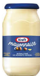
KRAFT MAYONNAISE 490 ML