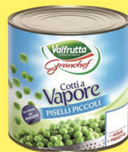
VALFRUTTA GCHEF PISELLI PICCOLI 2,6 KG