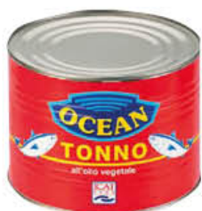
OCEAN TONNO OLIO VEGETALE 1,730 KG