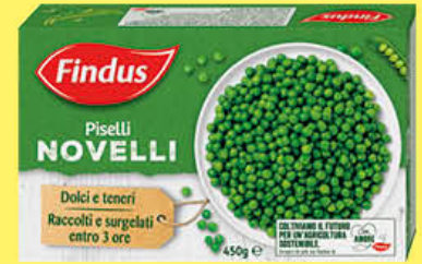
FINDUS PISELLI NOVELLI 450 GR