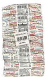
FATIGATI PALETTA LEGNO CAFFE IMB X50