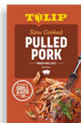
TULIP PULLED PORK 550 GR