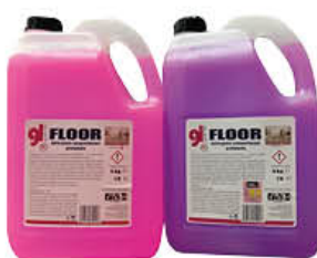
FLOOR LAVAPAVIMENTI PRIMAVERA/FIOR LOTO 5 KG