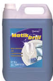
MATIK BRILL LAVASTOVIGLIE 5 LITRI