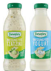
DEVELEY DRESSING 230 ML