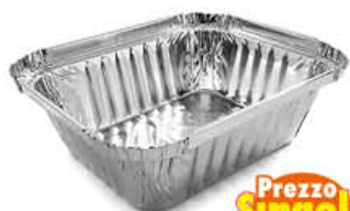
CONTITAL CONTENITORE ALLUMINIO RETTANGOLARE 1P R28L