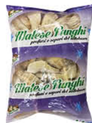
MATESE FUNGHI CARCIOFI SPICCHI 450 GR