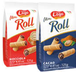
LAGO MINI ROLL WAFER CACAO/NOCCIOLA 125 GR