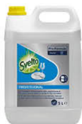
SVELTO LIQUIDO LAVASTOVIGLIE 5 LITRI