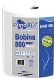
PAPERBLU BOBINA 2 VELI 800 STRAPPI