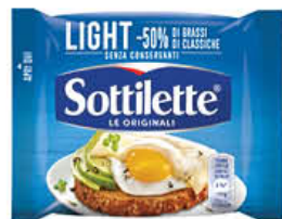
MONDELEZ SOTTILETTE LIGHT 200 GR