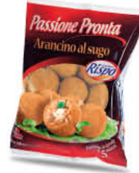
RISPO ARANCINI MEDI PRONTO FORNO 500 GR