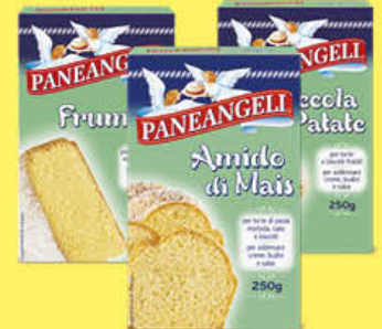
PANEANGELI FECOLA DI PATATE/ AMIDO DI MAIS/FRUMINA 250 GR