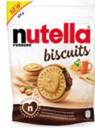
NUTELLA BISCUITS 304 GR