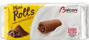
BALCONI MINI ROLLS CACAO X 6 180 GR