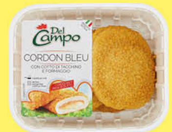
DEL CAMPO CORDON BLEU 250 GR