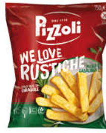
PIZZOLI PATATE WE LOVE RUSTICHE 750 GR