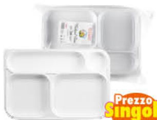
ARISTEA VASSOIO 4 SCOMPARTI