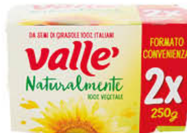
VALLE MARGARINA CLASSICA 250 GR X 2