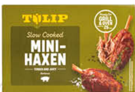
TULIP MINI STINCHI 500 GR