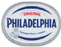
PHILADELPHIA CLASSICA 250 GR