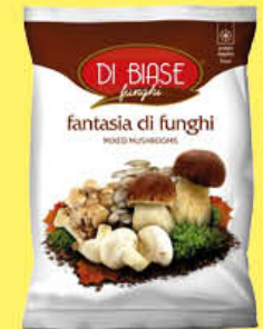
DI BIASE FANTASIA DI FUNGHI 300 GR