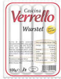
CASCINA VERRELLO WURSTEL 100 GR