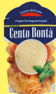
BIRAGHI GRATTUGIATO CENTO BONTÀ 100 GR