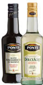
PONTI ACETO DOLCEAGRO/ BALSAMICO DI MODENA 50 CL