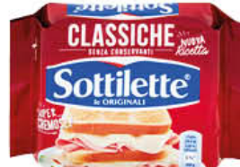
MONDELEZ SOTTILETTE 200 GR