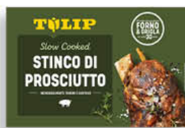
TULIP STINCO DI SUINO COTTO 600 GR