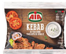
AIA KEBAB 300 GR