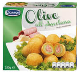
SOAVEGEL OLIVE ALL'ASCOLANA 250 GR