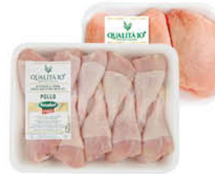
AMADORI FUSI DI POLLO/ SOVRACOSCE MAXI AF10+ AL KG