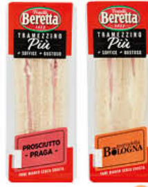
BERETTA TRAMEZZINI PROSCIUTTO COTTO/ COTTO PRAGA/ MORTADILLA 140 GR