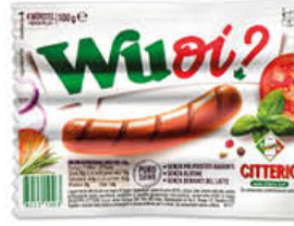
CITTERIO WUOI WURSTEL 100 GR