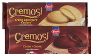
TONON BISCOTTI CREMOSI 150 GR