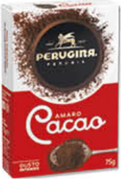
PERUGINA CACAO AMARO 75 GR