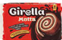
MOTTA GIRELLA 8 PZ