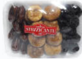
LA STUZZICANTE TRIS FANTASIA 400 GR