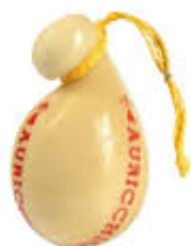
AURICCHIO CACIOCAVALLO T2 AL KG