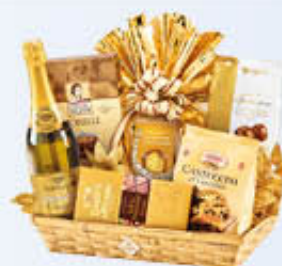
RE REGALO CONFEZIONE MERLINO