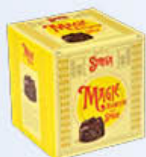
ALBERTI MAGIE STREGA ASSORTITE 200 GR