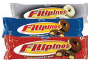
FILIPINOS DARK/WHITE E LATTE 128 GR