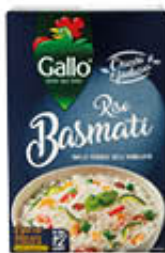
GALLO RISO BASMATI 500 GR