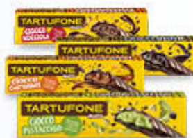
MOTTA TARTUFONE BARRA 150 GR