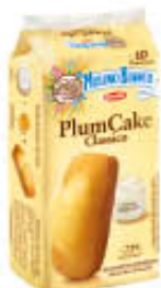
MULINO BIANCO PLUMCAKE X 10