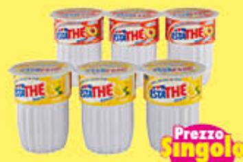
ESTATHE' LIMONE/PESCA BICCHIERE 20 CL