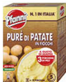
PFANNI PURE DI PATATE FIOCCHI 300 GR 4 BS X 75 GR