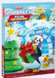
POLARETTI CALENDARIO AVVENTO 200 GR