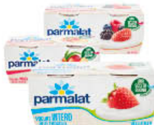
PARMALAT YOGURT TUTTI I TIPI 125 GR X 2