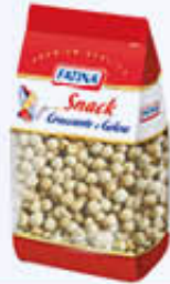
FATINA CECI TOSTATI SALATI 250 GR