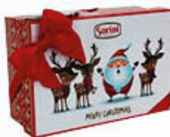
SORINI SCATOLA CHRISTMAS LANA 300 GR