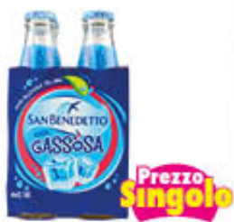
SAN BENEDETTO GASSOSA VETRO 18 CL