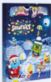
SMARTIES CALENDARIO AVVENTO 193,9 GR