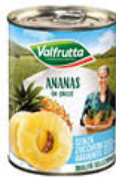
VALFRUTTA ANANAS GR 565