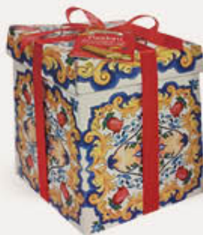
VALENTINO PANETTONE CLASSICO IN CAPPELLIERA 1 KG