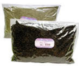
AROMI BARRA PEPE NERO INTERO/ MACINATO 1 KG