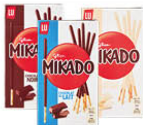
MIKADO CIOCCOLATO AL LATTE/FONDATE/ BIANCO 75 GR