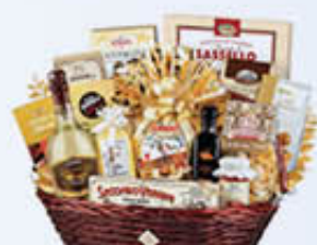
RE REGALO CONFEZIONE TRISTANO