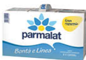
PARMALAT LATTE PARZIALMENTE SCREMATO BRICK - 1 LITRO X 6