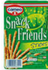
CAMEO STICKS SALATI 100 GR