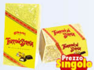
STREGA TORRONE MIGNON IN SCATOLA GRANDE