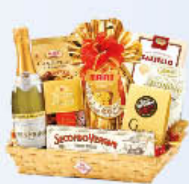
RE REGALO CONFEZIONE MY LORD