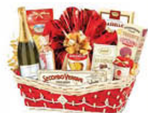
RE REGALO CONFEZIONE UMBERTO