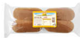
STER MAXI HOT DOG 300 GR