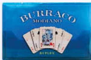
MODIANO CARTE BURRACO CRISTALLO