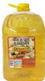
DESANTIS OLIO SEMI ARACHIDE PET 10 LITRI