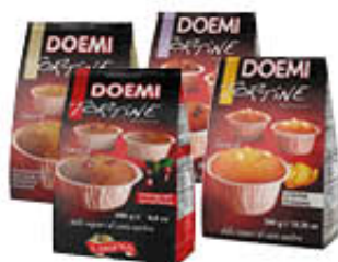
DOEMI TORTINE SPECIALI 300 GR