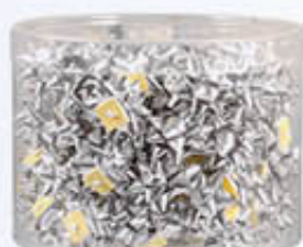
250 COCCARDE METALLICHE CM 5