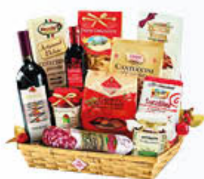
RE REGALO CONFEZIONE SOFIA