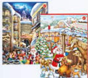
RIEGELEIN CALENDARIO AVVENTO 75 GR