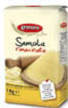
GRANORO SEMOLA RIMACINATA 1 KG