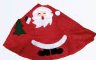
COPRIBASE ALBERO NAT. CM 80