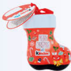
KINDER MIX LATTA 34 GR