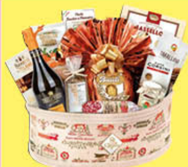
RE REGALO CONFEZIONE ULISSE