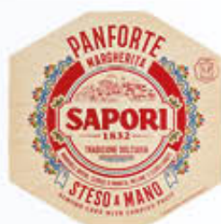
SAPORI PANFORTE MARGHERITA 320 GR