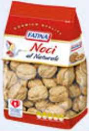
FATINA NOCI NATURALI PREMIUM 350 GR