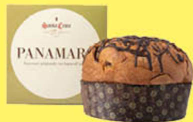
SANTA CROCE PANAMARO PANETTONE 1 KG