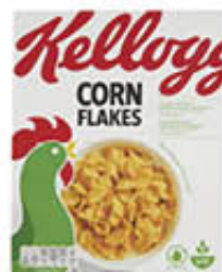
KELLOGG'S CORN FLAKES ORIGINAL 375 GR