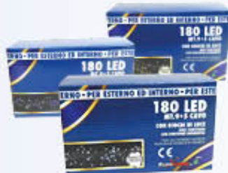
SERIE LUMINOSA INTERNO/ESTERNO 180 LED MOTORIZZATA