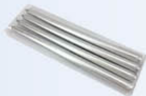
4 CANDELE LISCE ARGENTO