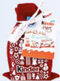
FERRERO HAPPYSNACK SACCO NATALE X 10