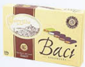
BORRILLO 1891 BACI ASSORTITI 200 GR