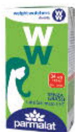
PARMALAT LATTE PUNTO SCREMATO UHT 500 ML