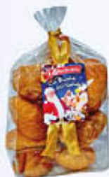
LA STUZZICANTE FICHI GIGANTI SACCHETTO 200 GR