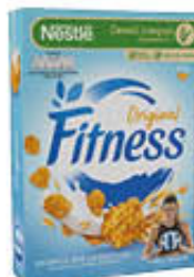
NESTLÉ CEREALI FITNESS 375 GR