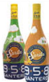
SANTERO APERITIVO SPRITZ ALCOLICO/ANALCOLICO 75 CL