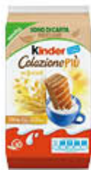
KINDER COLAZIONE PIÙ 10 PEZZI