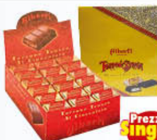
ALBERTI TORRONE CIOCCOLATO/ CLASSICO 20 GR