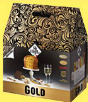
RE REGALO GOLD/SILVER