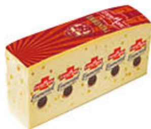
ENTREMONT EMMENTAL SV AL KG