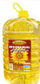
DESANTIS OLIO GIRASOLE ALTOLEICO 10 LITRI