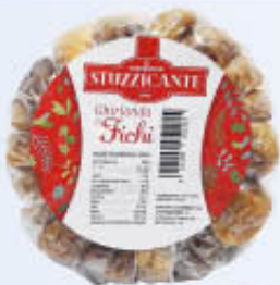
LA STUZZICANTE FICHI GARLAND 200 GR