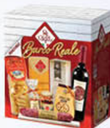
RE REGALO BARCO REALE