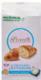
BAULI CROISSANT CLASSICI 40 GR X 6