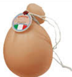
LATTERIA SORESINA CACIOCAVALLO AFFUMICATO AL KG