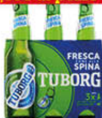
TUBORG BIRRA IN CLUSTER 33 CL X 3