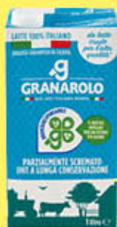
GRANAROLO LATTE PS 1 LITRO