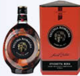
VECCHIA ROMAGNA ETICHETTA NERA 70 CL