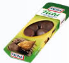
FATINA FICHI CIOCCOLATO FONDENTE ASTUCCIO 180 GR