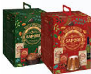
SAPORI STRENNIA PANDORO/PANETTONE 6 PEZZI