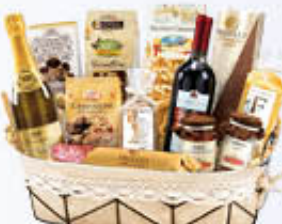
RE REGALO CONFEZIONE CANOSSA