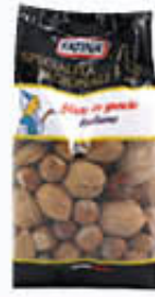
FATINA MISTO IN GUSCIO 3 GUSTI 500 GR