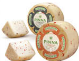
BRIGANTE FORMAGGIO AL PEPE E AL PEPERONCINO AL KG