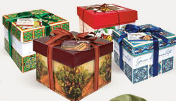
VALENTINO PANETTONE FARCITO IN CAPPELLIERA 1 KG