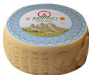
VERRELLO ASIAGO FORMA AL KG