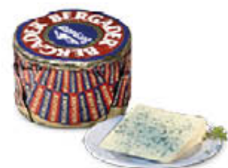
BERGADER FORMA ROTONDA/ RETTANGOLARE AL KG