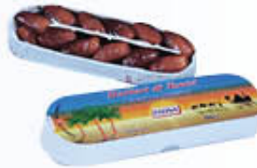
FATINA DATTERI 250 GR