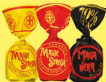
ALBERTI MAGIE SFUSE AL KG