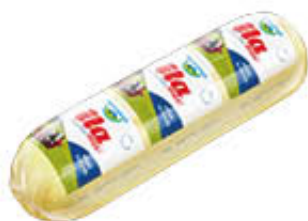
BAYERLAND FORMAGGIO FILATO T5 SV AL KG