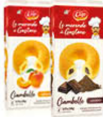
LAGO CIAMBELLA ALBICOCCA/ CIOCCOLATO X 6 - 240 GR