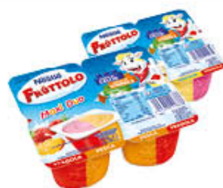
FRUTTOLO MAXI DUO 400 GR