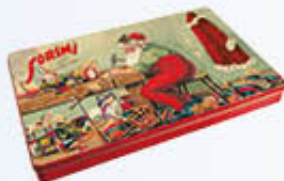
SORINI LATTA CHRISTMAS CIOCCOLATINI 185 GR