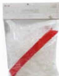
KIT PAGLIA + NASTRO +FOGLIO