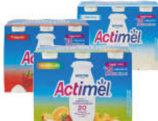
DANONE ACTIMEL FRUTTA GUSTI ASSORTITI 100 GR X 6