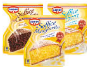
CAMEO TORTE FRESCHE 550/650 GR