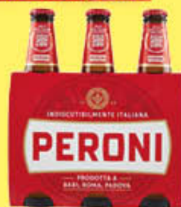
PERONI BIRRA VETRO 33 CL X 3