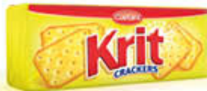
KRIT CRACKERS 100 GR