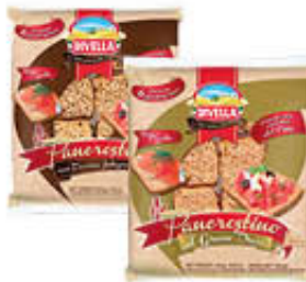
DIVELLA PANCROSTINI CLASSICI/INTEGRALI 250 GR