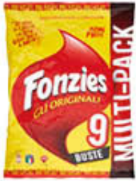
FONZIES MULTIPACK 212 GR