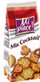
MI PIACE MIX COCKTAIL 500 GR