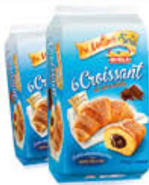
DIVELLA CROISSANT VARI TIPI 35/40/45 GR X 6