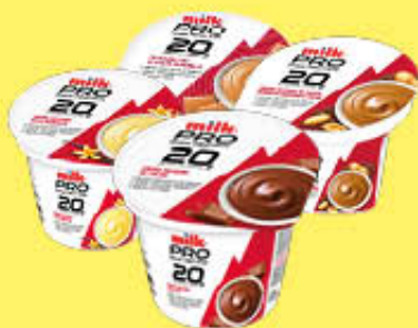
MILK PRO CREMA DESSERT 200 GR