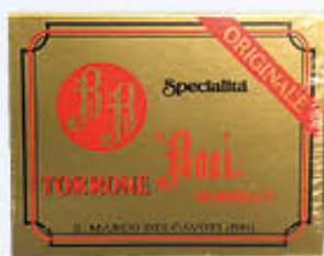
BORRILLO BACI ORO 300 GR