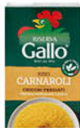
GALLO RISO CARNAROLI 1 KG