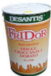
DESANTIS FRIDOR OLIO VEGETALE 25 LITRI