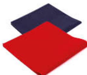
MACARENA COPRIMACCHIA TNT 100X100 x 25 PZ