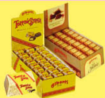
STREGA/GLORIA TORRONE MIGNON IN DISPENSER X96