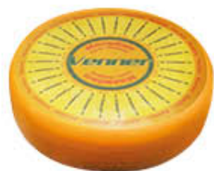
MAASDAMMER FORMA AL KG