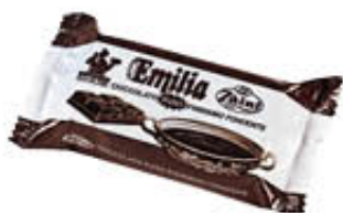
ZAINI EMILIA FONDENTE 1 KG