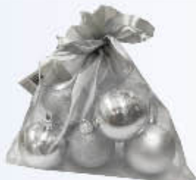
SFERE LISCE X 5 SACCHETTO VELO MM50