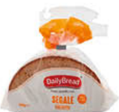
DAILY BREAD PANE DI SEGALE 500 GR