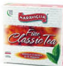
RISTORTA TE MARAVIGLIA 100 FILTRI