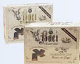
BORRILLO BACI TENERI CAFFÈ/GIANDUIA 300 GR