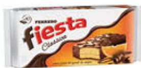
FIESTA CLASSICA 10 PEZZI