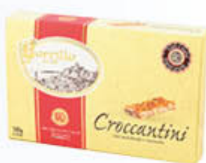
BORRILLO 1891 CROCCANTINI NUDI 180 GR