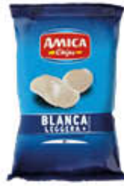
AMICA CHIPS PATATINE LA BLANCA 80 GR