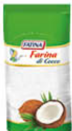
FATINA FARINA DI COCCO 200 GR