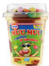
CAMEO MUU MUU+CONFETTI AL CIOCCOLATO 125 GR