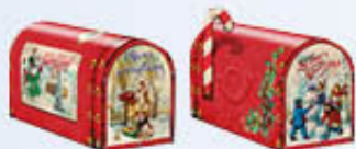
SORINI CASSETTA POSTALE CON CIOCCOLATO 300 GR