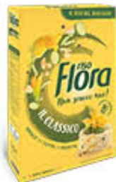
FLORA RISO 1 KG