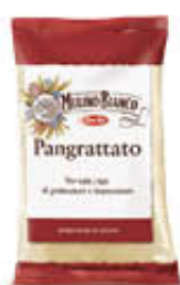
MULINO BIANCO PAN GRATTATO 400 GR