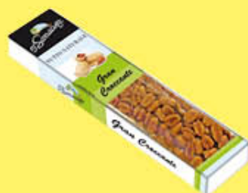
O SARRACINO CROCCANTE ARACHIDI 125 GR