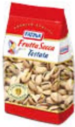
FATINA PISTACCHI TOSTATI SALATI 200 GR