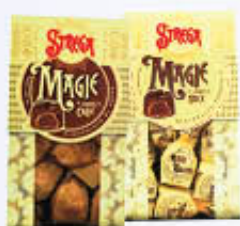
ALBERTI MAGIE LATTE/FONDENTE 250 GR