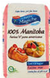
LO CONTE FARINA MANITOBA 1 KG