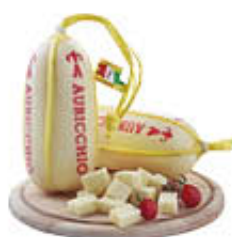
AURICCHIO PROVOLETTE GIOVANI AL KG