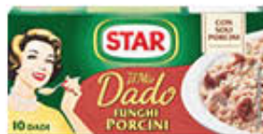
STAR DADO FUNGHI PORCINI 10 CUBI