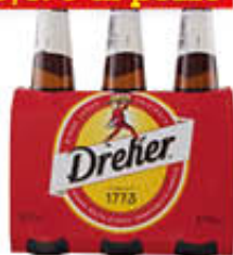
DREHER BIRRA 33 CL X 3