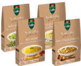
GALLO RISOTTI DA CHEF 175 GR