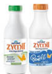
ZYMIL LATTE 1%GRASSI MAGRO/CALCIO 1 LITRO