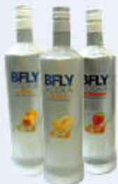
BFLY VODKA FRUTTA TUTTI I TIPI 1 LITRO