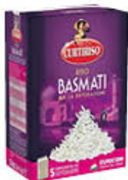
CURTIRISO PER RISTORAZIONE BASMATI AL KG