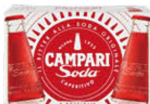
CAMPARI SODA CONFEZIONE 5 PEZZI