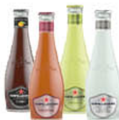
SAN PELLEGRINO BIBITE VETRO TUTTI I TIPI 20 CL