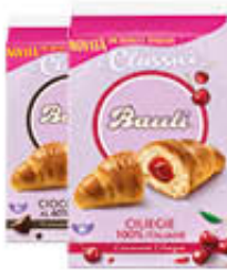
BAULI CROISSANT FARCITI TUTTI I TIPI 50 GR X 6