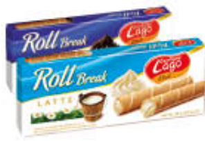
LAGO ROLL BREAK LATTE/CACAO 80 GR