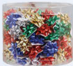
100 COCCARDE ADESIVE CM 7,5 COLORI ASS.