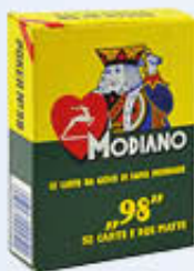
MODIANO CARTE POKER 98 ROSSO/BLU