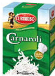
CURTIRISO RISO CARNAROLI PER RISTORAZIONE 1 KG