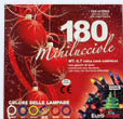
180 MINILUCCIOLE C/GIOCHI DI LUCE METRI 8,7