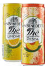
SAN BENEDETTO THE' LATTINA 33 CL