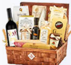
RE REGALO CONFEZIONE FORZIERE