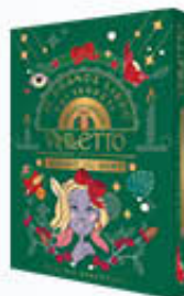
VIALETTO CALENDARIO AVVENTO 240 GR