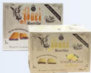
BORRILLO BACI TENERI LIMONE/ARANCIA 300 GR