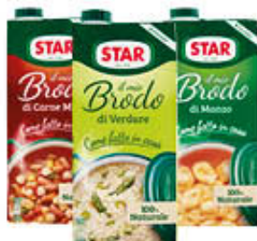
STAR BRODO PRONTO 1 LITRO