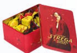
STREGA MAGIE ASSORTITE LATTE 200 GR