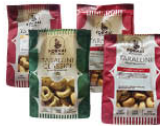
LA STUZZICANTE TARALLI 200 GR