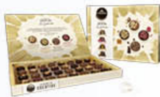
PRUGINA CONFEZIONE CIOCCOLATI ATELIER 186 GR