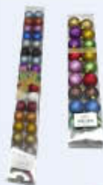
SFERE LUCIDE GLITTERATE MM 40/60/70