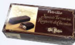
PETRILLO CROCCANTINI DEL FORTORE 300 GR