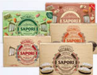
SAPORI RICCIARELLI CONFEZIONE REGALO 140/154 GR