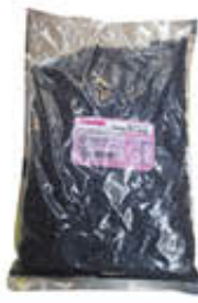
BARRA GOCCE DI CIOCCOLATO 1 KG