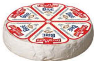
ENTREMONT FORMAGGIO BRIE T1 AL KG