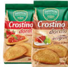
SANSEPOLCRO CROSTINI 275/300 GR