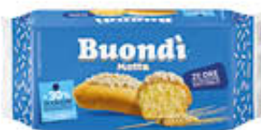
MOTTA BUONDI CLASSICO 6 PEZZI