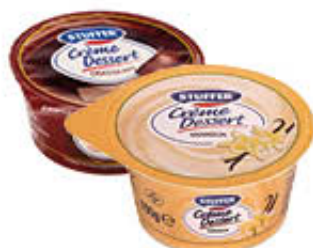
STUFFER CREMA DESSERT CACAO/VANIGLIA 150 GR