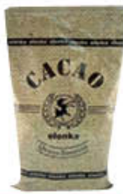
ELENKA CACAO AMARO 1 KG