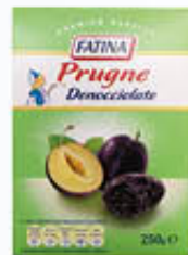
FATINA PRUGNE DENOCCIOLATE 250 GR