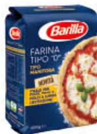
BARILLA FARINA 0 TIPO MANITOBA 1 KG