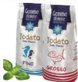
GEMMA SALE IODATO SACCO 1 KG