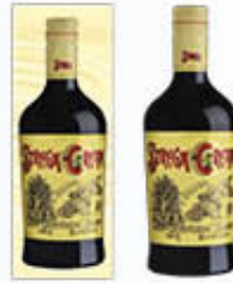
STREGA CREAM 70 CL