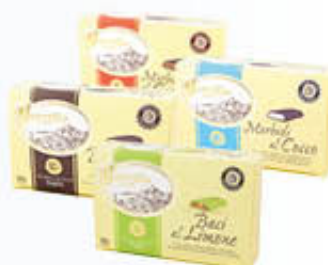
BORRILLO 1891 BACI LIMONE/ CAFFÈ MORBIDI COCCO/GIANDUIA 300 GR