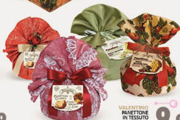
VALENTINO PANETTONE IN TESSUTO 1 KG