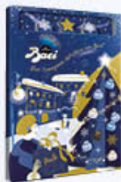
PERUGINA BACI CALENDARIO DELL' AVVENTO 300 GR