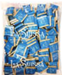
LA SVIZZERA CIOCCOLATINI NAPOLITAINI LATTE/FONDENTE 1 KG