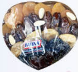
FATINA CESTINO CUORE FRUTTA SECCA 450 GR