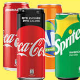
FANTA/SPRITE COCA COLA/ CLASSICA/ZERO LATTINA 33 CL