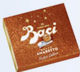
BACI PERUGINA AMARETTI CONFEZIONE NATALE 200 GR