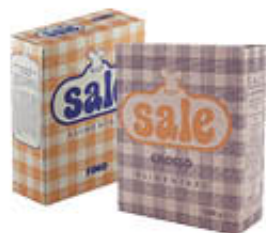
ITALKALI SALE ALIMENTARE FINO E GROSSO 1 KG