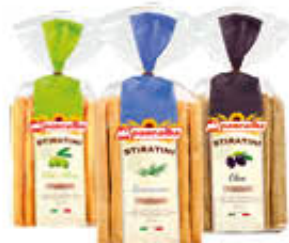
PANEALBA STIRATINI O.OLIVA/ OLIVE/ROSMARINO 150 GR