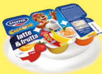
STUFFER LINEA BIANCA LATTE&FRUTTA 50 GR X 6