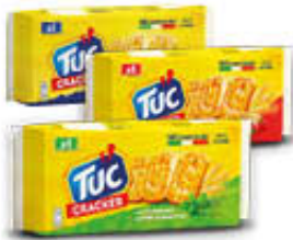
TUC CRACKER CLASSICI/ ROSMARINO/ POMODORO&GRANA 250 GR