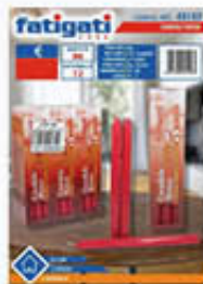
FATIGATI CANDELE ROSSE CM 25 3 PZ