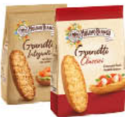
MULINO BIANCO GRANETTI CLASSICI/INTEGRALI 280 GR