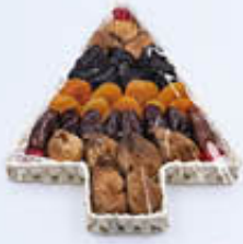
ALBERELLO FANTASIA DI FRUTTA 350 GR