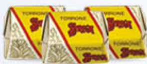
STREGA TORRONE MIGNON A PESO ACETATO AL KG