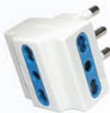
SPINA ADATTATORE TRIPLA 16 A