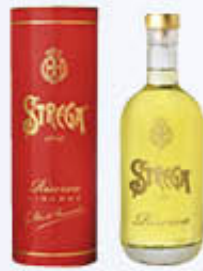
STREGA RISERVA ASTUCCIATA 70 CL