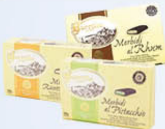
BORRILLO 1891 BACI MORBIDI PISTACCHIO RICOTTA E PERA/RHUM 300 GR