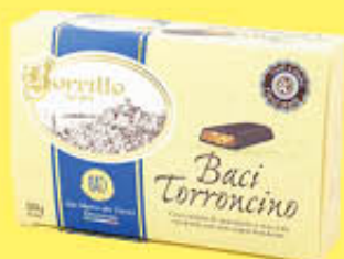
BORRILLO 1891 BACI TORRONCINO 300 GR