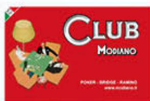
MODIANO CARTE RAMINO CLUB