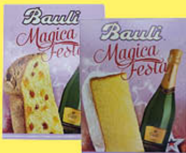
BAULI MAGICA FESTA PANDORO/PANETTONE +SPUMANTE SANT'ORSOLA