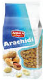
AMICA CHIPS ARACHIDI SALATE 1 KG