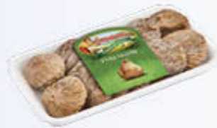
FATINA FICHI PULLED MORBIDI 250 GR