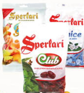
SPELARI CARAMELLE Sacchetti Tutti i Tipi 175/200 gr