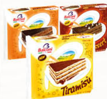
BALCONI TORTE Tiramisu/Viennese Choco Dessert 400 gr