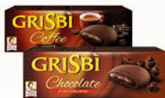
MR DAY GRISBI® CLASSIC 150 gr