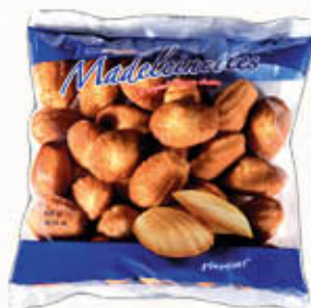
PLAYTIME MADELEINETTES 300 gr