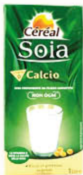
CEREAL SOIA CALCIO 1 Litro