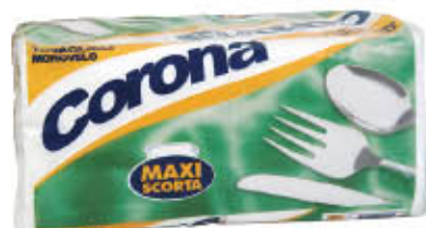
CORONA TOVAGLIOLI MONOVELO