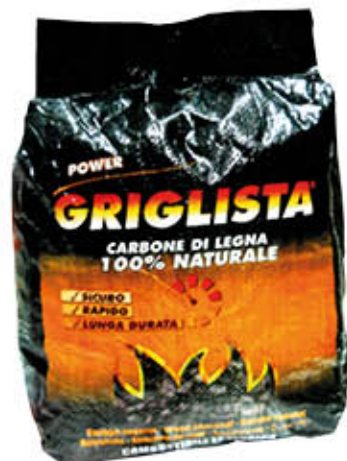
IL GRIGLISTA CARBONE DI LEGNA 2,5 Kg