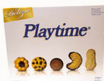
PLAYTIME PASTICCERIA LE DELIZIE 400 gr