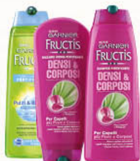
GARNIER FRUCTIS SHAMPOO/BALSAMO 250 ml Tutti i Tipi