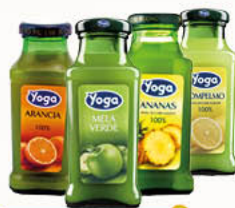
YOGA SUCCHI YOGA BAR Bottiglia Quadra Tutti i Tipi escluso Mirtillo