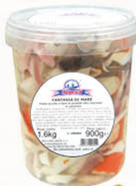
OROPESCA FANTASIA DI MARE Sgocciolato 900 gr