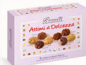
BAULI ATTIMI DOLCEZZA PASTICCERIA 300 gr