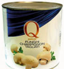
QUALITA' PIU' FUNGHI CHAMPIGNON TAGLIATI 2,5 Kg