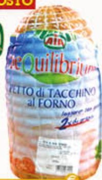
TARKY PETTO DI TACCHINO ROAST Al Kg