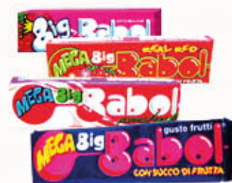
BIG BABOL MEGA