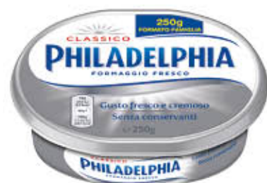
KRAFT PHILADELPHIA 250 gr