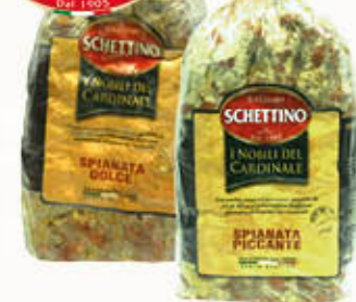
SCHETTINO SPIANATA DOLCE/ PICCANTE Meta' Sottovuoto Al Kg