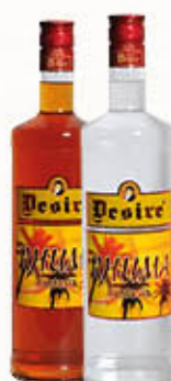
DESIRE RHUMA FANTASIA 50 cl