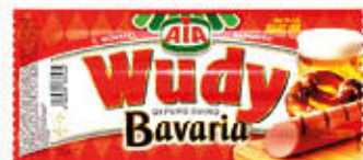
WUDY WURSTEL BAVARIA SUINO 250 gr