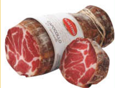
SCHETTINO CAPOCOLLO 1/2 SOTTOVUOTO Al Kg