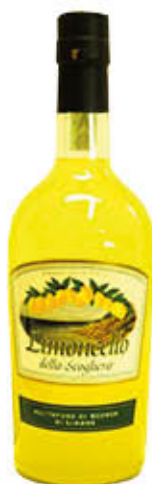
DILMOOR LIMONCELLO DELLA SCOGLIERA 30° 70 CL