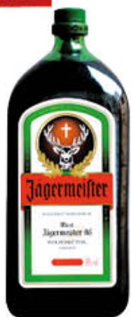
JAGERMEISTER 1 Litro