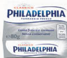
KRAFT PHILADELPHIA 80 gr