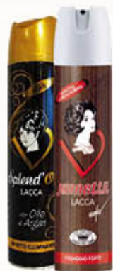
JANNETIL LACCA 300 ml