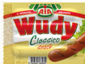
AIA WURSTEL CLASSICO SNACK 100 gr