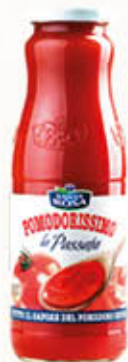
SANTA ROSA PASSATA POMODORO 700 gr