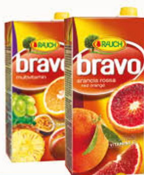
BRAVO SUCCHI BRIK 2 Litri