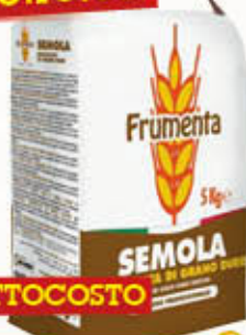
FRUMENTA SEMOLA RIMACINATA 5 Kg