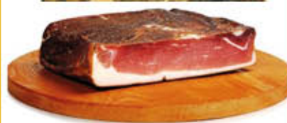
QUALITA' PIU' SPECK 1/2 SOTTOVUOTO Al Kg