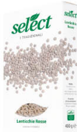
SELECT LENTICCHIE ROSSE 400 gr