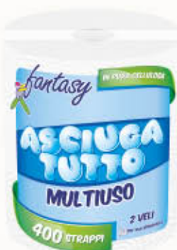
FANTASY ASCIUGATUTTO PURA CELLULOSA 2 VELI 400 Strappi