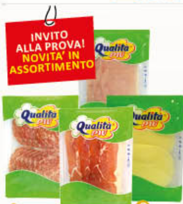
QUALITA' PIU' SALUMI E FORMAGGI Tutti i Tipi PREAFFETTATI 50/90 gr