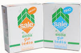
ITALKALI SALE IODATO ASTUCCIO 1 Kg