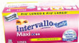
LINES ASSORBENTI INTERVALLO MAXI X 28