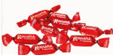
PERUGINA ROSSANA CARAMELLE Al Kg