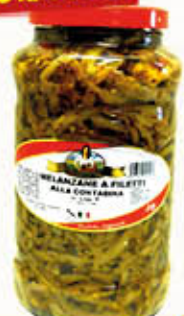
BELLA CONTADINA MELANZANE A FILETTI IN OLIO 3100 ml