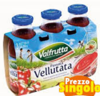
VALFRUTTA PASSATA VELLUTATA 350 gr