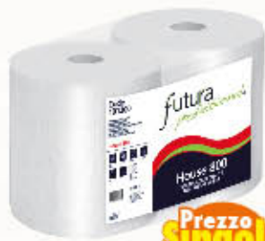
FUTURA PROFESSIONAL BOBINA PROFESSIONALE 800 STRAPPI 2 VELI