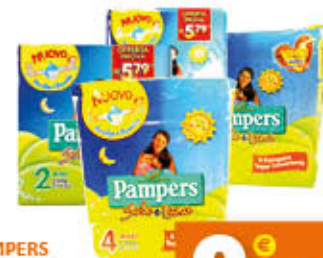
PAMPERS SOLE E LUNA PANNOLINI Tutti i Tipi