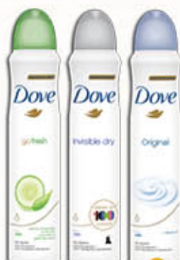
DOVE DEODORANTE SPRAY Tutti i Tipi 150 ml