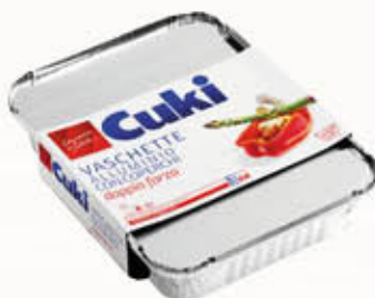
CUKI VASCHETTE CON COPERCHIO Tutti i Tipi