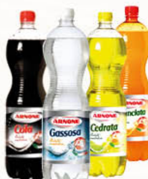
ARNONE BIBITE TUTTI I TIPI escluso cocktail Pet - 150 cl