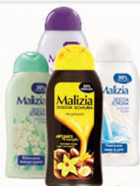
MALIZIA DOCCIASCHIUMA Tutti i Tipi 300 ml