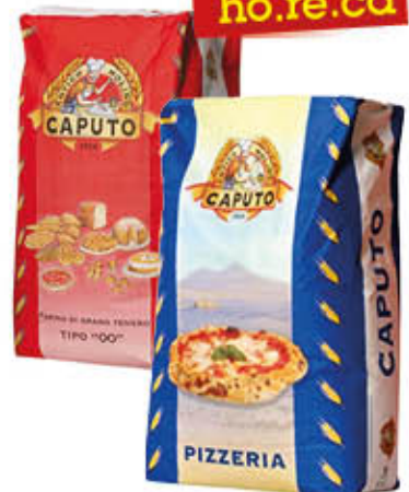
CAPUTO FARINA PER PIZZA BLU/ROSSA 25 Kg