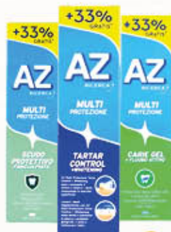
AZ DENTIFRICIO Protezione Carie Famiglia/Tartar Control 75 + 25 ml