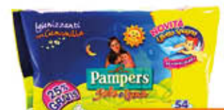
PAMPERS SALVIETTINE SOLE&LUNA X 54