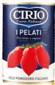
CIRIO I PELATI 400 gr