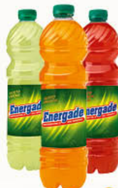
ENERGADE 1,5 Litri