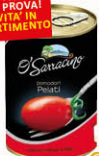
O'SARRACINO PELATI 400 gr

INVITO ALLA PROVA! NOVITA' IN ASSORTIMENTO