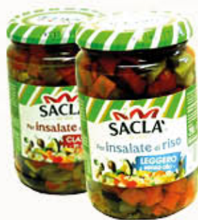
SACLA' CONDIVERDE PER INSALATE DI RISO 290 gr