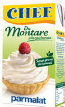
CHEF DA MONTARE 500 ml