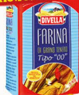
DIVELLA FARINA 00 5 KG