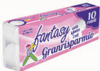
FANTASY CARTA IGIENICA 10 Rotoli 2 Veli