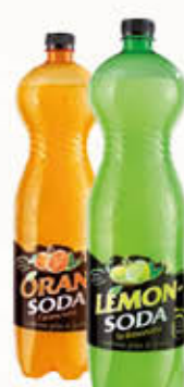
ORANSODA/ LEMONSODA Pet 1,5 Litri