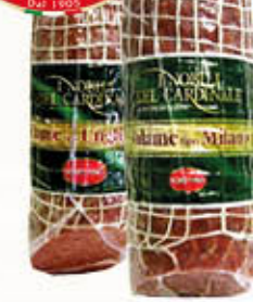
SCHETTINO SALAME TIPO Milano/Ungherese Meta SV - Al Kg