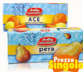
JOLLY COLOMBANI SUCCHI DI FRUTTA Tutti i Tipi 200 ml