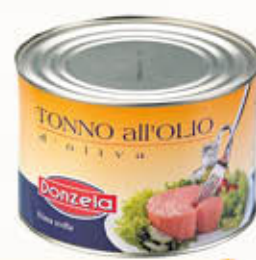
DONZELA TONNO IN OLIO DI OLIVA 1,73 Kg