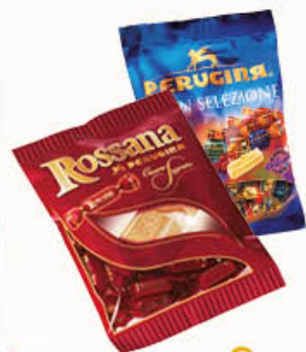
PERUGINA AMARLE GRANSELEZIONE 193 gr ROSSANA 194 gr