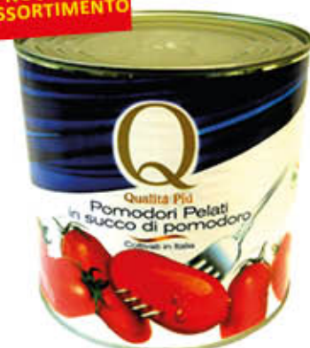
QUALITA' PIU' PELATI 2,5 Kg