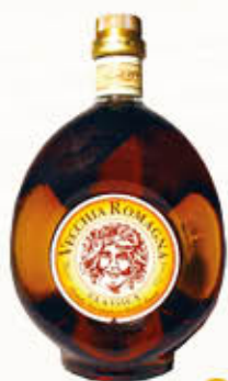
VECCHIA ROMAGNA ETICHETTA CLASSICA 700 ml