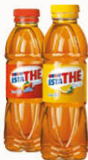
ESTATHE Limone/Pesca 500 ml