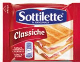
KRAFT SOTTILETTE 14 FETTE 400 GR