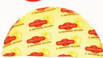
AURICCHIO PROVOLONE PICCANTE CLASSICO A SPICCHI TIPO K L'etto