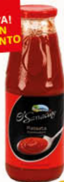
O' SARRACINO PASSATA POMODORO 680 gr

INVITO ALLA PROVA! NOVITA' IN ASSORTIMENTO