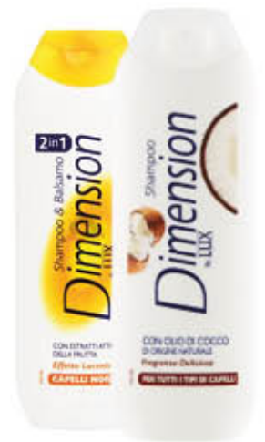
DIMENSION BY LUX SHAMPOO E 2 IN 1 - Tutti i tipi 250 ml