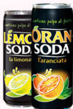
LEMONSODA ORANSODA LATTINA 33 cl