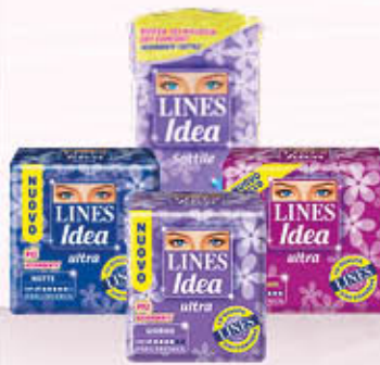
LINES IDEA ULTRA E SOTTILE Tutti i Tipi