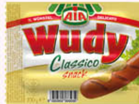
AIA WURSTEL CLASSICO SNACK 100 gr