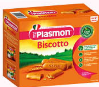
PLASMON QUADRUPLO 360 gr