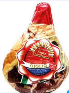
SANTA MARGHERITA PROSCIUTTO DISSOCCATO GIGLIO Al Kg