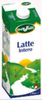
TRE VALLI LATTE INTERO 1 Litro