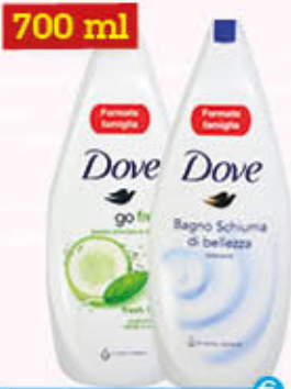
700 ml DOVE BAGNOSCHIUMA Tutti i Tipi 700 ml