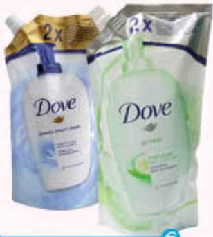
DOVE SAPONE LIQUIDO Tutti i Tipi RICARICA 500 ml