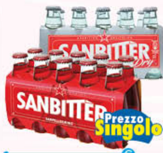
SAN PELLEGRINO BITTER Dry/Rosso 10 cl