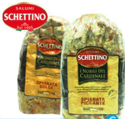
SCHETTINO SPIANATA DOLCE PICCANTE META' SOTTOVUOTO Al Kg