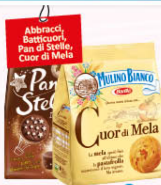
MULINO BIANCO BISCOTTI 300/350 gr