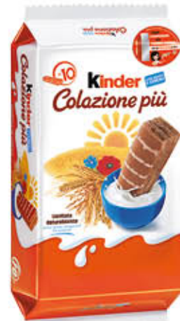
KINDER COLAZIONE x 10