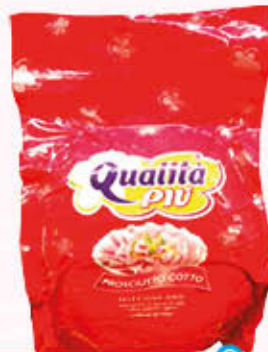
QUALITA'PIU' PROSCIUTTO COTTO SELEZIONE ORO Al Kg