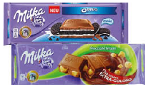
MILKA TAVOLETTA DI CIOCCOLATO Tutti i Tipi 250/300 gr