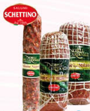
SCHETTINO SALAME Milano/Ungherese Metà SV Napoli - Al Kg