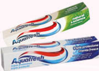
AQUAFRESH DENTIFRICO Tripla Protezione Menta Fresca 75 ml