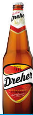
DREHER BIRRA 66 cl