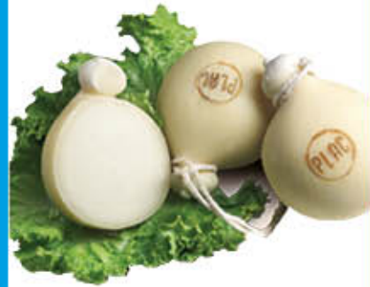
PLAC FIASCHETTA Al Kg