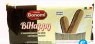
BONOMI SAVOIARDI CACAO/VANIGLIA 200 gr