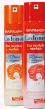
CADONETT LACCA 250 ml