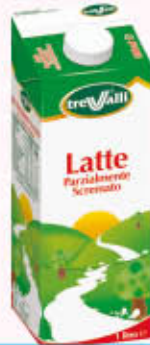
TRE VALLI LATTE PARZIALMENTE SCREMATO 1 Litro