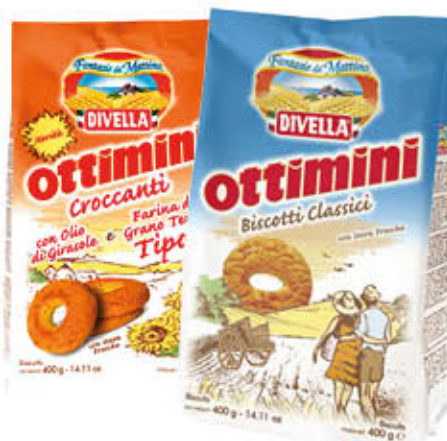
DIVELLA BISCOTTI Tutti i Tipi 300/400 gr