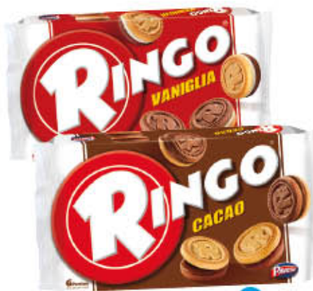
RINGO Vaniglia/Cacao x 6 330 gr