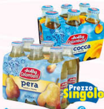
JOLLY COLOMBANI SUCCHI DI FRUTTA Tutti i Tipi Vetro - 125 ml