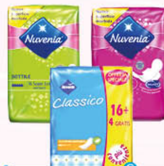
NUVENIA Sottile Base x 16 + 4 Ali e Super x 16