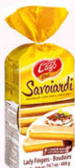
GASTONE LAGO ELLEDI SAVOIARDI 400 gr