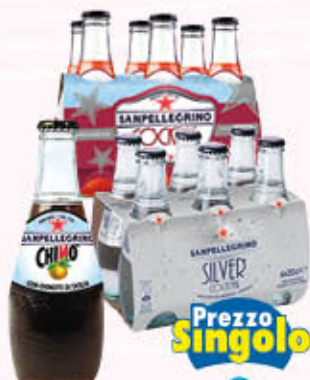
SAN PELLEGRINO BIBITE Tutti i Tipi Vetro 200 cc