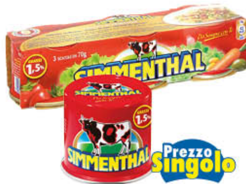
SIMMENTHAL CARNE IN GELATINA 70 gr