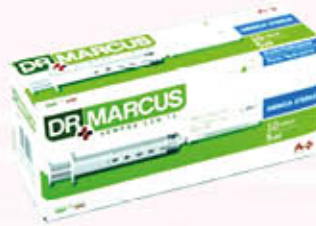
DR. MARCUS SIRINGHE STERILI 5 ml x 10