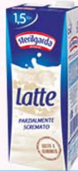
STERILGARDA LATTE P5 BRIKI 1,5 Litri