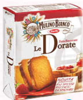
MULINO BIANCO FETTE LE DORATE 315 gr