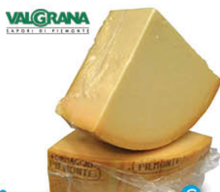
VALGRANA DEL PIEMONTE 1/8 SV Al Kg