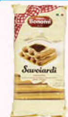
BONOMI SAVOIARDI CLASSICI 300 gr