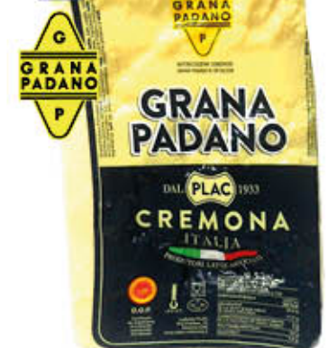
PLAC GRANA PADANO TK SV Al Kg