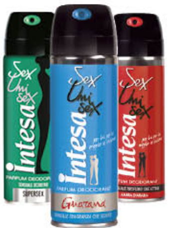
INTESA DEODORANTI SEX UNISEX SPRAY Tutti i Tipi 125 ml