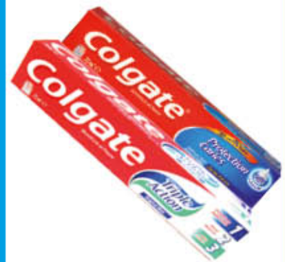
COLGATE DENTIFRICI Tutti i Tipi 75 ml