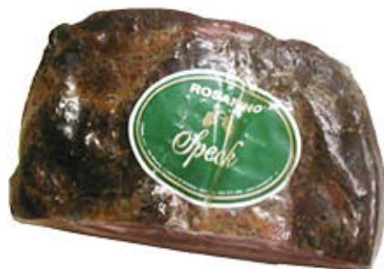
ROSAFINO SPECK Al Kg