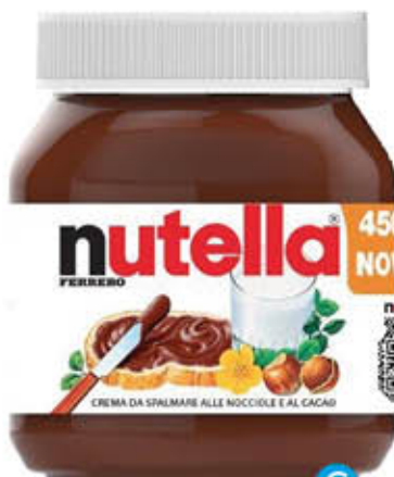
NUTELLA VASETTO 450 gr