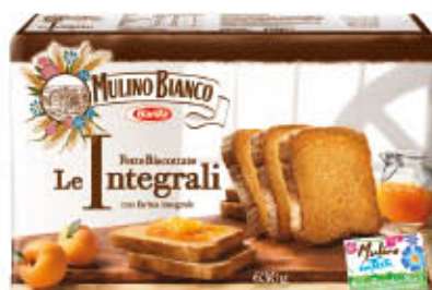
MULINO BIANCO FETTE BISCOTTATE LE INTEGRALI 630 gr