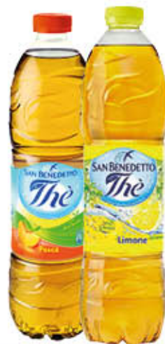
SAN BENEDETTO THE 1,5 Litri