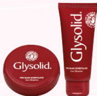
GLYSOLID SCATOLA/TUBO 100 ml