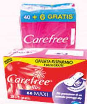
CAREFREE ASSORBENTI SCORTA Tutti i Tipi