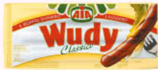
AIA WURSTEL WUDY CLASSICO 250 gr