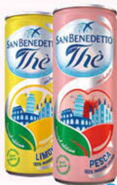
SAN BENEDETTO THE LATTINA 33 cl