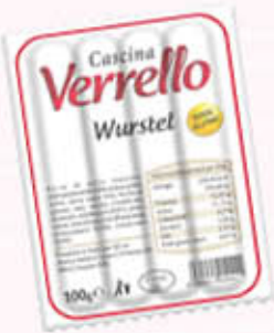
CASCINA VERRELLO WURSTEL 100 gr