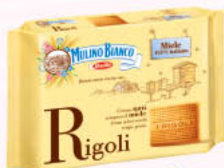
MULINO BIANCO BISCOTTI Rigoli 800 gr