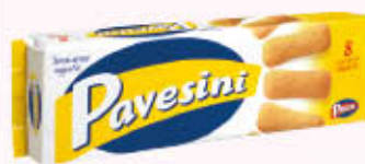
PAVESINI PAVESINI CLASSICI 200 gr