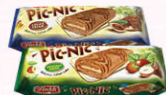
FREDDI ROLL PIC NIC Nocciola/Cacao 200 gr