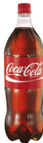
COCA COLA PET 1,5 Litri