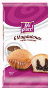
MI PIACE MAGDALENAS RIPIENE Nocciola/Cacao 220 gr