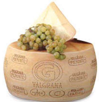
VALGRANA PIEMONTE FORME Al Kg