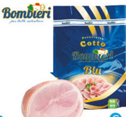
BOMBIERI PROSCIUTTO COTTO BLU Al Kg