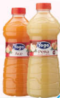
YOGO SUCCHI DI FRUTTA Tutti i Tipi 1 Litro