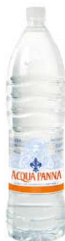
PANNA ACQUA MINERALE NATURALE 1,5 Litri