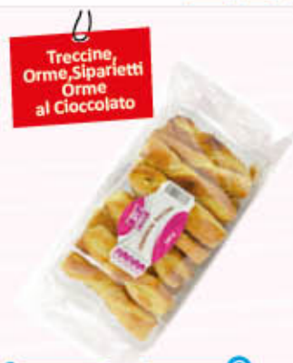
MI PIACE SFOGLIATINE 120/140 gr