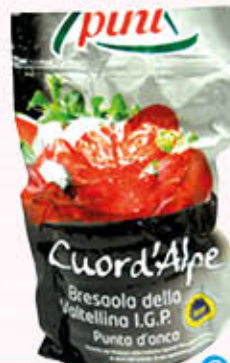
PINI BRESAOLA PUNTA D'ANCA IGP Al Kg