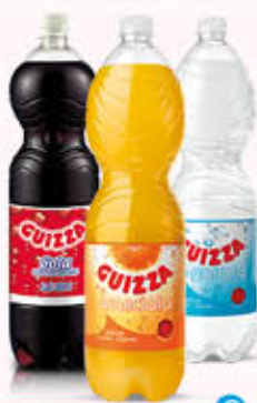
GUIZZA BEVANDE Tutti i Tipi 1,5 Litri