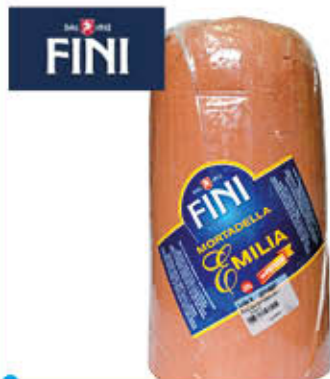
FINI MORTADELLA EMILIA Al Kg