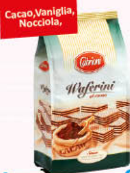
CABRIONI WAFERS Sacchetto 400 gr