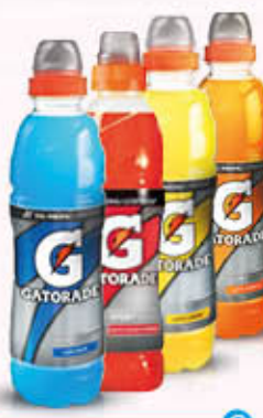
GATORADE BIBITA ISOTONICA Limone/Arancia Arancia Rossa/Cool Blue 50 cl