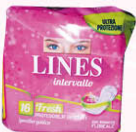
LINES INTERVALLO FRESH RIPIEGATO X 16