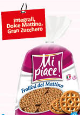
MI PIACE FROLLINI DEL MATTINO 1 kg