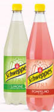
SCHWEPES SUCCHI DI FRUTTA Tutti i Tipi 1 Litro