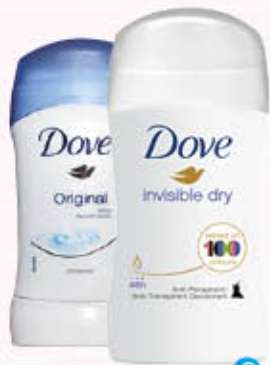
DOVE DEODORANTE STICK Tutti i Tipi 30 ml