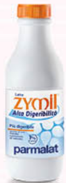
PARMALAT LATTE ZYMIL 1% DI GRASSI 1 Litro