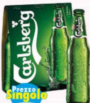
CARLSBERG BIRRA VETRO 33 cl