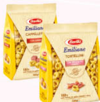
BARILLA CAPPELLETTI E TORTELLINI ALLA CARNE 500 gr