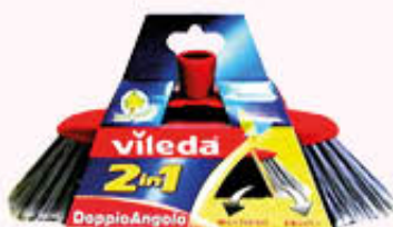
VILED A SCOPA DOPIPO ANGOLO 2 IN 1