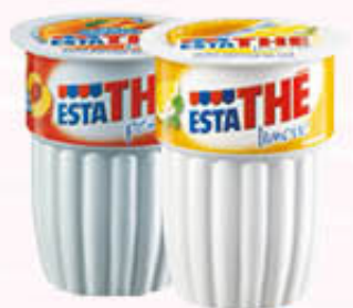
ESTATHE' Limone/Pesca Bicchieri 20 cl