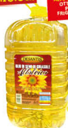
DESANTIS OLIO DI SEMI DI GIRASOLE ALTO OLEICO 10 Litri