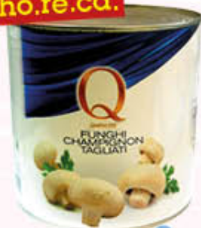
QUALITÀ PIÙ FUNGHI CHAMPIGNON 2,5 Kg