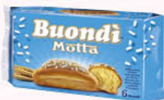
BUONDI MOTTA 6 Pezzi