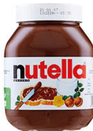
FERRERO NUTELLA Vasetto 825 gr