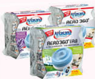
ARIASANA RICARICA PER DEUMIDIFICATORI INODORE/LAVANDA FRESCHEZZA PRIMAVERA 430 gr