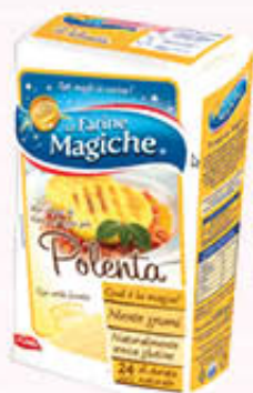
LO CONTE FARINA PER POLENTA 1 Kg