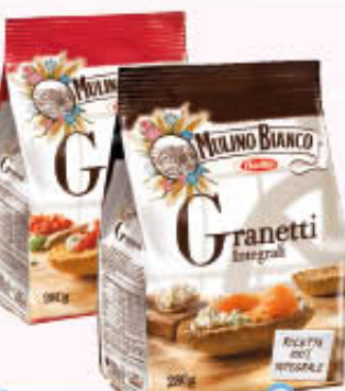
MULINO BIANCO GRANETTI Classici/Integrali 280 gr