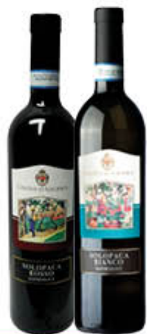
CANTINA DI SOLOPACA VINO SOLOPACA DOP BIANCO/ROSSO 75 CL