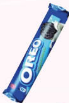
OREO BISCOTTI VANIGLIA TUBO 154 gr