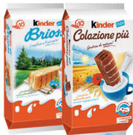
KINDER COLAZIONE PIÙ BRIOSS x 10