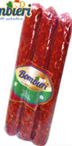
BOMBIERI SALSICCIA TIPO NAPOLI PICCANTE X 3 SV - Al Kg