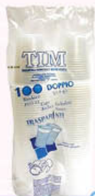
TIM 100 BICCHIERI MONOUSO TRASPARENTI 200 cc