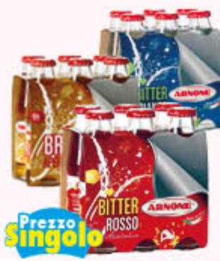
ARNONE APERITIVI DRY SODA/BRIO 10 cl