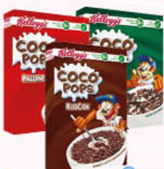
COCO POPS RISOCIOI/ BARCHETTE/PALLINE 375 gr