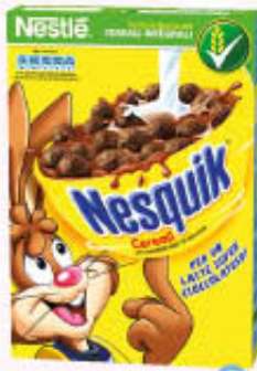
NESQUIK CEREALI 330 gr