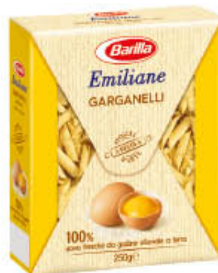
BARILLA PASTA ALL'UOVO SPECIALITA' CORTA Tutti i Tipi 250 gr