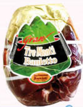
TRE MONTI PROSCIUTTO CRUDO BAULETTO Al Kg