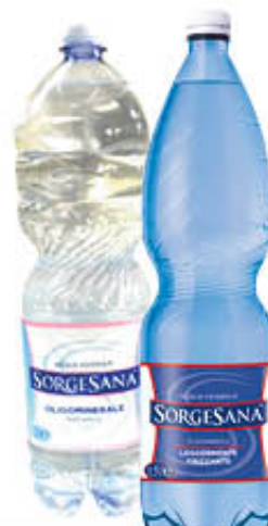
SORGESANA ACQUA MINERALE NATURALE Pet - 2 Litri LIEVEMENTE FRIZZANTE Pet - 1,5 Litri