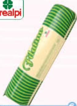
PREALPI FILATINO T.2 Al Kg