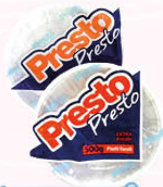
PRESTO PRESTO PIATTI 500 gr