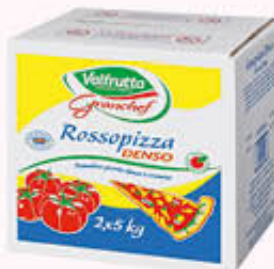
VALFRUTTA ROSSOPIZZA GRANCHEF 2 x 5 Kg