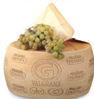
VALGRANA PIEMONTE FORME Al Kg