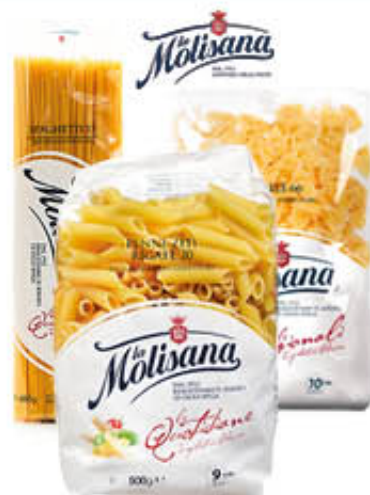
LA MOLISANA PASTA SEMOLA FORMATI NORMALI Tutti i Tipi 500 gr