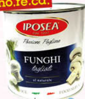
IPOSEA FUNGHI TAGLIATI AL NATURALE 2,4 Kg