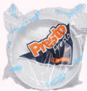
PRESTO PRESTO PIATTI DESSERT 50 Pezzi