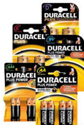
DURACELL PLUS PILA STILO e MINI X 4 TORCIA E MEZZA X 2 9V X 1