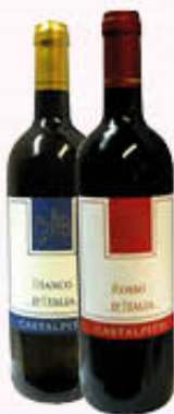
CASTALPITTI VINO D'ITALIA BIANCO/ROSSO 75 cl