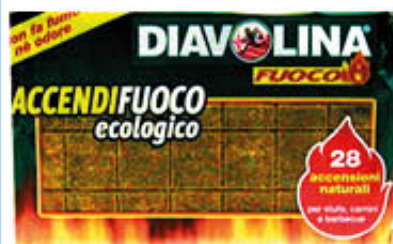
DIABOLINA ACCENDIFUOCO ECOLOGICO X 28