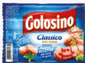
GOLOSINO WURSTEL 100 gr