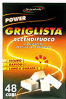
IL GRIGLISTA ACCENDIFUOCO x 48