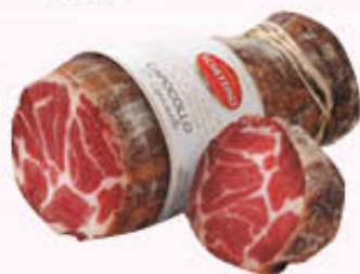
SCHETTINO CAPOCOLLO 1/2 SOTTOVUOTO Al Kg