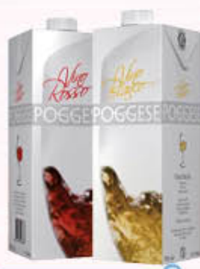
POGGESE VINO BRIK 1 Litro