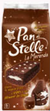
MULINO BIANCO PAN DI STELLE 8 Pezzi