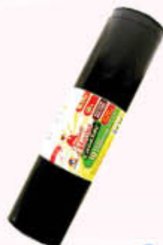
CASASAC SACCO CONDOMINIALE 130 Litri - 80 x 120 x 10