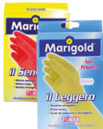
MARIGOLD GUANTI Il Sensibile Il Leggero Tutte le Misure