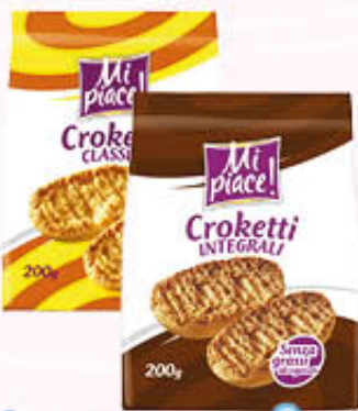
MI PIACE CROCCHETTI 200 gr