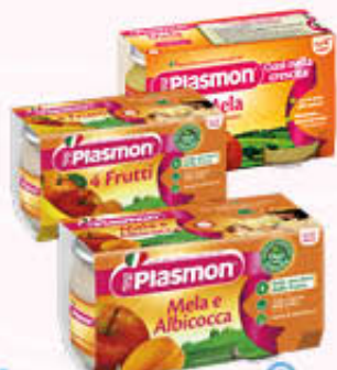
PLASMON OMOGENEIZZATI ALLA FRUTTA Tutti i Tipi 104 gr x 2