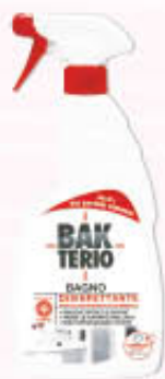
BAKTERIO MULTISUPEFICIE DISINFETTANTE SPRAY 750 ml