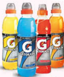
GATORADE BIBITA ISOTONICA Limone/Arancia Arancia Rossa Cool Blue - 50 cl