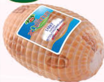
AIA TARKY PETTO TACCHINO ARROSTO MASCCHIO Al Kg