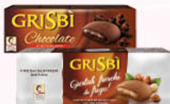
GRISBI CLASSIC Nociola/Cacao 150 gr