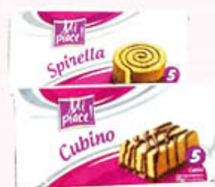
MI PIACE CUBINO x 5 SPIRELLA x 8