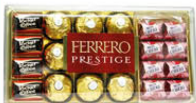
FERRERO PRESTIGE CONFEZIONE x 21