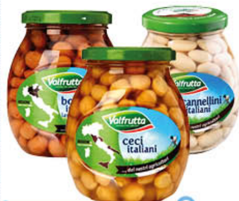
VALFRUTTA CECI/FAGIOLI CANNELLINI BORLOTTI Vetro - 360 gr