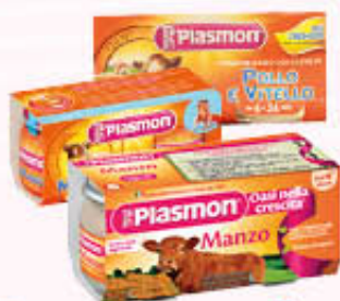
PLASMON OMOGENEIZZATI ALLA CARNE Tutti i Tipi 80 gr x 2