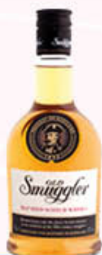
OLD SMUGGLER WHISKY 70 cl