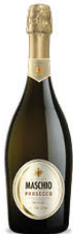
MASCHIO PROSECCO EXTRA DRY DOC TREVISO 75 CL