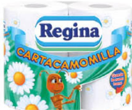
REGINA CARTA IGIENICA CAMOMILLA 4 ROTOLI