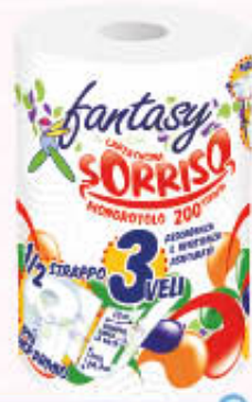
FANTASY SORRISO 3 VELI 200 1/2 STRAPPI