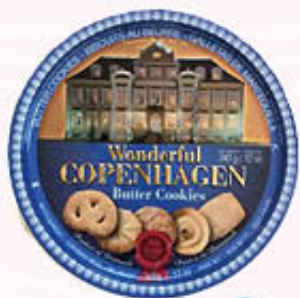
WONDERFUL COPENHAGEN BISCOTTI DANESI 340 gr