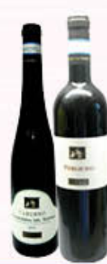
CANTINA DEL TABURNO DOC AGLIANICO FIDELIS/FALANGHINA DEL SANNIO 75 cl