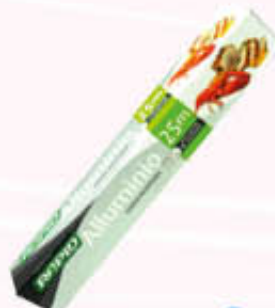
RAPID ALLUMINIO 25 Metri