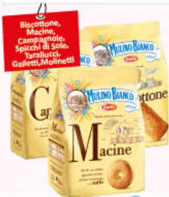
MULINO BIANCO BISCOTTI CLASSICI 700/800 gr