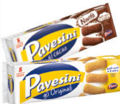
PAVESINI CLASSICI/CACAO 200 gr