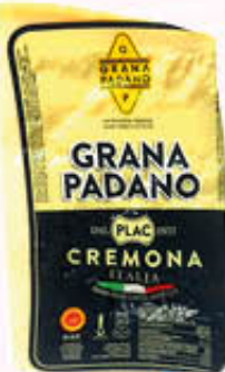
PLAC GRANA PADANO TIPO KILO SV Al Kg