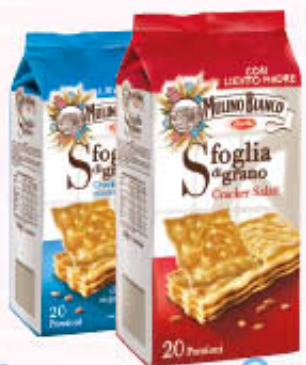
MULINO BIANCO CRACKERS SFOGLIA DI GRANO Salati/Non Salati 500 gr