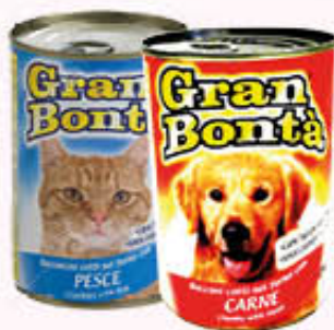
GRAN BONTÀ' BOCCONCINI CAN E/GATTO Tutti i Tipi 400 gr