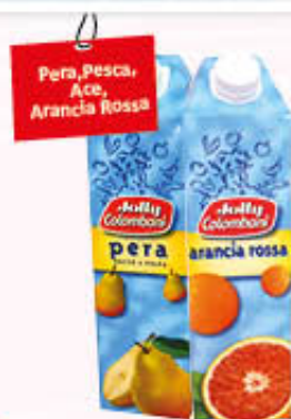
JOLLY COLOMBANI SUCCHI DI FRUTTA 1 Litro