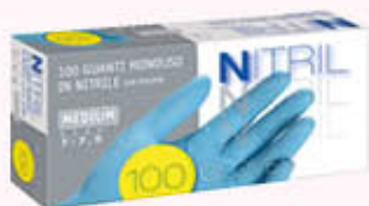
ICD GUANTI GUANTI NITRILE 100 pezzi Tutte le Misure