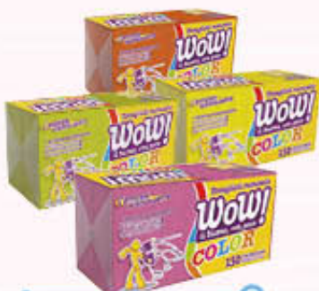
WOW TAVAGLIOLI COLORATI MONOVELO 33 x 33 150 Pezzi