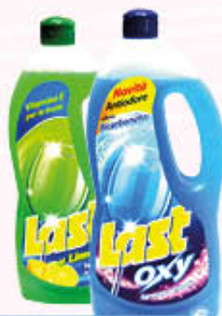
LAST LIQUIDO LIMONE E BICARBONATO 1 Litro