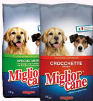
MIGLIOR CANE CROCCHETTE 4 Kg