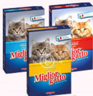
MIGLIOR GATTO CROCCHETTE Pesce/Carne/Pollo 400 gr