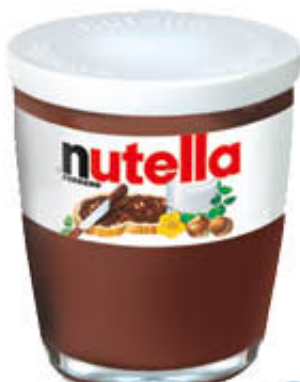
NUTELLA BICCHIERE 200 gr