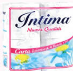
INTIMA CARTA IGIENICA ULTRAMORBIDA 3 VELI 4 ROTOLI