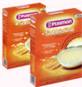
PLASMON PASTINA Tutti i Tipi 320/340 gr