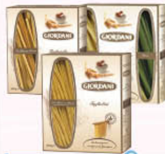
GIORDANI PASTA ALL'UOVO Tutti i Tipi 500 gr