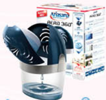
ARIASANA DEUMIDIFICATORE AERO 360° KIT