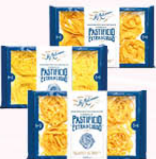
LA MOLISANA PASTA ALL'UOVO Tutti i Tipi 250 gr