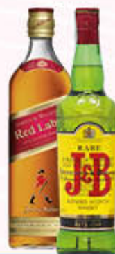
JOHNNY WALKER J&B WHISKY 70 cl