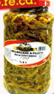
BELLA CONTADINA MELANZANE A FILETTI IN OLIO 3100 ml