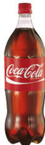
COCA COLA PET 1,5 Litri