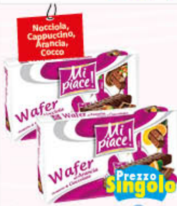
MI PIACE WAFER 38 gr