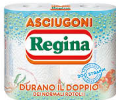
REGINA ASCIUGONI 2 ROTOLI