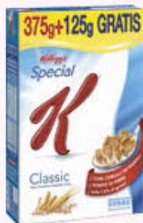
KELLOGG'S SPECIAL K CLASSIC 375 + 125 gr