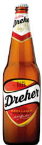
DREHER BIRRA 66 cl