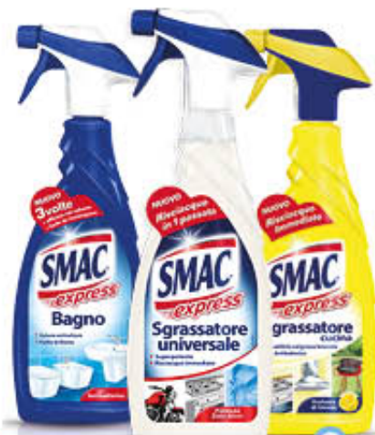
SMAC SPRAY EXPRESS Tutti i Tipi 650 ml