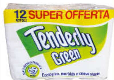
TENDERLY CARTA IGIENICA GREEN 12 ROTOLI