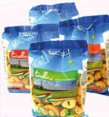
SAN TRIFONE TARALLINI BUSTA Tutti i Tipi 250 gr