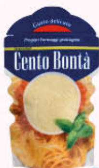
BIRAGHI GRATTUGIATO CENTO BONTÀ 100 gr