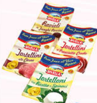
DIVELLA PASTA RIPIENA Tutti i Tipi 250 gr