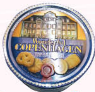
WONDERFUL COPENHAGEN BISCOTTI DANESI 908 gr