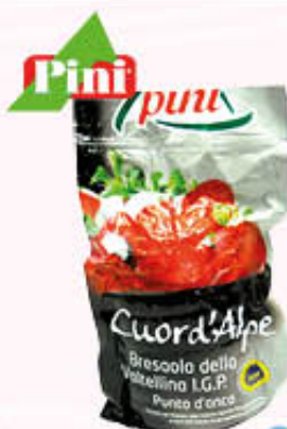
PINI BRESAOLA PUNTA D'ANCA IGP CUOR D'ALPE Al Kg