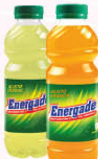
ENERGADE Arancia/Limone 50 cl