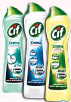
CIF CREMA 500 ml