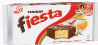
FIESTA CLASSICA 10 Pezzi