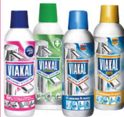
VIAKAL CASA Tutti i Tipi 500 ml