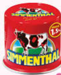
SIMMENTHAL CARNE IN GELATINA 215 gr