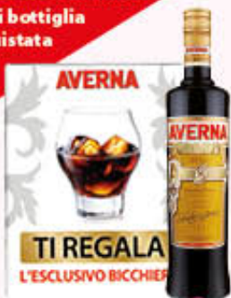
AVERNA AMARO 70 cl

OMAGGIO 1 bicchiere ogni bottiglia acquistata