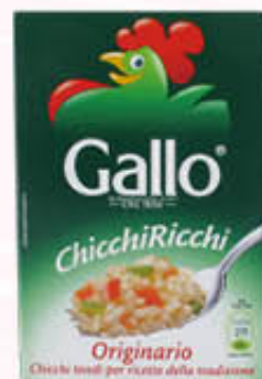
GALLO RISO ORIGINARIO 500 gr