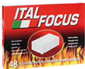
ITALFOCUS ACCENDIFUOCO 48 CUBI