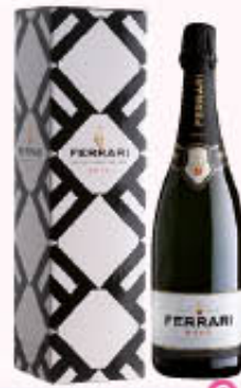
FERRARI SPUMANTE BRUT Astuccio 75 cl