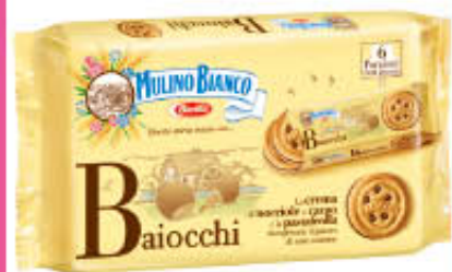
BAIOCCHI SNACK NOCCIOLA E CACAO 6 Pezzi