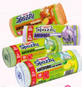
SPAZZY ANTIFORO PROFUMATI 15 Sacchi da 28 litri