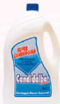
CANDIDALBA SUPER CANDEGGINA 4 Litri