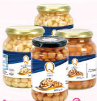
QUALITA' PIU' FAGIOLI 340 gr CECI 360 gr Vetro