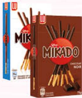
MIKADO CLASSICO Latte/Fondente 75 gr