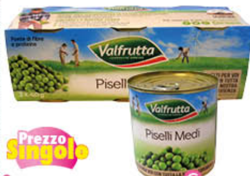
VALFRUTTA PISELLI MEDI LATTINA 410 gr