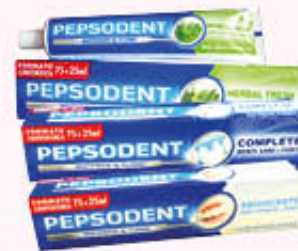
PEPSODENT DENTIFRICIO Tutti i Tipi 100 ml