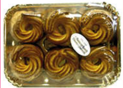
FRTB 6 ZEPPOLE SAN GIUSEPPE AL FORNO

DAL 1908 FABBRICHE RIUNITE TORRONI DI BENEVENTO