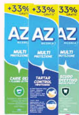
AZ DENTIFRICIO Protezione Carie Famiglia/Tartar Control 75 + 25 ml