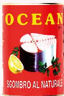
OCEAN SGOMBRO AL NATURALE 400 gr