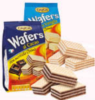
CRICH WAFERS Sacchetto Tutti i Tipi 250 gr