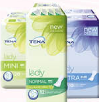
TENA LADY ASSORBENTI Tutti i Tipi