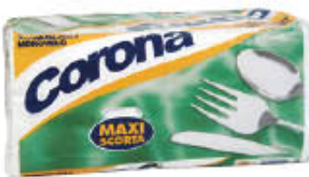
CORONA TOVAGLIOLI MONOVELO