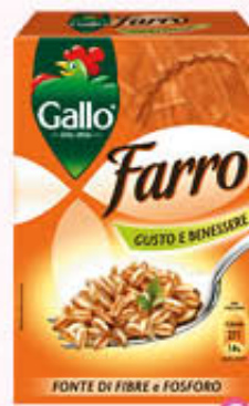
GALLO FARRO NORMALE 400 gr