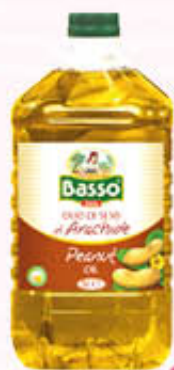
BASSO OLIO DI SEMI DI ARACHIDE Pet - 5 Litri