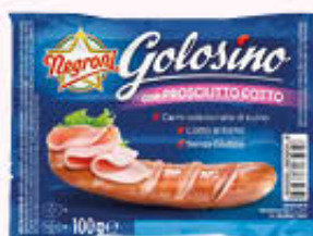
GOLOSINO WURSTEL 100 gr