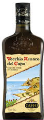
VECCHIO AMARO DEL CAPO 70 cl