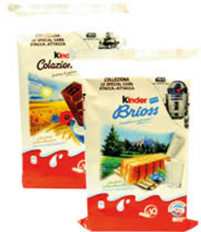
KINDER COLAZIONE BRIOSS x 10