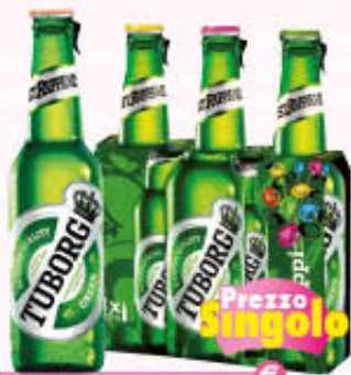
TUBORG BIRRA IN CLUSTER 33 cl