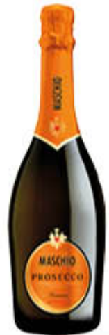
MASCHIO PROSECCO EXTRA DRY DOC TREVISO 75 cl