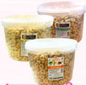
SAN TRIFONE SECCHIELLO TARALLI 3 Kg