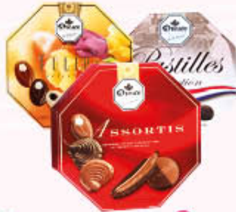
DROSTE CONFEZIONI CIOCCOLATINI 175/200 gr