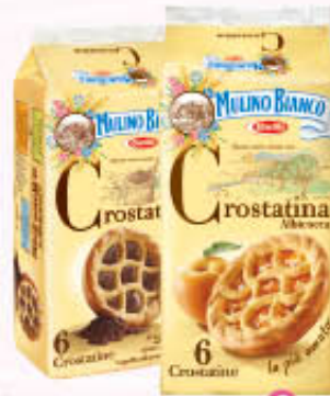
MULINO BIANCO CROSTATINA x 6