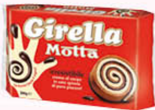
MOTTA GIRELLA FAMIGLIA 8 Pezzi