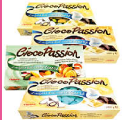
CRISPO CIOCCAPASSION GUSTI ASSORTITI BIANCHI/COLORATI Tutti i Tipi - 1 Kg