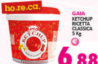
GAIA KETCHUP RICETTA CLASSICA 5 Kg