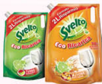
SVELTO ECORICARICA Limone/Aceto 2 Litri