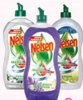
NELSEN PIATTI Tutti i Tipi 900/1000 ml