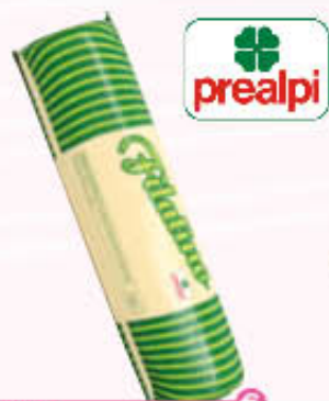
PREALPI FILATINO T.2 Al Kg