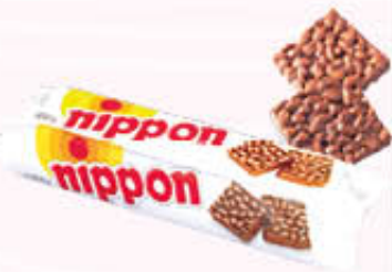
NIPPON 200 gr