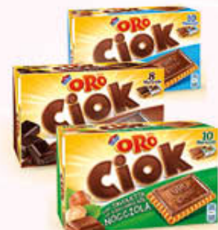
SAIWA BISCOTTI ORO CIOK Latte/Nocciola/Fondente 200/250 gr