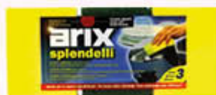
ARIX SPUGNE ABRASIVE GRANDI 3 Pezzi