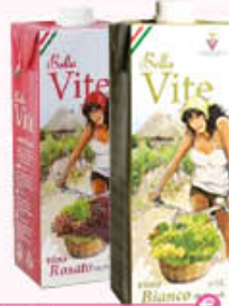
BELLAVITE VINO Bianco/Rosato Brik - 1 Litro