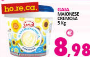
GAIA MAIONESE CREMOSA 5 Kg