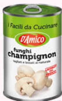
D'AMICO FUNGHI CHAMPIGNONS TAGLIATI AL NATURALE 400 gr