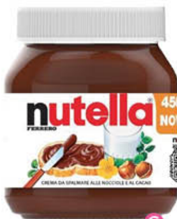
NUTELLA VASETTO 450 gr