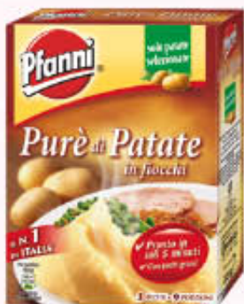
PFANNI PURE DI PATATE FIOCCHI 225 gr