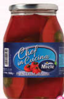
MIELE PAPACELLE ALL'ACETO 1.050 Kg