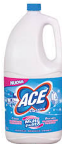
ACE CANDEGGINA CLASSICA 3 Litri