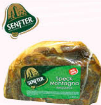
SENFTER SPECK 1/2 SV Al Kg