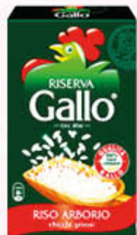
GALLO RISO ARBORIO 1 Kg