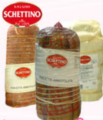
SCHETTINO PANCETTA ARROTOLATA DOLCE/PICCANTE E SCHIACCIATA Al Kg