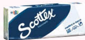
SCOTTEX FAZZOLETTI X 10