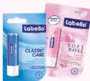
LABELLO LABBRA CLASSICO/ROSA