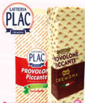
PLAC PROVOLONE TRANCIO Al Kg