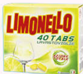
LIMONELLO LAVASTOVIGLIE AZIONE TOTALE 40 Tabs