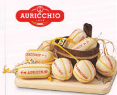
AURICCHIO PROVOLETTE GIOVANI Al Kg