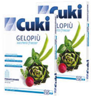
CUKI SACCHETTI GELO PIU' Tutte le Misure