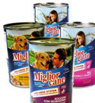
MIGLIOR GATTO/CANE BOCCONCINI Tutti i Tipi 405 gr