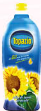
TOPAZIO OLIO DI SEMI DI GIRASOLE 1 Litro