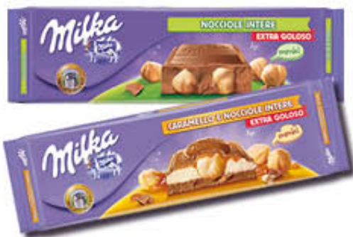
MILKA TAVOLETTA DI CIOCCOLATO Tutti i Tipi 250/300 gr