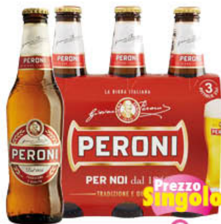
PERONI BIRRA VETRO 33 cl