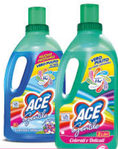
ACE GENTILE 2 Litri