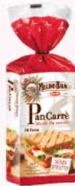
MULINO BIANCO PANCARRE 16 FETTE 285 gr