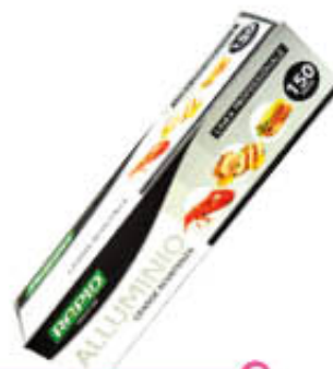
RAPID ALLUMINIO PROFESSIONALE 150 Metri