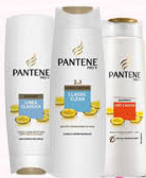
PANTENE SHAMPOO, BALSAMO, 2 IN 1 Tutti i Tipi 200/250 ml