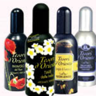
TESORI D'ORIENTE PROFUMI Tutti i Tipi 100 ml