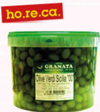
GRANATA OLIVE VERDI DI SICILIA SECCIO Al Kg