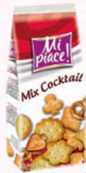
MI PIACE! MIX COCKTAIL 500 gr