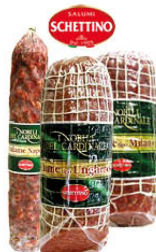
SCHETTINO SALAMI NAPOLI MILANO/UNGHERESE METÀ SV Al Kg