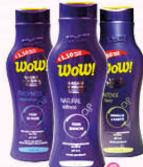
WOW BAGNOSCHIUMA Tutti i Tipi 750 ml