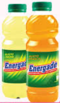
ENERGADE ARANCIA/LIMONE 50 cl