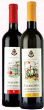
CANTINE DI SOLOPACA VINO IGP Aglianico/Falanghina 75 cl