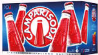
CAMPARI SODA Confezione - x 10