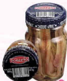
DONZELA FILETTI DI ACCIUGHE IN OLIO 80 gr