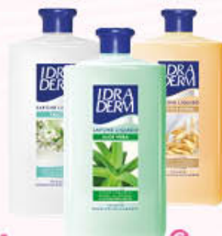
IDRADERM SAPONE LIQUIDO Tutti i Tipi Ricarica 1 Litro