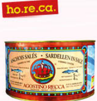
AGOSTINO RECCA ACCIUGHE SALATE T.5 Al Kg