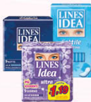
LINES IDEA ULTRA E SOTTILE Tutti i Tipi