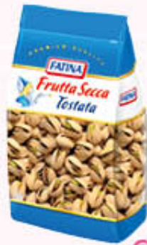
FATINA PISTACCHI TOSTATI SALATI 200 gr