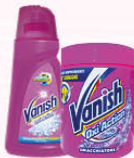
VANISH SMACCHIATORE GEL 900 ml e POLVERE 500 gr