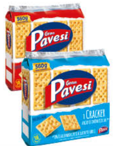
GRAN PAVESI CRACKERS Salati/Non Salati 560 gr