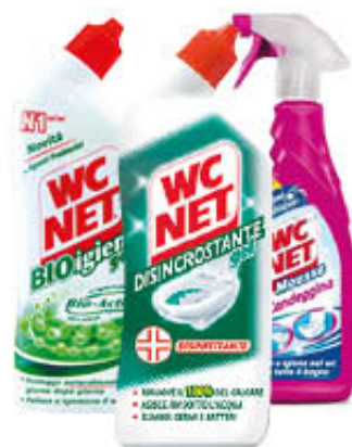
WC NET 700 ml e SPRAY 600 ml Tutti i Tipi