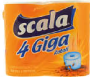
SCALA IGIENICA 4 GIGA ROTOLI