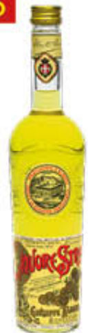
STREGA 1 Litro