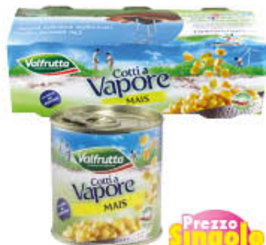
VALFRUTTA MAIS LATTINA 326 gr