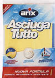
ARIX ASCIUGATUTTO 1 PEZZO 35 x 29