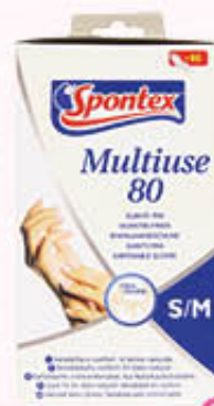
SPONTEX GUANTI LATTICE Tutte le Misure X 60