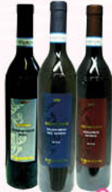
LA GUARDIENSE Aglianico/Falanghina DOP Coda di Volpe DOC 75 cl