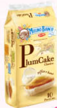
MULINO BIANCO PLUMCAKE x 10