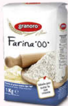
GRANORO FARINA TIPO 00 1 Kg