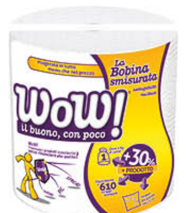
WOW ASCIUGATUTTO BOBINA SMISURATA