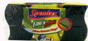
SPONTEX SPUGNA FIBRA PLUS 3 Pezzi