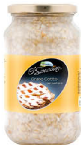
O'SARRACINO GRANO COTTO VETRO 580 gr