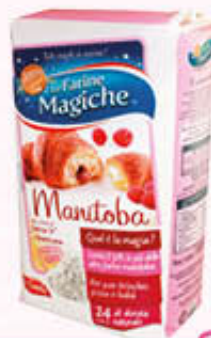
LO CONTE FARINA AMERICANA 1 Kg