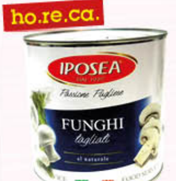
IPOSEA FUNGHI TAGLIATI AL NATURALE 2,4 Kg