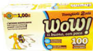
WOW TOVAGLIOLI 33 X 33 2 VELI X 100