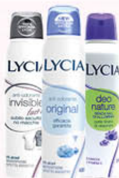
LYCIA SPRAY Tutti i Tipi 150 ml