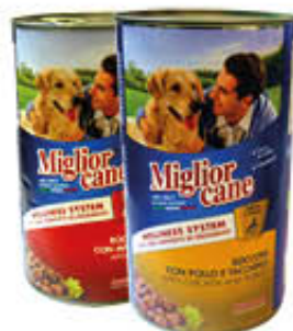
MIGLIOR CANE BOCCONCINI Tutti i Tipi 1,250 Kg