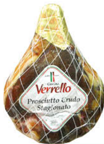
CASCINA VERRELLO PROSCIUTTO DISSOSSATO STAGIONATO Oltre 6 Kg - Al Kg