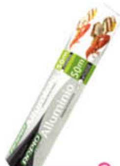
RAPID ALLUMINIO 50 Metri