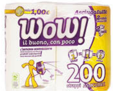
WOW DUETTO 200 STRAPPI 2 VELI 2 ROTOLI