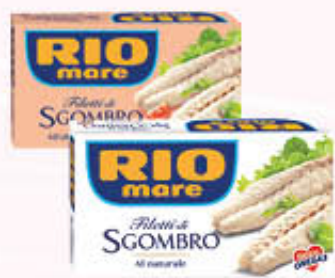
RIO MARE FILETTI DI SGOMBRO al Naturale in Olio di Oliva 125 gr