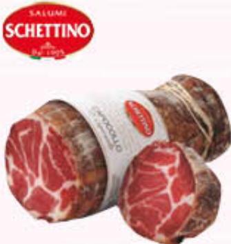
SCHETTINO CAPOCOLLO 1/2 SOTTOVUOTO Al Kg