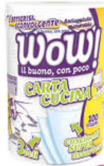
WOW BOBINA MONOROTOLO 100 STRAPPI