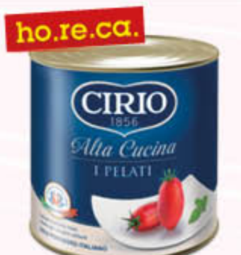
CIRIO PELATI ALTA CUCINA 2,5 Kg