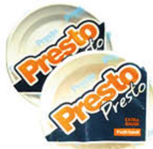
PRESTO PRESTO PIATTI EXTRARIGIDI 700 gr