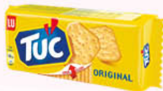
TUC SALATI ORIGINAL 100 gr