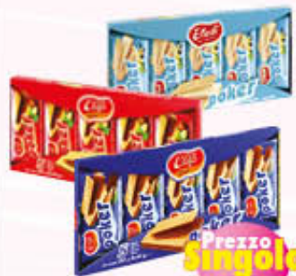
GASTONE LAGO POKER Tutti i Tipi 45 gr