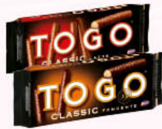
PAVESI TOGO Latte/Fondente 120 gr