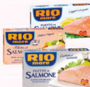
RIO MARE FILETTI DI SALMONE Tutti i Tipi 150 gr