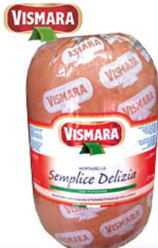
VISMARA MORTADELLA SEMPLICE DELIZIA Al Kg