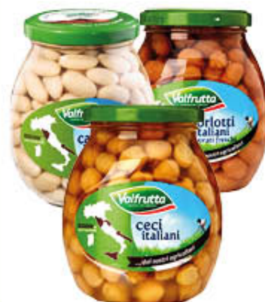
VALFRUTTA CANNELLINI CECI BORLOTTI VETRO 360 gr