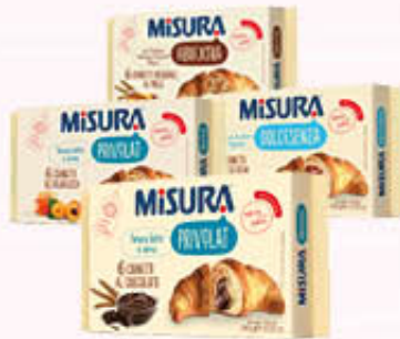
MISURA CORNETTI PRIVOLAT FIBREXTRA SENZA ZUCCHERO 290/300 gr