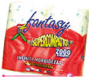
FANTASY SUPERCOMPATTO 4 ROTOLONI 2000 STRAPPI