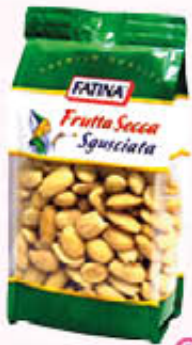
FATINA MANDORLE PELATE 200 gr