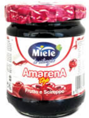
MIELE AMARENE ALLO SCIROPPO 260 gr