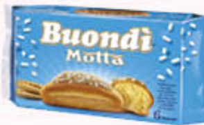
BUONDI MOTTA 6 PEZZI