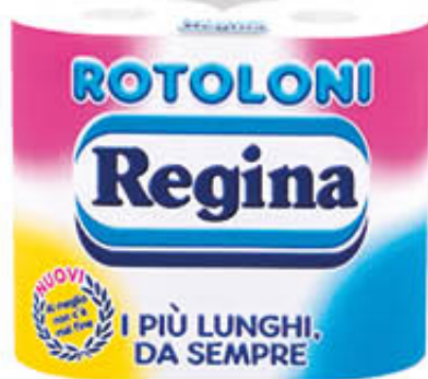
REGINA ROTOLONI CARTA IGIENICA X 4