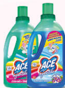
ACE GENTILE 2 Litri