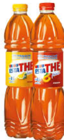
ESTATHE' LIMONE/PESCA 1,5 Litri