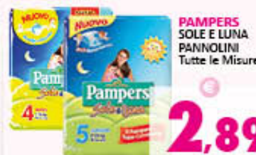
PAMPERS SOLE E LUNA PANNOLINI Tutte le Misure