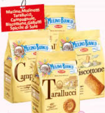
MULINO BIANCO BISCOTTI CLASSICI 700/800 gr