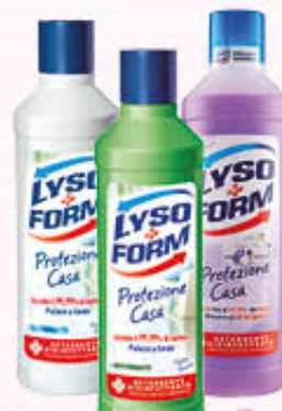
LYSOFORM CASA Tutti i Tipi 1 Litro