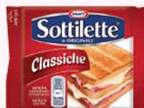
KRAFT SOTTILETTE 200 gr