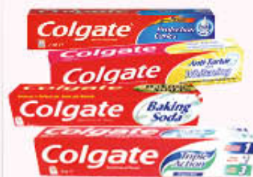
COLGATE DENTIFRICI Tutti i Tipi 75 ml