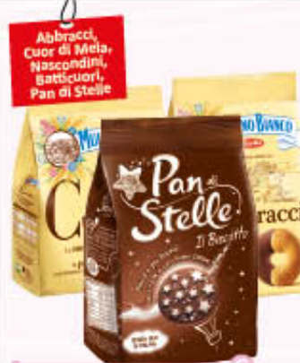
MULINO BIANCO BISCOTTI RICCHI 300/350 gr