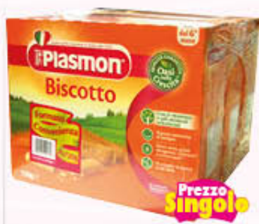
PLASMON BISCOTTI 720 gr