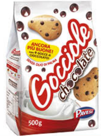
PAVESI GOCCIOLE CLASSICHE 500 gr