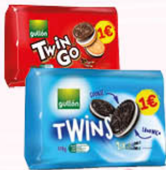
GULLON TWIN GO 290 gr TWINS 308 gr