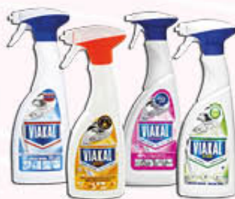
VIAKAL SPRAY Tutti i Tipi 500 ml