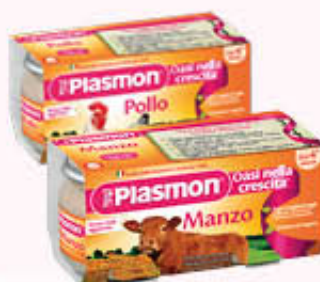
PLASMON OMOGENEIZZATI ALLA CARNE Tutti i Tipi 80 gr x 2