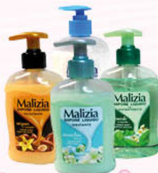
MALIZIA SAPONE LIQUIDO DISPENSER Tutti i Tipi 300 ml