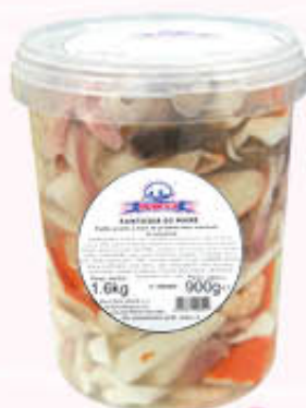
OROPECA FANTASIA DI MARE Sgocciolato 900 gr