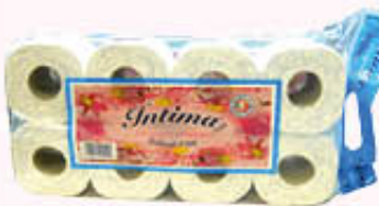
INTIMA CARTA IGIENICA ULTRAMORBIDA 8 ROTOLONI 3 VELI