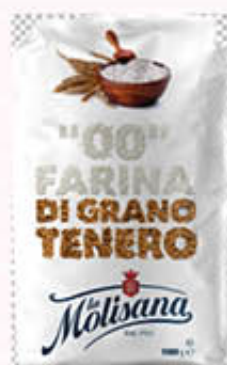
LA MOLISANA FARINA 00 1 Kg