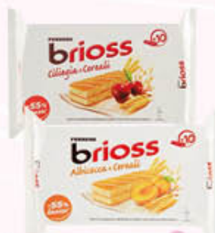
FERRERO BRIOSS Albicocca/Ciliegia x 10