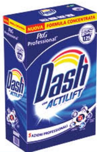
DASH PROFESSIONAL FUSTONE 125 MISURINI