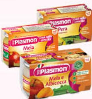
PLASMON OMOGENEIZZATI ALLA FRUTTA Tutti i Tipi 104 gr x 2