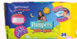
PAMPERS SALVIETTINE SOLE & LUNA X 54