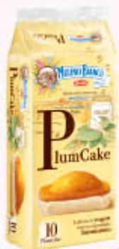
MULINO BIANCO PLUMCAKE x 10