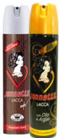
JANNETTIL LACCA Classica/Argan 300 ml