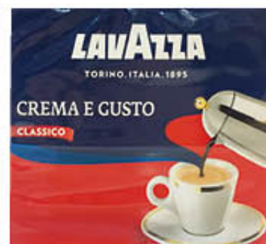
LAVAZZA CAFFÈ CREMA E GUSTO CLASSICO 250 gr x 2