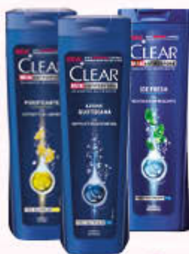
CLEAR SHAMPOO UOMO Tutti i Tipi 250 ml