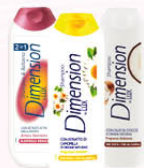
DIMENSION SHAMPOO E 2 IN 1 Tutti i tipi 250 ml