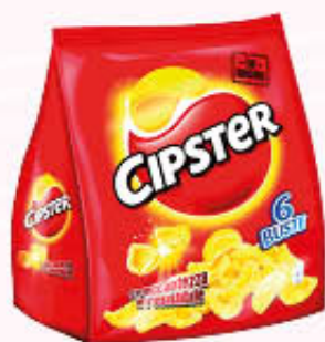
CIPSTER MULTIPACK 132 gr