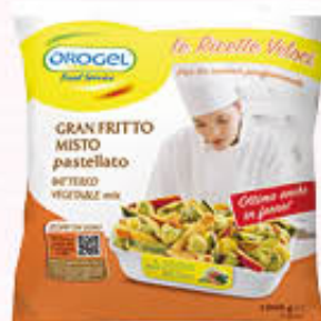
ORIGEL GRAN FRITTO MISTO PASTELLATO 1 Kg