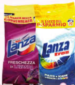
LANZA DETERGENTE TRES LAVATRICE 70 Misurini