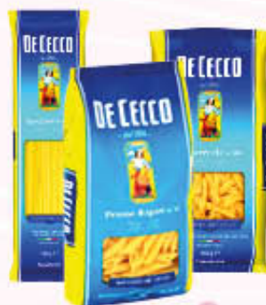
DE CECCO PASTA DI SEMOLA FORMATI NORMALI Tutti i Tipi 500 gr