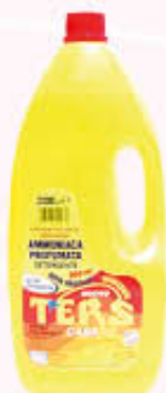
TERS AMMONIACA PROFUMATA 2 Litri