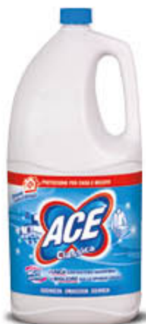
ACE CANDEGGINA 4 LITRI