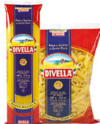
DIVELLA PASTA DI SEMOLA FORMATI NORMALI Tutti i Tipi 500 gr