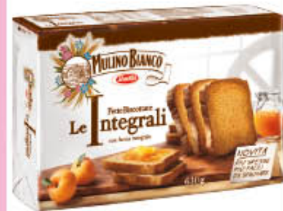
MULINO BIANCO FETTE BISCOTTATE LE INTEGRALI 630 gr