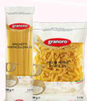
GRANORO PASTA DI SEMOLA FORMATI NORMALI Tutti i Tipi 500 gr