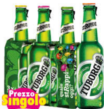
TUBORG BIRRA IN CLUSTER 33 cl