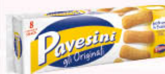
PAVESINI CLASSICI 200 gr