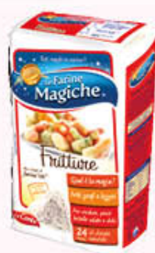
LO CONTE FARINE PER FRITTURA 750 gr