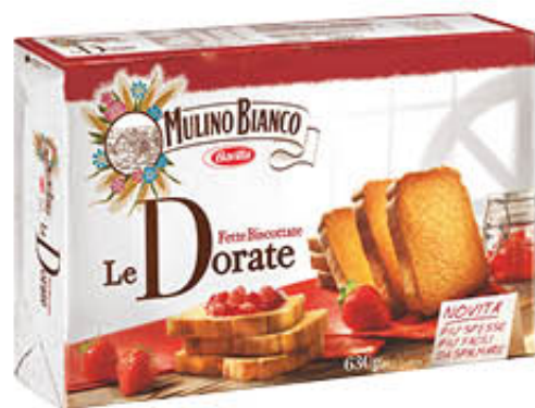
MULINO BIANCO FETTE BISCOTTATE LE DORATE 630 gr