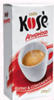
KOSE' CAFFÈ ROSSO ARMONIOSO 250 gr