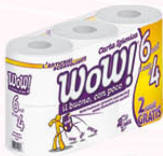
WOW CARTA IGIENICA 6 ROTOLONI 2 Veli