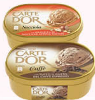
ALGIDA CARTE D'OR CLASSICHE Tutti i Tipi 530 gr