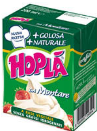
HOPLÀ PANNA PER DOLCI 200 ml