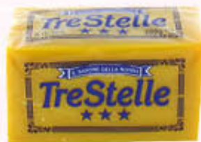
TRESTELLE SAPONE BUCATO 700 gr