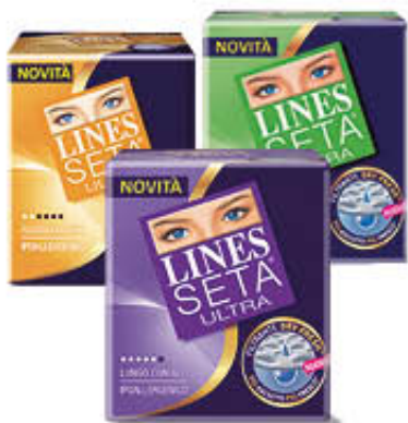
LINES SETA ULTRA TUTTI I TIPI