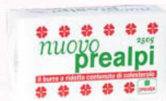
PREALPI BURRO Panetto 250 gr