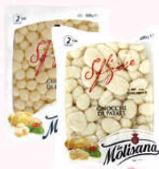
LA MOLISANA PASTA DI PATATE GNOCCHI/CHICCHE 500 gr