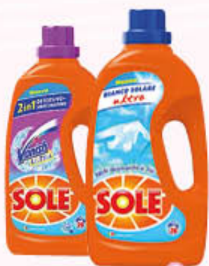
SOLE LAVATRICE 20 Lavaggi Tutti i Tipi