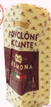
PLAC PROVOLONE TRANCIO Al Kg