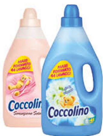
COCCOLINO AMMORBIDENTE TUTTI I TIPI 4 LITRI