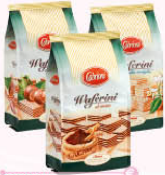
CABRIONI WAFERS Nocciola/Cacao Vaniglia Sacchetto - 400 gr