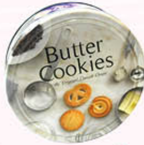
BUTTER COOKIES BISCOTTI Latta - 454 gr