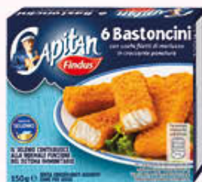
FINDUS BASTONCINI DI MERLUZZO x 6 - 150 gr