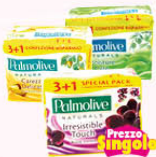
PALMOLIVE SAPONETTA NATURALS Tutti i Tipi 90 gr