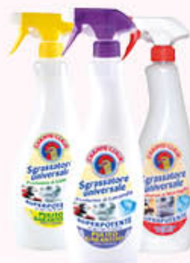
CHANTE CLAIR SGRASSATORE Lavanda/Limone Marsiglia 625 ml