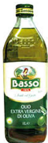
BASSO OLIO EXTRAVERGINE DI OLIVA 1 LITRO