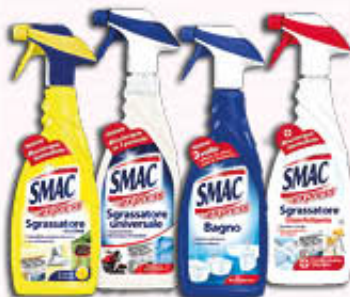
SMAC SPRAY Tutti i Tipi 650 ml