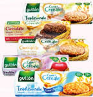
GULLON BISCOTTI CUOR DI CEREALE 280/308 gr