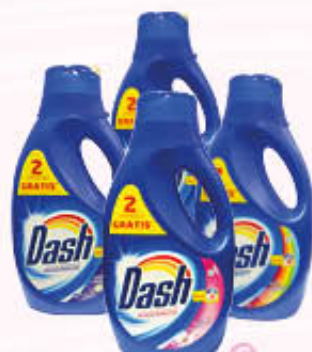
DASH LIQUIDO Tutti i Tipi 16 + 2 Lavaggi