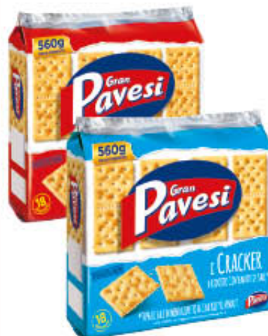
GRAN PAVESI CRACKERS Salati/Non Salati 560 gr