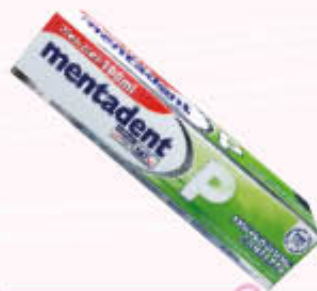
MENTADENT P DENTIFRICIO 100 ml