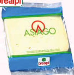
PREALPI ASIAGO PORZIONATO L'etto