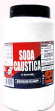
SODA CAUSTICA SCAGLIE BARATTOLO 1 Kg