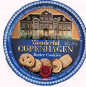
WONDERFUL COPENHAGEN BISCOTTI DANESI 340 gr