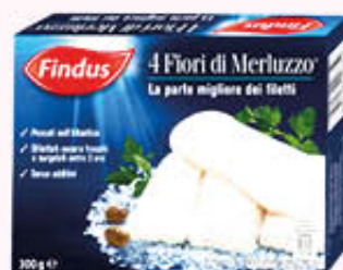
FINDUS FIOR DI MERLUZZO 300 gr