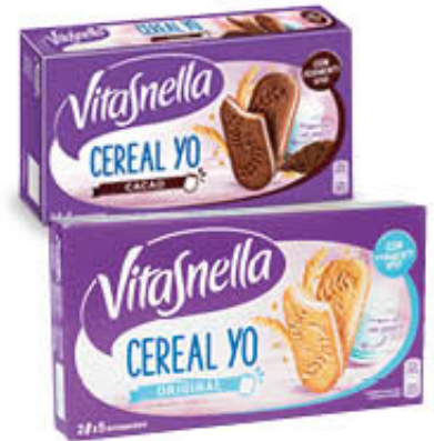
VITASNELLA CEREAL YO TUTTI I TIPI 253 gr