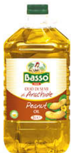
BASSO OLIO DI SEMI DI ARACHIDE Pet - 5 Litri