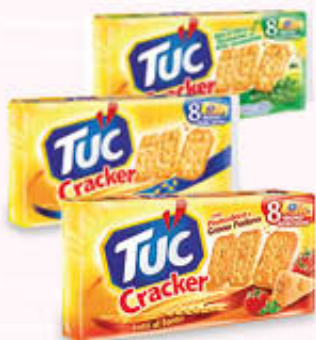
TUC CRACKER Classici/Rosmarino Pomodoro e Grana 250 gr