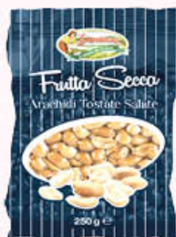
LA MONTANARA ARACHIDI TOSTATE SALATE 250 gr