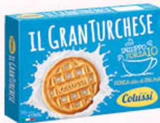
COLUSSI GRAN TURCHESE 800 gr