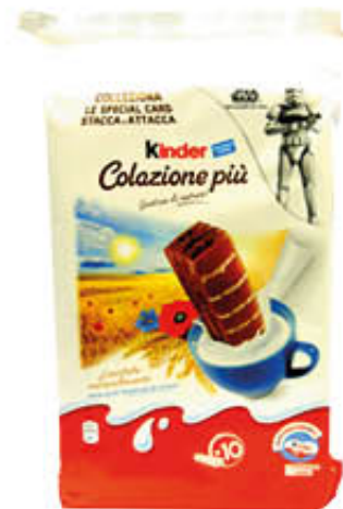
KINDER COLAZIONE PIÙ 10 Pezzi