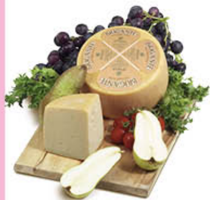
BRIGANTE FORMAGGIO SARDO AL KG