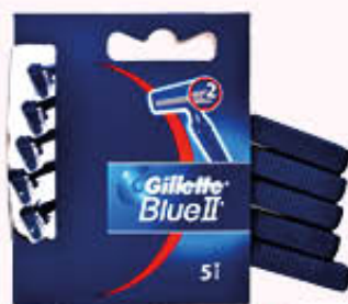
GILLETTE RADI E GETTA BILAMA X 5