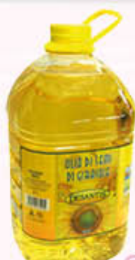
DESANTIS OLIO DI SEMI DI GIRASOLE Pet - 5 Litri