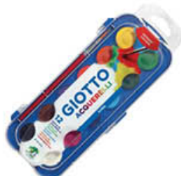
GIOTTO ACQUERELLI 12 PZ