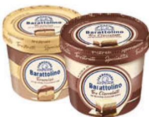
SAMMONTANA BARATTOLINO SPECIALITA' 410 GR