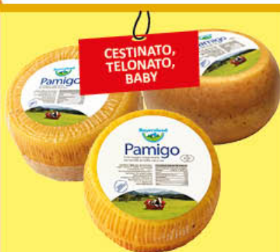
5,99 PAMIGO BAYERNLAND SV AL KG