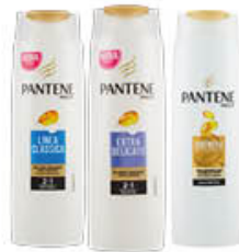
PANTENE SHAMPOO/ BALSAMO 2 in 1 Tutti i Tipi 250 ml