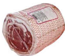
PRAZZOLI PANCETTA ARROTOLATA 1/2 SV AL KG 6,99