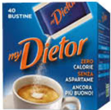
DIETOR 40 BUSTE