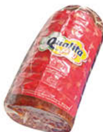
QUALITÀ PIÙ VENTRICINA DOLCE/PICCANTE 1/2 SV AL KG 5,19