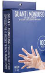
GUANTI MONOUSO POLIETILENE X 100 TAGLIA L/M/S