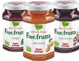
RIGONI CONFETTURE VARI TIPI 250 GR