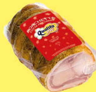
4,99 QUALITÀ PIÙ PORCHETTA 1/2 SV AL KG