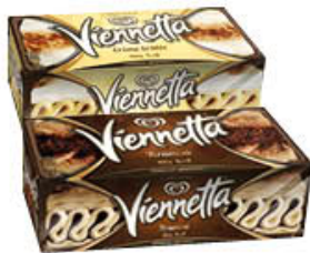
VIENNETTA SELECTION 400 GR