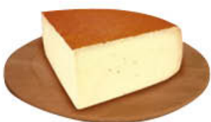
FONTAL FORMAGGIO 1/4 SV AL KG 3,99