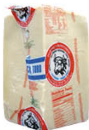
PINNA PECORINO ROMANO TORO 1/4 SV AL KG 9,99