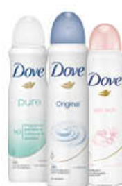
DOVE DEODORANTE SPRAY TUTTI I TIPI 150 ML