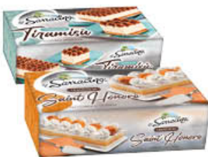
'O SARRACINO TRANCIO MIMOSA/ SAINT HONORÈ/ TIRAMISÙ 500 GR