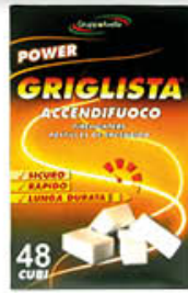
IL GRIGLISTA ACCENDIFUOCO X 48