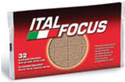
ITALFOCUS ACCENDIFUOCO ECOLOGICO X 32