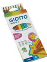
GIOTTO MEGA ASTUCCIO 8 PZ