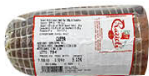
PRAZZOLI COPPA 1/2 SV AL KG 7,49