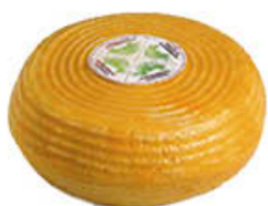
BAYERNLAND FORMAGGIO RIGATINO SV AL KG 5,89