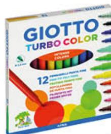
GIOTTO PENNARELLI TURBO COLOR 12 PEZZI