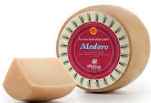
PINNA PECORINO SARDO MATURO MEDORO AL KG 10,79