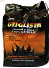
PAULISTA CARBONE DI LEGNA 2,5 KG