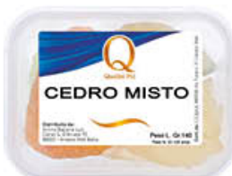
QUALITA' PIU' CEDRO MISTO 140 GR