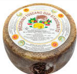
MATTEASSI PECORINO TOSCANO DOP AL KG 10,99