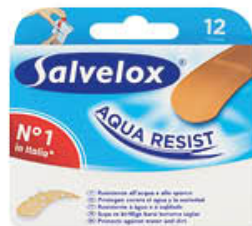
SALVELOX CEROTTI AQUA RESISTENTI MEDIO X 12