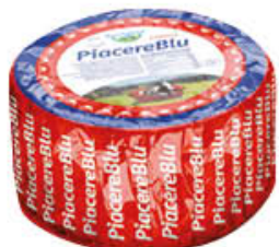
BAYERNLAND EDELPI LZ ALPEN-BLU AL KG 6,49