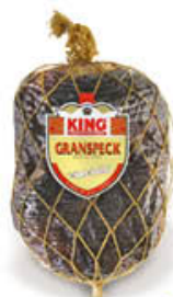
KING'S GRANSPECK AL KG 9,49