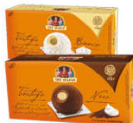
TRE MARIE DESSERT TARTUFO BIANCO/NERO