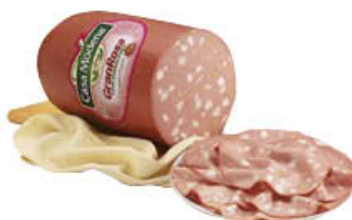
CASA MODENA MORTADELLA GRAN ROSA 1/2 AL KG 3,89