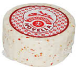
AURICCHIO CACIOTTA NOVELLA AL PEPERONCINO T2 CRY AL KG 8,19