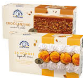
SAMMONTANA TRANCIO ST.HONORE/ CROCCANTINO 500 GR