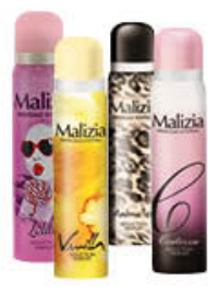
MALIZIA DEODORANTI DONNA TUTTI I TIPI 100 ML