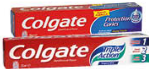
COLGATE DENTIFRICI TUTTI I TIPI 75 ML