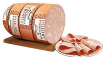
FIORUCCI MORTADELLA AROMA CON PISTACCHI AL KG 3,09