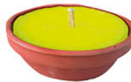
CANDELA CITRONELLA TERRACOTTA D10