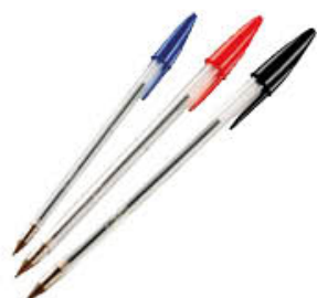
BIC PENNA CRISTAL SFERA NERA-BLU-ROSSA