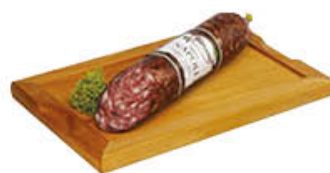
FIORUCCI SALAME NAPOLI T2 SV AL KG 6,99