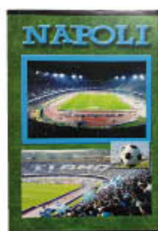
QUADERNI MAXI NAPOLI 4EVER