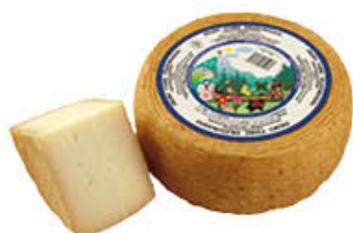
GRIFO PECORINO PRATOMAGNO AL KG 9,29