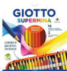
GIOTTO SUPERMINA ASTUCCIO X 18