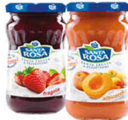
SANTA ROSA CONFETTURE CLASSICHE 350 GR