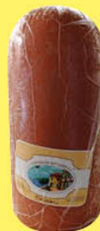
2,29 CORTE DI RIVABELLA MORTADELLA AL KG