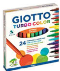
GIOTTO PENNARELLI TURBO COLOR 24 PEZZI