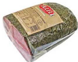
COLIELL SALAME ALLE ERBE TUNNEL AL KG 4,79