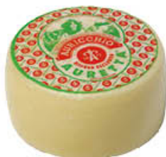
AURICCHIO AURETTA CRY T2 AL KG 6,99