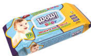
WOW SALVIETTE BIMBI POP-UP X 72