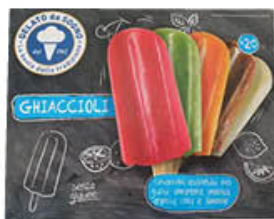
GELATO DA SOGNO GHIACCIOLI X 10 750 GR