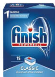
FINISH TABS POWERBALL X 15