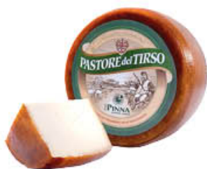
PINNA FORMAGGIO PASTORE DEL TIRSO AL KG 9,29