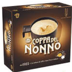
MOTTA COPPA DEL NONNO X 4