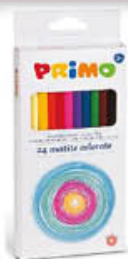
PRIMO PASTELLI 24 PZ