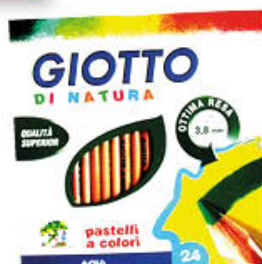
GIOTTO PASTELLI NATURA 24 PEZZI