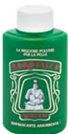
ROBERTS BOROTALCO BARATTOLO 200 GR