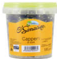
O' SARRACINO CAPPERI AL SALE N9/10 100 GR