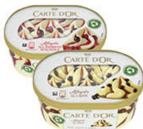
CARTE D'OR AFFOGATI TUTTI I TIPI 500 GR