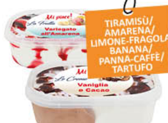
MI PIACE VASCHETTA GELATO 1 KG