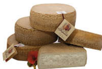
L'ANTICA CASCINA FORMAGGIO SCOPAROLO AL KG 12,29