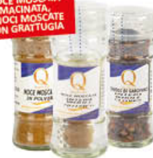
QUALITA' PIU' SPEZIE ASSORTITE

CHIODI GAROFANO, NOCE MOSCATA MACINATA, 2 NOCI MOSCATE CON GRATUGIA