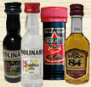
BORGHETTI CAFFÈ/MOLINARI CLASSICO CAFFÈ/BRANDY STOCK 84 MIGNON