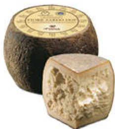
PINNA FIORE SARDO DOP AL KG 13,49