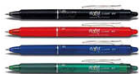
FRIXION PENNA SCATTO BLU/NERA/ROSSA/ VERDE