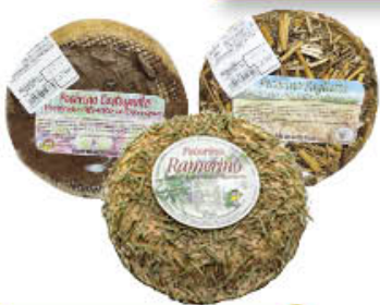
MATTEASSI PECORINO CASTAGNOLO/ PAGLIA/ ROSMARINO AL KG 12,99