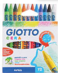
GIOTTO PASTELLI A CERA X 12