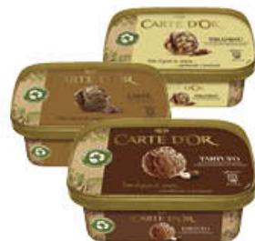
CARTE D'OR VASCHETTE 400 GR