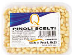
QUALITA' PIU' PINOLI T25 VASCHETTA 13 GR