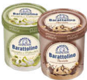
SAMMONTANA BARATTOLINO LE DELIZIE 500 GR