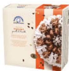
SAMMONTANA TORTA REGINA 1 KG