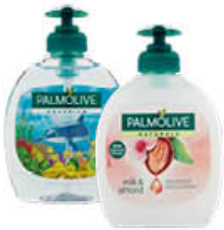
PALMOLIVE SAPONE LIQUIDO TUTTI I TIPI 300 ML