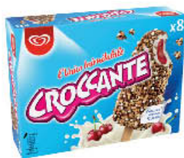
ALGIDA CROCCANTE AMARENA 8 PEZZI 464 GR