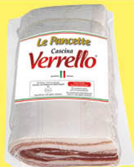
7,99 CASCINA VERRELLO PANCETTA SCHIACCIATA 1/2 SV AL KG