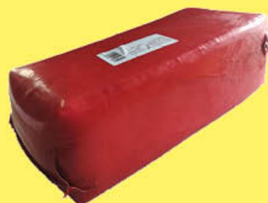
7,29 ADAMINO FORMAGGIO 2,5 KG