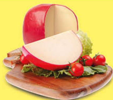
6,19 EDAM BOCCE OLANDESI AL KG