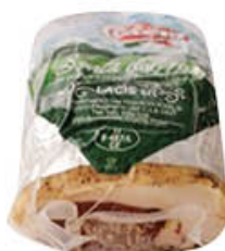
LACIS CUOR DI FILETTO 1/2 SV AL KG 8,49