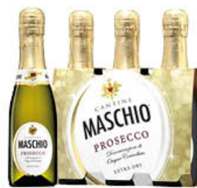
MASCHIO PROSECCINO 20 CL X 3