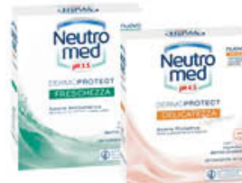
NEUTROMED INTIMO TUTTI I TIPI 200 ML