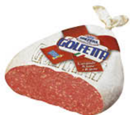
GOLFERA SALAME GOLFETTA SV AL KG 11,69