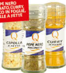
QUALITA' PIU' SPEZIE ASSORTITE

PEPE NERO MACINATO, CURRY, BASILICO IN FOGLIE, CIPOLLE A FETTE