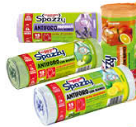
SPAZZY ANTIFORO PROFUMATI 15 SACCHI DA 28 LITRI TUTTI I TIPI