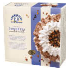
SAMMONTANA TORTA DUCHESSA 750 GR