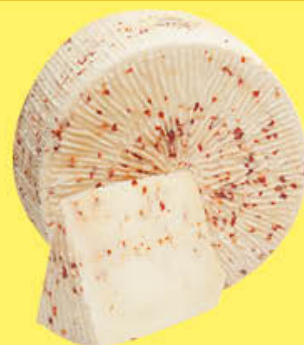
6,69 PRIMOSALE AL KG