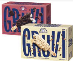
SAMMONTANA STECCO GRUVI STRACCIATELLA/ CAFFÈ/PISTACCHIO