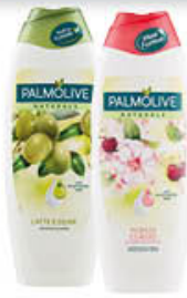
PALMOLIVE BAGNO 750 ML