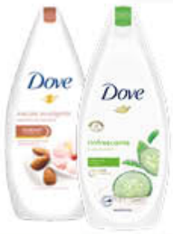
DOVE BAGNOSCHIUMA 500 ML