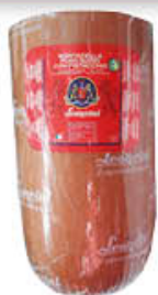
LEONCINI MORTADELLA INTERA E META AL KG 3,79