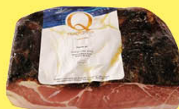
5,19 QUALITÀ PIÙ SPECK SELEZIONE ORO 1/2 SV AL KG