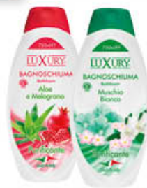
LUXURY BAGNOSCHIUMA VARIE PROFUMAZIONI 750 ML