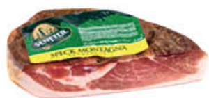
SENFTER SPECK 1/2 SV AL KG PREZZO SPECIALE