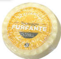
SICILFORMAGGI FURFANTE AL KG 7,49