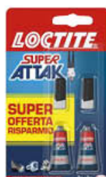
LOCTITE SUPER ATTAK 2+2 GR