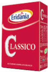
ERIDANIA ZUCCHERO CLASSICO ASTUCCIO 1 KG