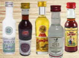
STREGA SAMBUCA/ STREGA AMARO/ STREGA MIGNON/ LA S'ORRENTE ANICE REALE/ AMARO LUCANO 50 CC