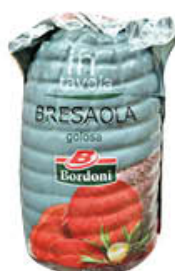
BORDONI BRESAOLA IN TAVOLA 1/2SV AL KG 17,90