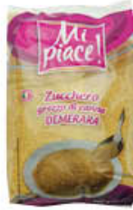
MI PIACE ZUCCHERO CANNA 500 GR