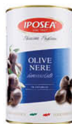
IPOSEA OLIVE NERE DENOCCIOLATE 4,3 KG