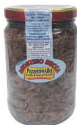
AGOSTINO RECCA FILETTI ALICI SPEZZATE 1,7 KG