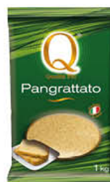
QUALITA' PIU' PANGRATTATO 1 KG