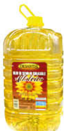
DESANTIS OLIO GIRASOLE ALTO OLEICO 10 LITRI