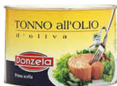
DONZELA TONNO IN OLIO DI OLIVA 1,73 KG