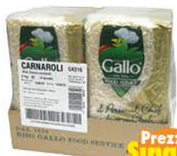
Prezzo Singolo € GALLO RISO PER RISTORAZIONE CARNAROLI 1 KG