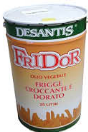
DESANTIS FRIDOR OLIO VEGETALE 25 LITRI