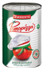
LA TORRENTE POMOPIZZA 5 KG