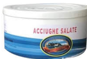
MONTAMARE ACCIUGHE SALATE 850 GR