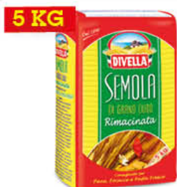
DIVELLA SEMOLA RIMACINATA 5 KG