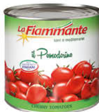
LA FIAMMANTE POMODORINI 2500 GR