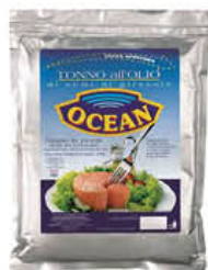
OCEAN TONNO OLIO DI GIRASOLE BUSTA 1 KG