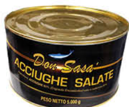
DON SASA ACCIUGHE SALATE 5 KG 16 PESCI