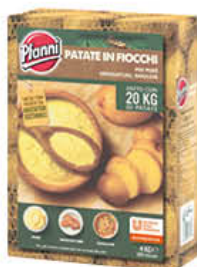
PFANNI PURE 4 KG