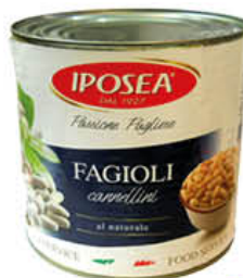
IPOSEA FAGIOLI CANNELLINI 2,55 KG