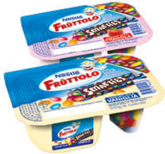
FRUTTOLO YOGURT & SMARTIES 120 GR