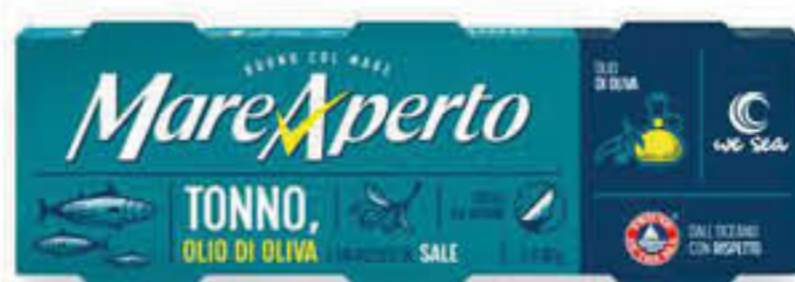
MAREAPERTO TONNO ALL'OLIO DI OLIVA 80 GR X 3