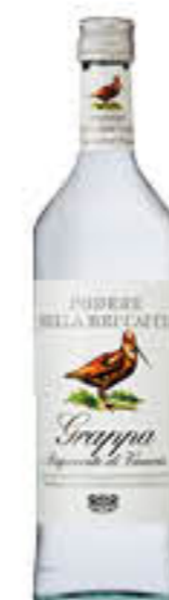
PODERE DELLA BECCACCIA GRAPPA 1 LITRO