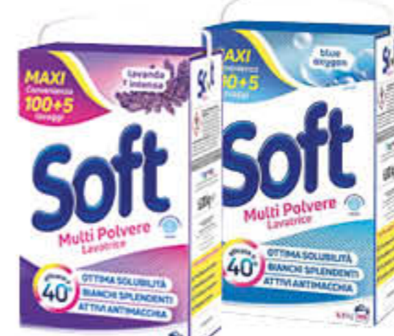
SOFT LAVANDA/ BLU OXYGEN FUSTONE 105 MISURINI