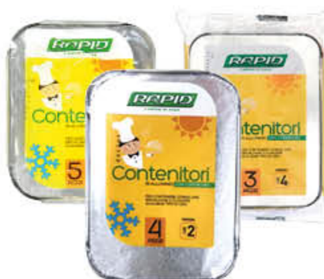
RAPID CONTENITORI ALLUMINIO CON COPERCHIO 4 PEZZI 2 PORZIONI 5 PEZZI 1 PORZIONE