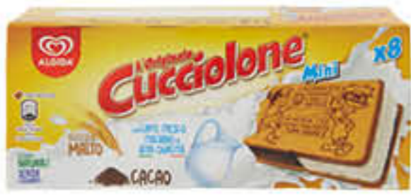
ALGIDA CUCCIOLONE MINI X 8