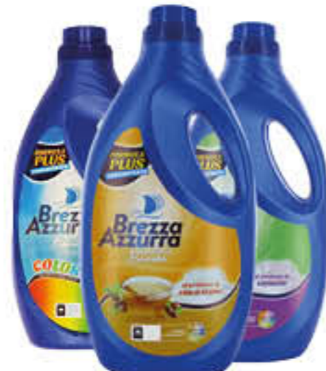
BREZZA AZZURRA LAVATRICE 26/30 LAVAGGI