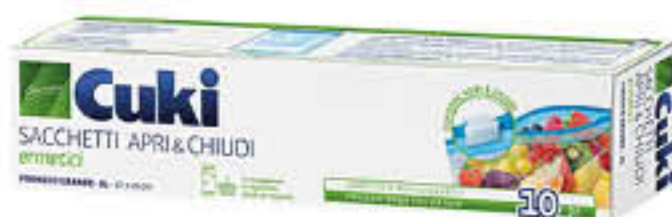
CUKI SACCHETTI ERMETICI APRI/CHIUDI 3 LITRI X 10