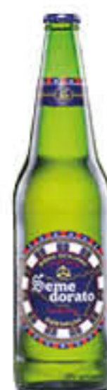
SEMEDORATO BIRRA PREMIUM 66 CL