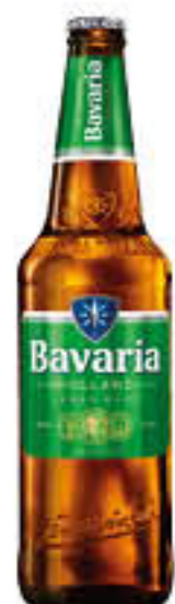
BAVARIA LAGER BIRRA 66 CL