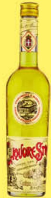
STREGA 1 LITRO