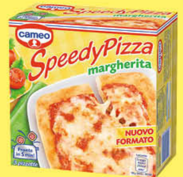
CAMEO SPEEDYPIZZA MARGHERITA X 3 225 GR