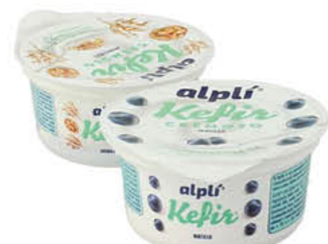
ALPLI KEFIR CREMOSO FRAGOLA/MIRTILLI/ AVENA E NOCI/MELA/ BIANCO - 150 GR