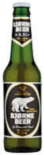
BJORNE BIRRA 33 CL