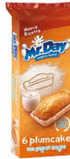
MR DAY PLUMCAKE CLASSICO 6 PEZZI