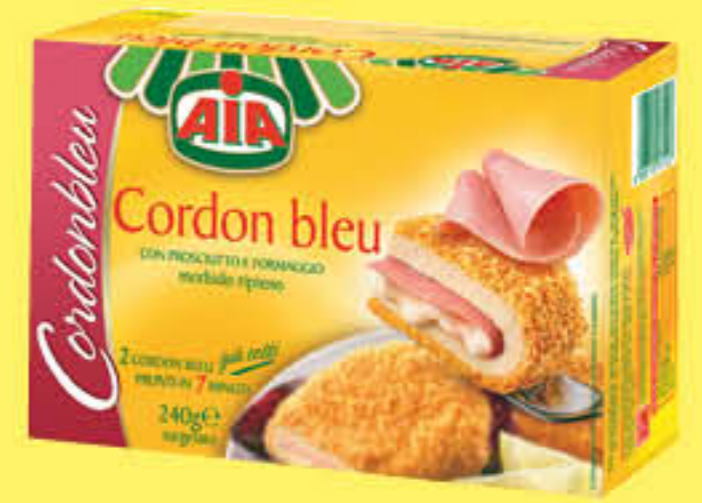
AIA CORDON BLEU 240 GR