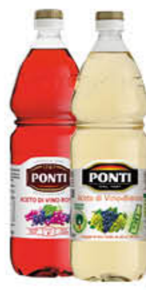
PONTI ACETO DI VINO BIANCO/ROSSO PET - 1 LITRO