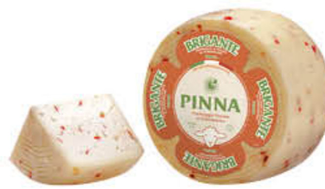
PINNA FORMAGGIO BRIGANTE AL PEPERONCINO AL KG