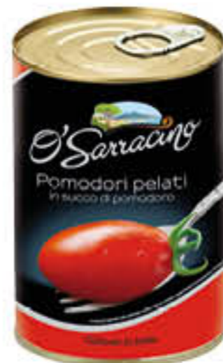
O' SARRACINO POMODORI PELATI 400 GR