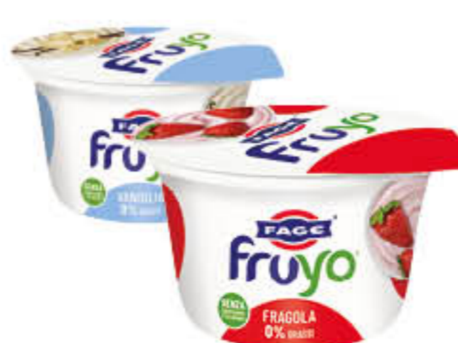
FAGE YOGURT FRUYO 0% FRUTTA VARI GUSTI 150 GR