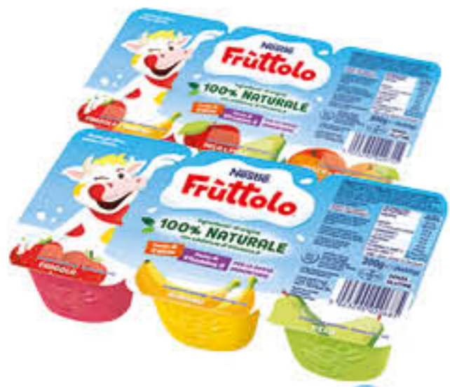
NESTLÉ FRUTTOLO VARI GUSTI 300 GR