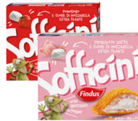
FINDUS 4 SOFFICINI RIPIENI 266 GR