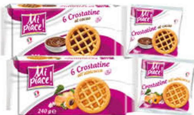
MI PIACE CROSTATINE X 6