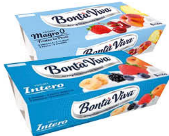
BONTÀ VIVA YOGURT MAGRO/INTERO 125 GR X 8