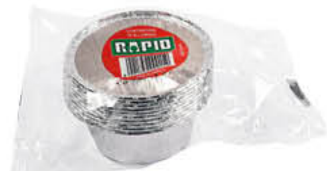
RAPID CONTENITORE ALLUMINIO CREM CAMEL 10 PEZZI

€ 0,75 CUKI SACCHETTI GELOPIÙ TUTTE LE MISURE