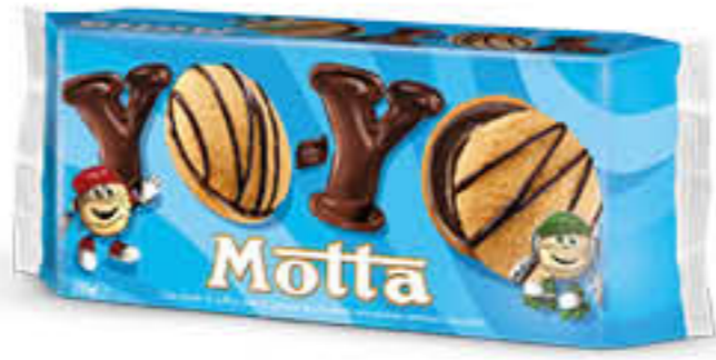
MOTTA YO-YO X 6