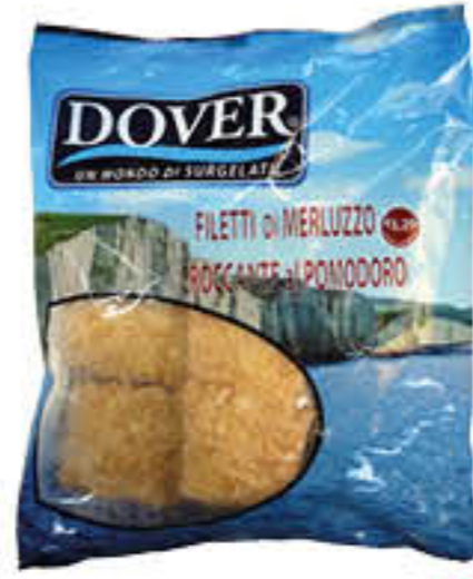
DOVER FILETTI DI MERLUZZO CROCCANTE POMODORO 400 GR