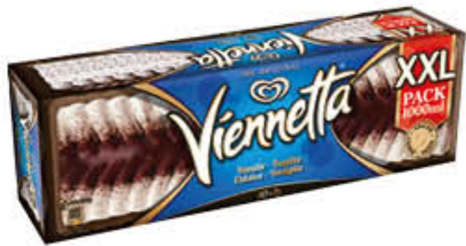
VIENNETTA VANIGLIA XXL 500 GR