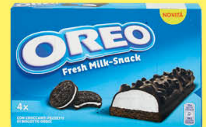
OREO SNACK FRESH-MILK 30 GR X 4