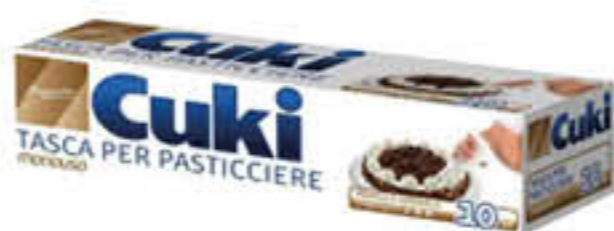
CUKI TASCA PER PASTICCIERE X 10