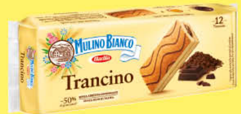
MULINO BIANCO TRANCINO CACAO X 12