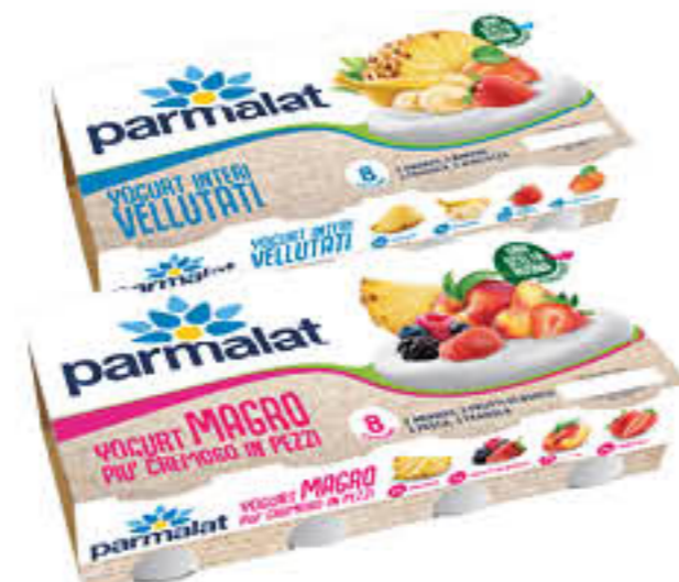
PARMALAT YOGURT FRUTTA 125 GR X 8