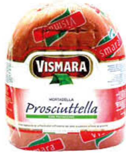
VISMARA MORTADELLA PROSCIUTTELLA 1/2 SV AL KG