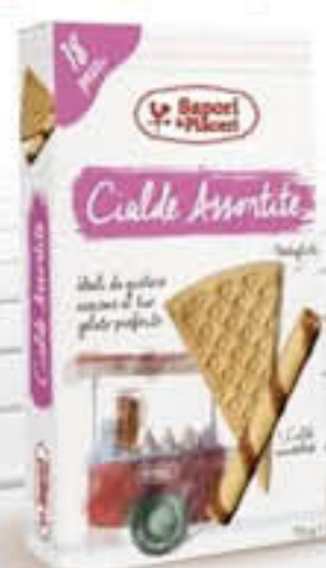
SAPORI&PIACERI CIALDE GELATO ASSORTITE 70 GR