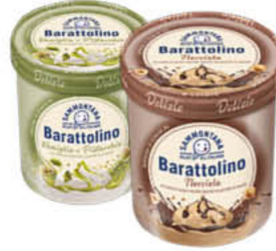
SAMMONTANA BARATTOLINO LE DELIZIE 500 GR