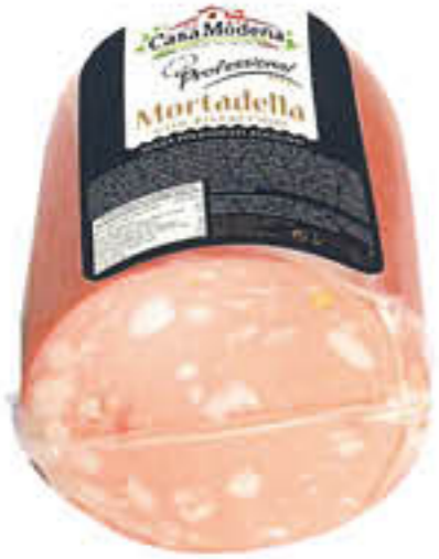
CASAMODENA MORTADELLA CON PISTACCHIO T3 AL KG