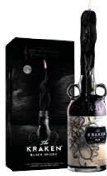
KRAKEN RUM NERO 70 CL