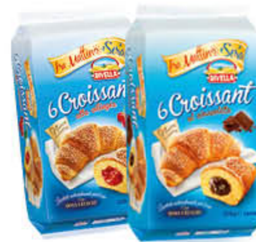
DIVELLA CROISSANT VARI TIPI 35/40/45 GR X 6