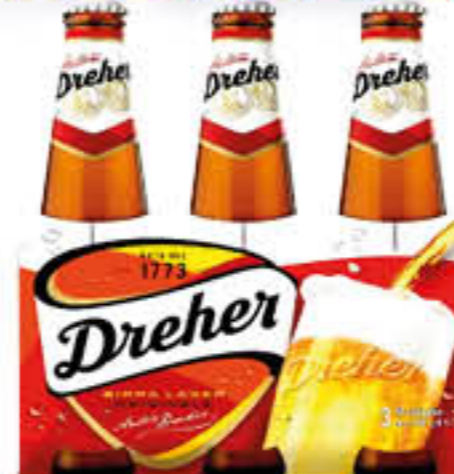
DREHER BIRRA 33 CL X 3