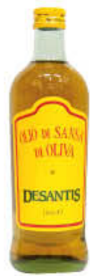
DESANTIS OLIO DI SANSÀ DI OLIVA 1 LITRO