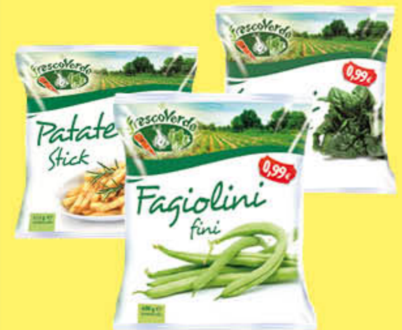
FRESCOVERDE PATATE/PISELLI SPINACI/FAGIOLINI MINISTRONE 600 GR