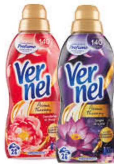
VERNEL CONCENTRATO 750 ML