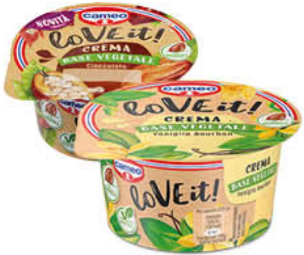
CAMEO LOVEIT! VANIGLIA/CIOCOLATO 125 GR