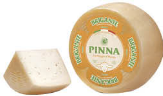
PINNA FORMAGGIO BRIGANTE SARDO AL KG