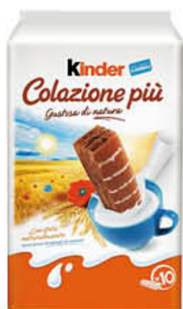
KINDER COLAZIONE PIÙ 10 PEZZI