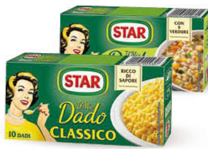
STAR DADO CLASSICO/VEGETALE X 10