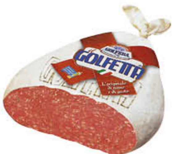
GOLFERA SALAME GOLFETTA SV AL KG