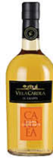
VILLA CARDEA GRAPPA BARRIQUE 70 CL