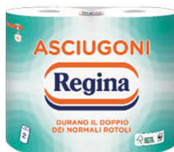
REGINA ASCIUGONI 2 ROTOLI