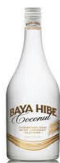
RUM BAYA HIBE COCONUT 20° 1 LITRO