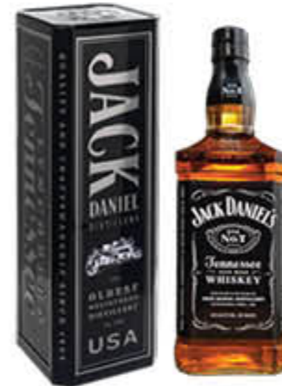
JACK DANIEL'S WHISKY 70 CL