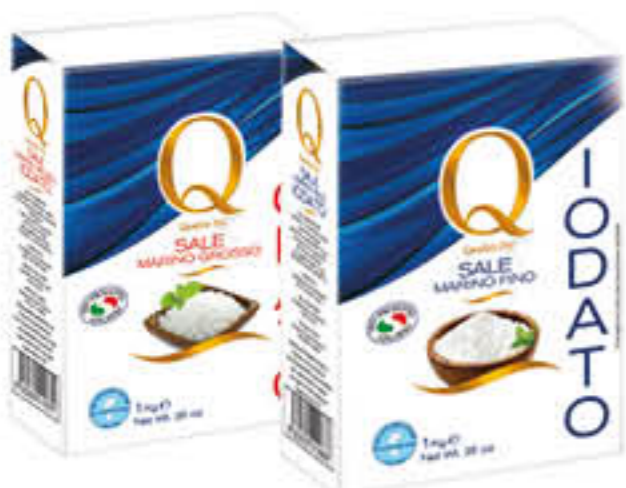
QUALITA' PIU' SALE IODATO FINO/GROSSO 1 KG