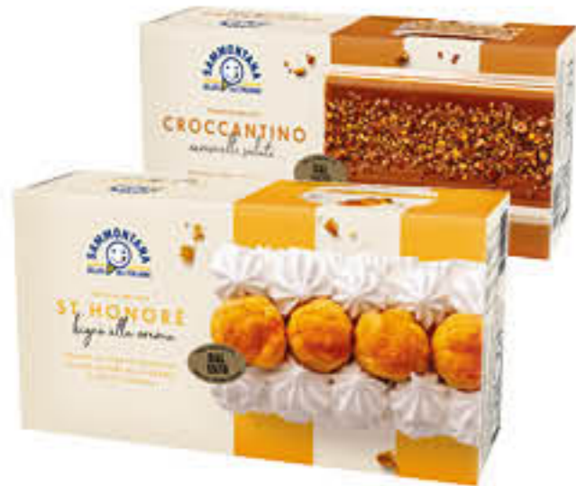
SAMMONTANA TRANCIO ST.HONORE/ CROCCANTINO 500 GR