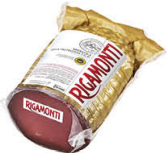
RIGAMONTI BRESAOLA ORO IGP 1/2 SV AL KG