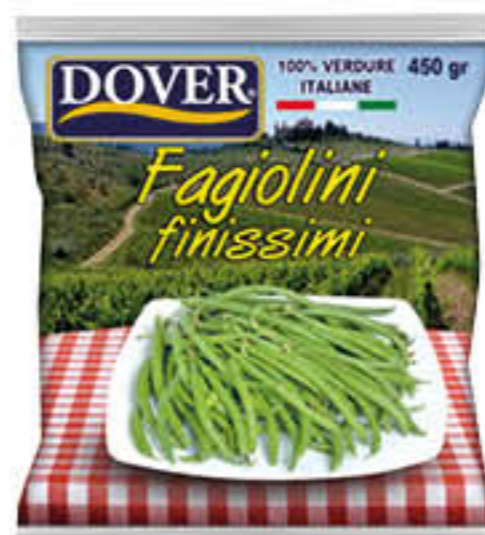
DOVER FAGIOLINI FINISSIMI 450 GR