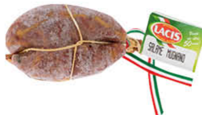
LACIS SALAME MUGNANO DEL CARDINALE SV AL KG