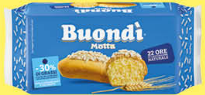
MOTTA BUONDI CLASSICO 6 PEZZI