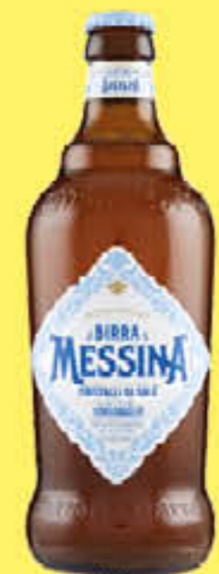
MESSINA BIRRA CRISTALLI DI SALE 50 CL