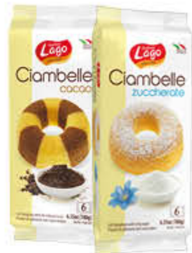
LAGO CIAMBELLA ZUCCHERATA/ CACAO 6 PEZZI