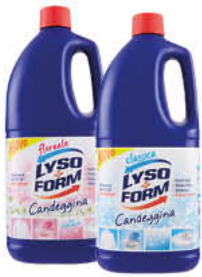
LYSOFORM CANDEGGINA 2,5 LITRI