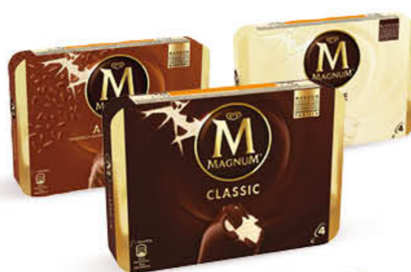
ALGIDA MAGNUM CLASSICO/BIANCO/ MANDORLE X 4