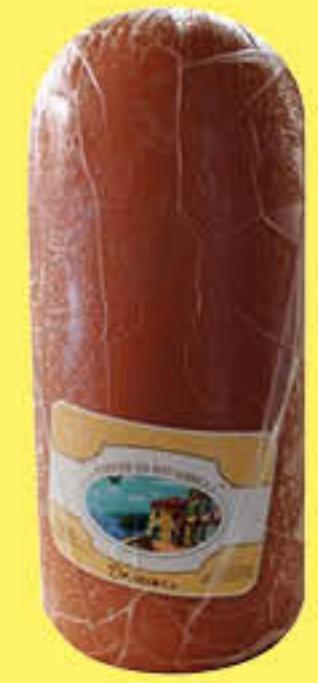
CORTE DI RIVABELLA MORTADELLA AL KG