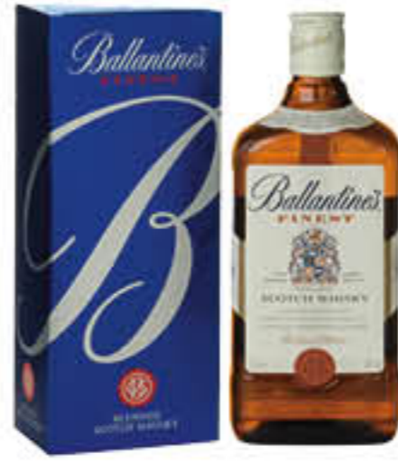
BALLANTINE'S WHISKY 70 CL