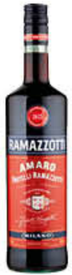
RAMAZZOTTI 1 LITRO