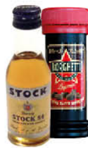
STOCK 84/ BORGHETTI/ MIGNON