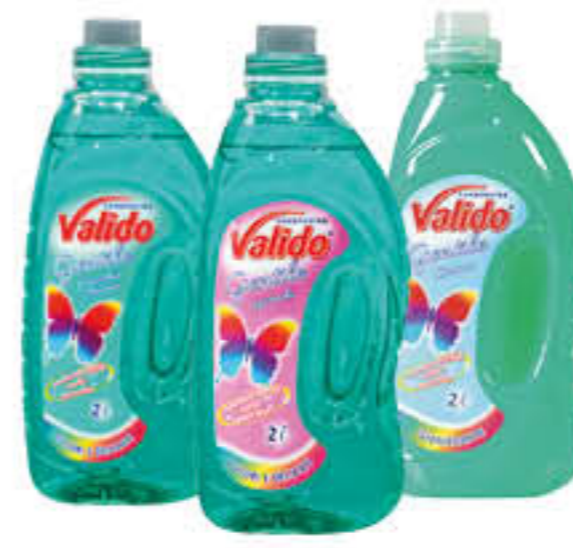
VALIDO CANDEGGINA LAVANDA/MUSCHIO BIANCO/OCEANO 2 LITRI