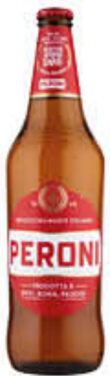
PERONI BIRRA 66 CL