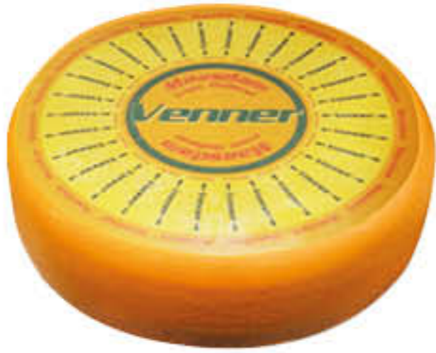
MAASDAMMER FORMA AL KG