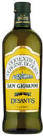
DE SANTIS OLIO EXTRA VERGINE DI OLIVA SAN GIOVANNI 1 LITRO