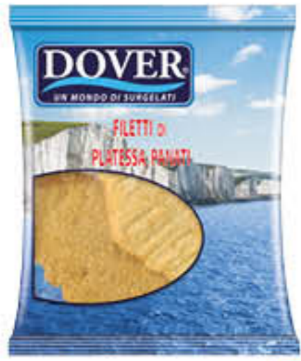
DOVER FILETTI PLATESSA PANATI 300 GR