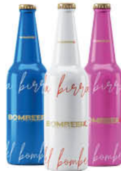
BOMBEER LA BIRRA CLASSICA/ BLU/ROSA 33 CL