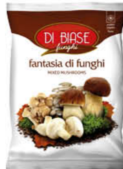
DI BIASE FANTASIA DI FUNGHI 300 GR