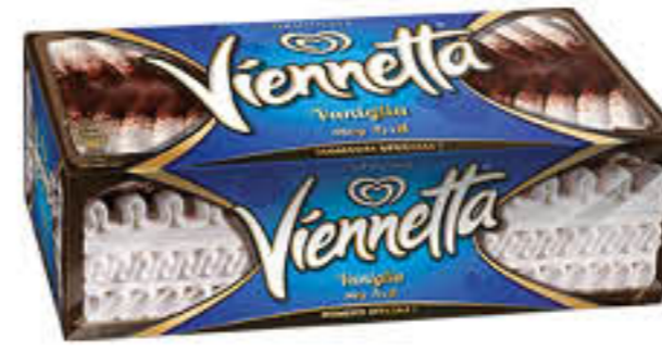
VIENNETTA VANIGLIA 360 GR