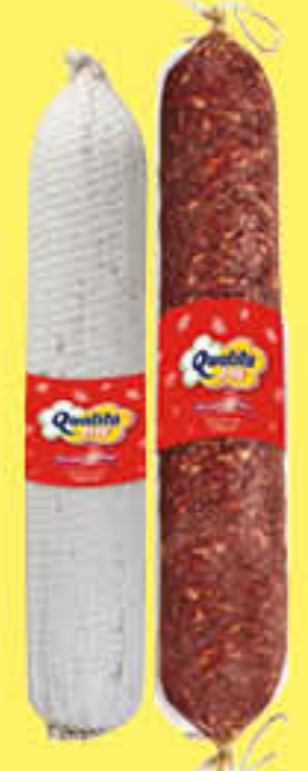
QUALITA' PIU' SALAME NAPOLI/ SALAME MILANO SELEZIONE ORO AL KG