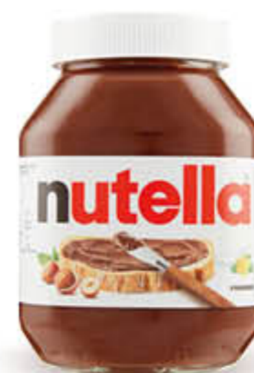
FERRERO NUTELLA 900 GR