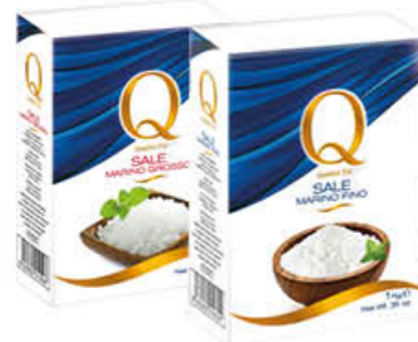
QUALITA' PIU' SALE FINO/GROSSO 1 KG