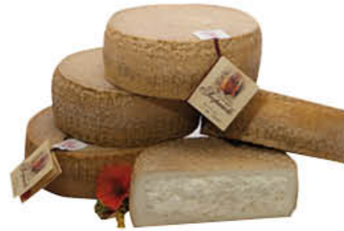
L'ANTICA CASCINA FORMAGGIO SCOPAROLO AL KG