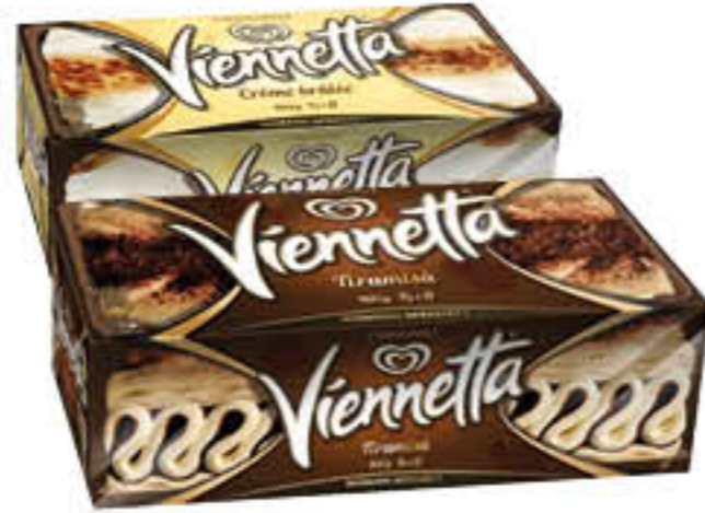
VIENNETTA SELECTION 400 GR