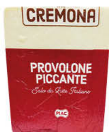
PLAC PROVOLONE TRANCIO T5 SOTTOVUOTO AL KG