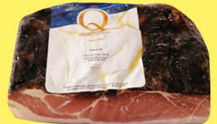
QUALITA' PIU' SPECK SELEZIONE ORO 1/2 SV AL KG