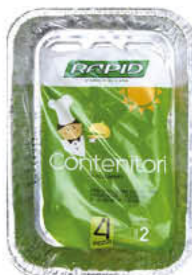
RAPID CONTENITORI ALLUMINIO SENZA COPERCHIO 8 PORZIONI 2 PEZZI 6 PORZIONI 2 PEZZI 4 PORZIONI 3 PEZZI