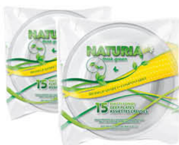
ARISTEA PIATTI BIANCHI 220 NATURA BIO FOND/PIANI X 15