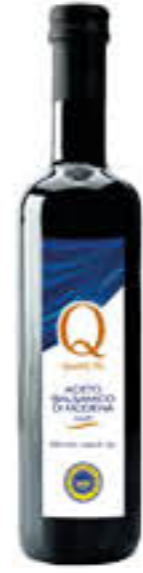
QUALITA' PIU' ACETO BALSAMICO 500 ML