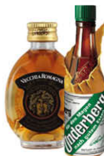
UNDERBERG/ VECCHIA ROMAGNA MIGNON