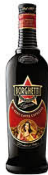
BORGHETTI LIQUORE AL CAFFÈ 1 LITRO