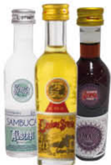
STREGA/ AMARO STREGA/ SAMBUCA STREGA/ MIGNON - 50 CC