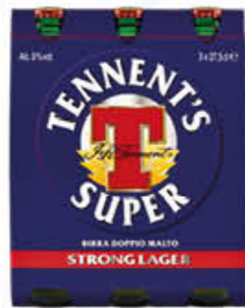
TENNETT'S BIRRA 27,5 CL X 3