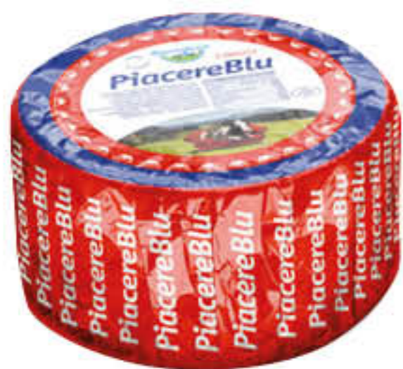
BAYERNLAND EDELPI LZ ALPEN-BLU AL KG