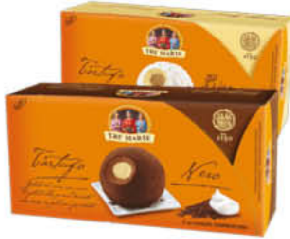
TRE MARIE DESSERT TARTUFO BIANCO/NERO