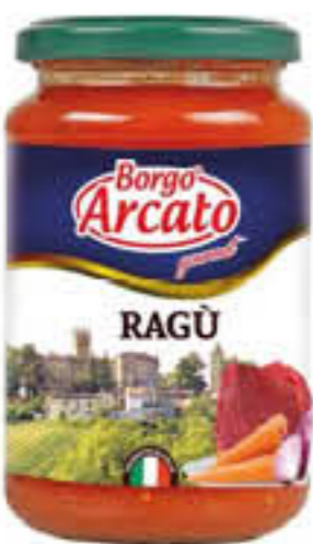
BORGO ARCATO SUGO/RAGÙ 350 GR