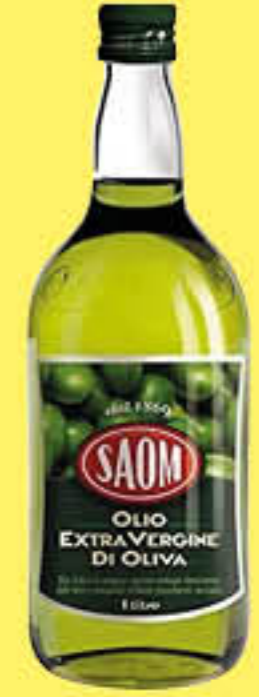
SAOM OLIO EXTRAVERGINE DI OLIVA 1 LITRO