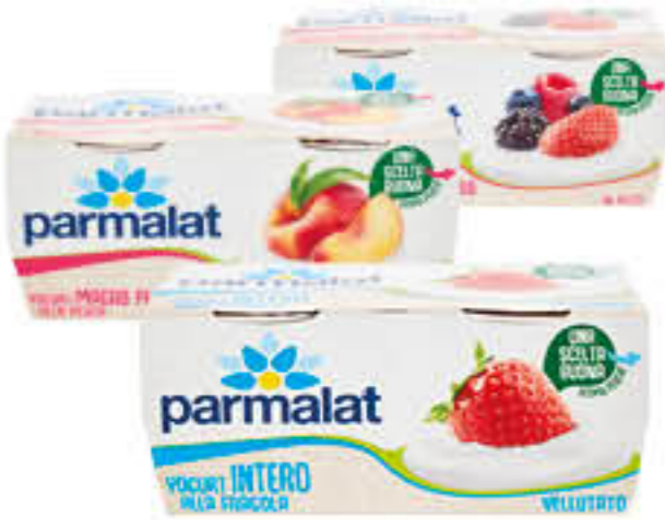
PARMALAT YOGURT 125 GR X 2