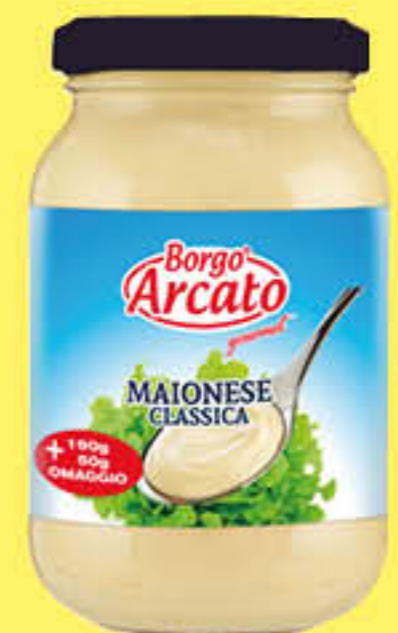
BORGO ARCATO MAIONESE 240 GR