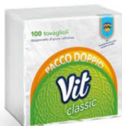
VIT TOVAGLIOLO PACCO DOPPIO 2 VELI 100PZ 33X33