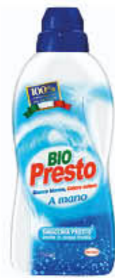
BIO PRESTO LIQUIDO A MANO 750 ML