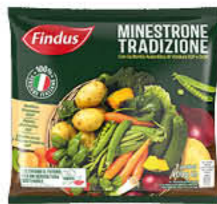
FINDUS MINISTRONE TRADIZIONE 400 GR