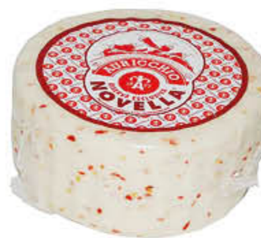
AURICCHIO CACIOTTA NOVELLA AL PEPERONCINO T2 CRY AL KG