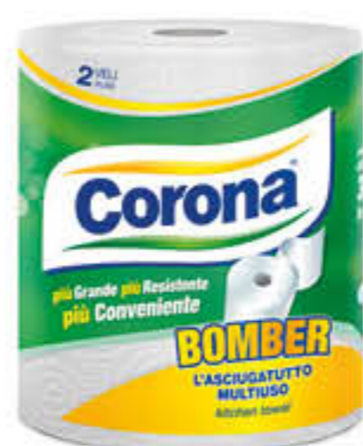
CORONA BOBINA BOMBER