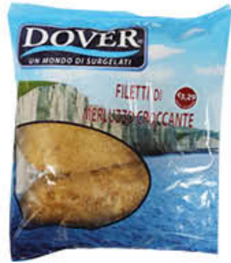
DOVER FILETTI DI MERLUZZO CROCCANTE 400 GR