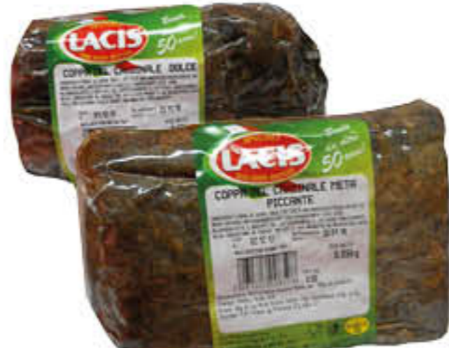
LACIS COPPA DEL CARDINALE DOLCE/PICCANTE 1/2 SV AL KG