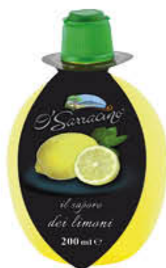
O'SARRACINO SUCCO DI LIMONE 200 ML