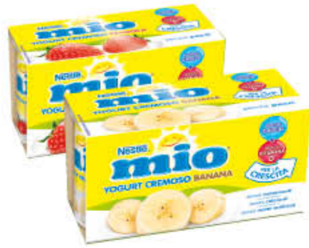
MIO YOGURT FRUTTA VARI GUSTI 125 GR X 2