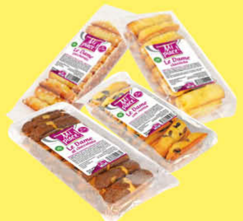
MI PIACE DAME ASSORTITE 200 GR