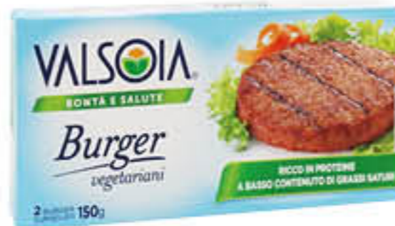
VALSOIA BURGER VEGETALI X 2 150 GR