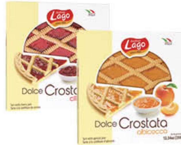
LAGO CROSTATE CILIEGIA/ALBICOCCA 350 GR