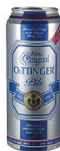
OETTINGER BIRRA LATTINA 50 CL