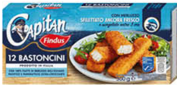
FINDUS BASTONCINI 12 PEZZI 300 GR