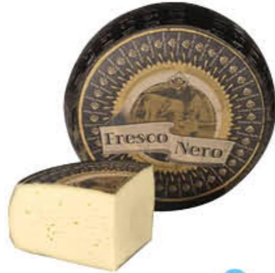
FIORDIMASO ASIAGO FRESCO NERO 1/4 SV AL KG