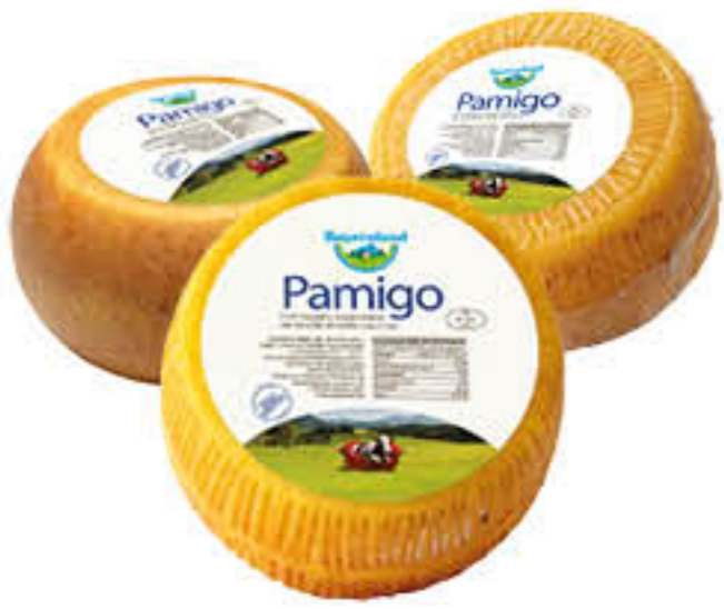
PAMIGO BAYERNLAND CESTINATO/ TELONATO/BABY SV AL KG