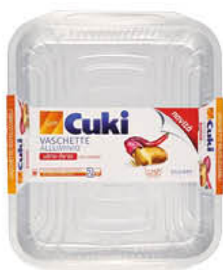
CUKI 2 VASCHETTE ALLUMINIO 12 PORZIONI C/MANICI