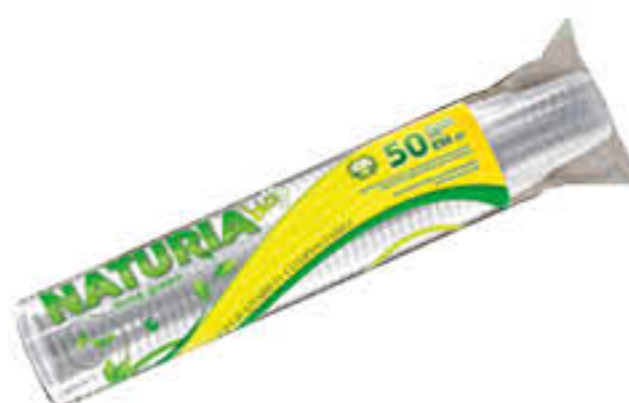
ARISTEA 50 BICCHIERI 200CC NATURA BIO