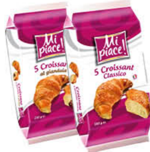
MI PIACE CROISSANT CLASSICO/GIANDUIA X 5