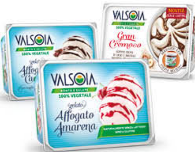
VALSOIA VASCHETTA GELATO 500 GR