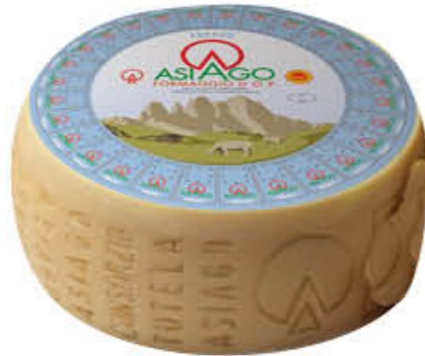
VERRELLO ASIAGO FORMA AL KG