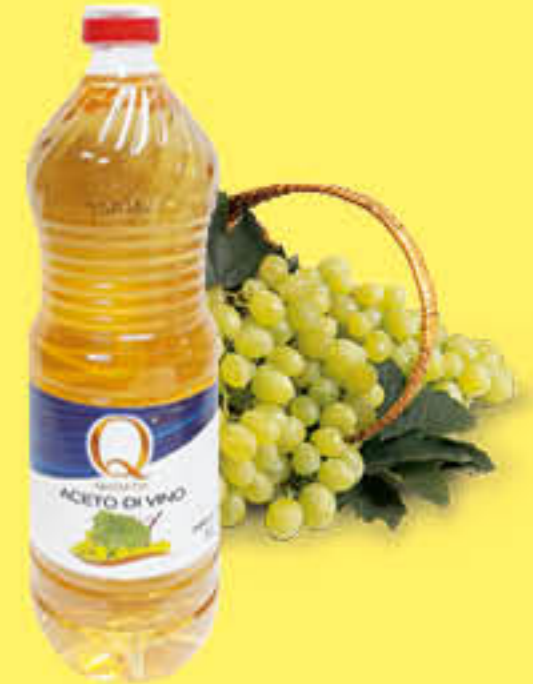
QUALITA' PIU' ACETO BIANCO PET 1 LITRO