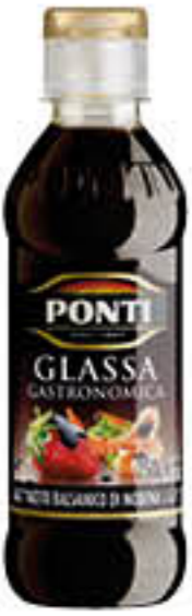
PONTI GLASSA GASTRONOMICA 250 GR