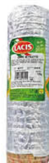
LACIS CUOR DI FILETTO 1/2 SV AL KG