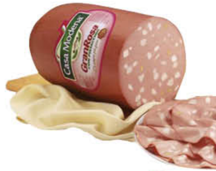
CASA MODENA MORTADELLA GRAN ROSA 1/2 AL KG