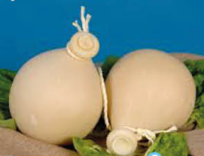
PLAC FIASCETTE T2 AL KG