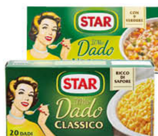
STAR DADO PER BRODO CLASSICO/VEGETALE 20 CUBI