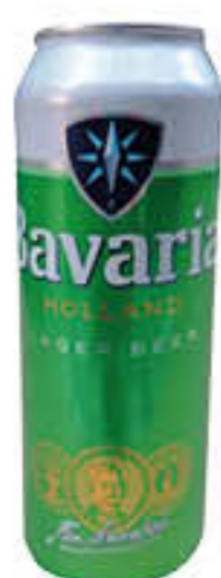
BAVARIA LAGER BIRRA LATTINA 50 CL