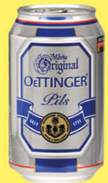
OETTINGER BIRRA LATTINA 33 CL