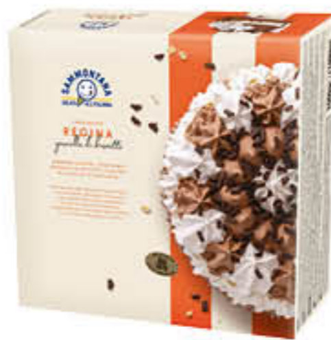
SAMMONTANA TORTA REGINA 1 KG