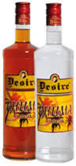
DESIRÈ RHUMA FANTASIA BIANCA/SCURA 50 CL