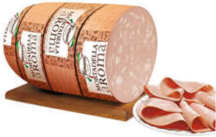
FIORUCCI MORTADELLA AROMA CON PISTACCHI AL KG