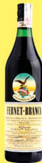
FERNET BRANCA 1 LITRO