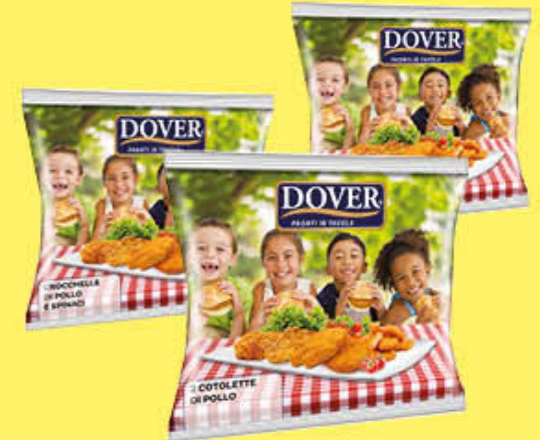
DOVER ELABORATI DI POLLO SURGELATI 180 GR