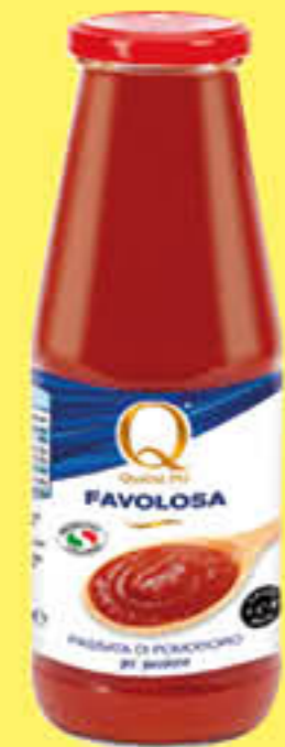
QUALITA' PIU' PASSATA DI POMODORO FAVOLOSA 700 GR