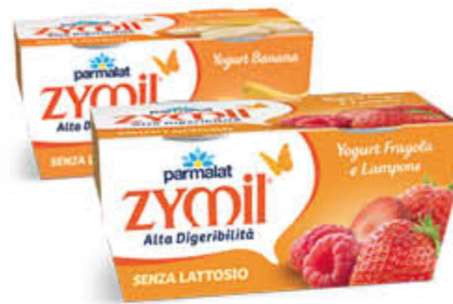
PARMALAT ZYMIL GUSTI ASSORTITI 115 GR X 2