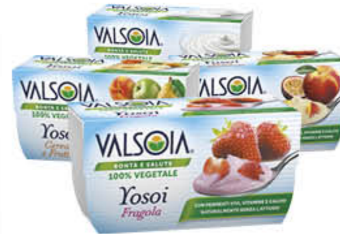
VALSOIA YOGURT YOSOÏ 125 GR X 2