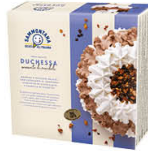
SAMMONTANA TORTA DUCHESSA 750 GR