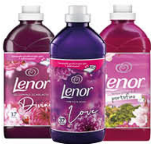
LENOR CONCENTRATO TUTTI I TIPI 40/37 LAVAGGI