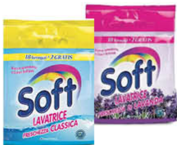
SOFT DETERGENTE LAVATRICE 20/22 MISURINI