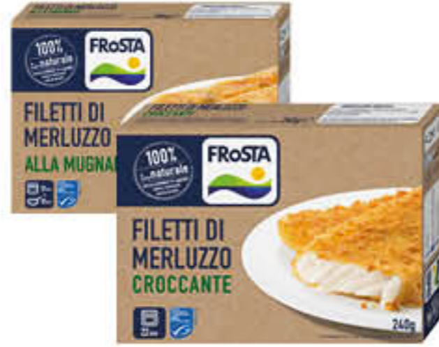
FROSTA MERLUZZO ALASKA 240/250 GR