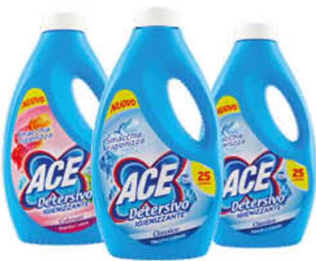
ACE DETERGENTE LIQUIDO 25 LAVAGGI