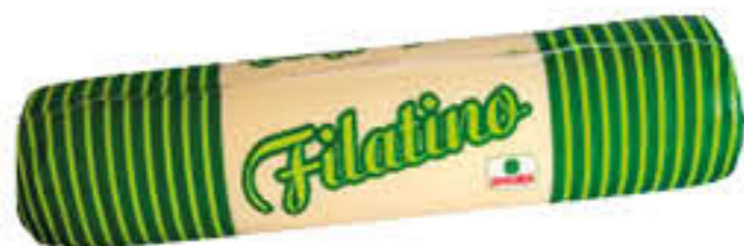
PREALPI FILATINO T5 AL KG