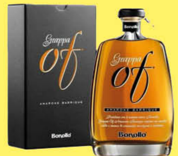
BONOLLO TASTE OF AMARONE MIGNON 5 CL