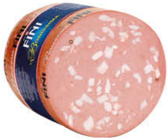
FINI MORTADELLA EMILIA CON E SENZA PISTACCHI AL KG