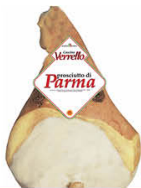
CASCINA VERRELLO PROSCIUTTO CRUDO PARMA C/OSSO AL KG