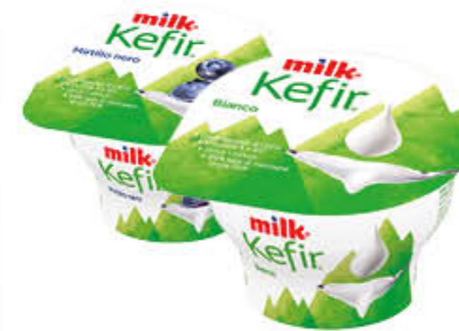
MILK KEFIR CREMOSO BIANCO/MIRTILLI/ PESCA/ALBICOCCA 150 GR