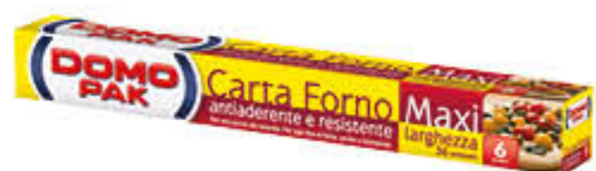
DOMOPAK CARTA DA FORNO 36 CM X 6 M