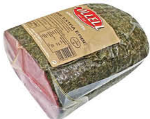
COLLELL SALAME ALLE ERBE TUNNEL AL KG