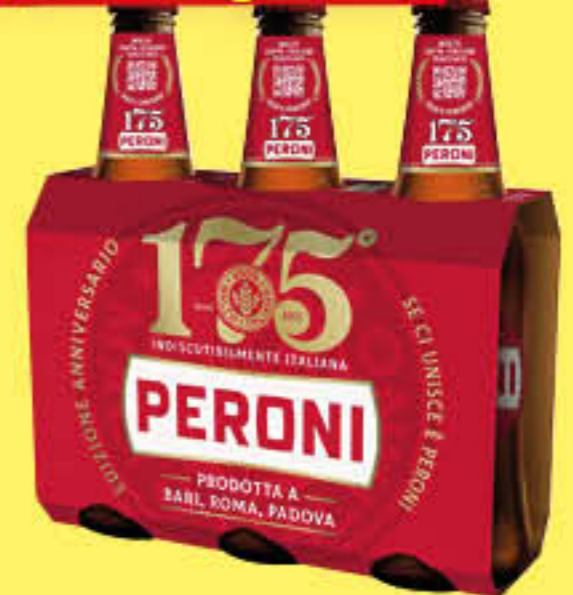
PERONI BIRRA VETRO 33 CL X 3