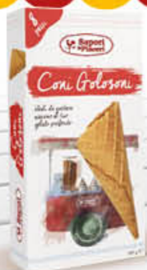
SAPORI&PIACERI CONI GOLOSONI 8 PZ