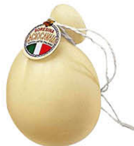
LATTORIA SORESINA CACIOCAVALLO AL KG