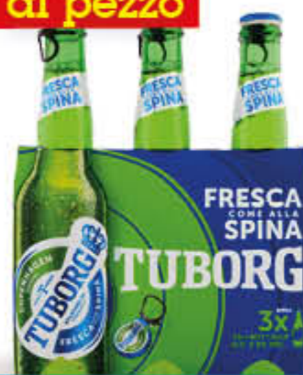
TUBORG BIRRA IN CLUSTER 33 CL X 3