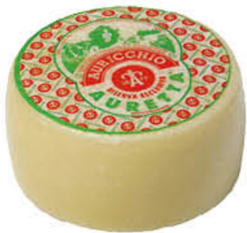
AURICCHIO AURETTA CRY T2 AL KG