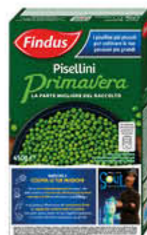
FINDUS PISELLINI PRIMAVERA 450 GR