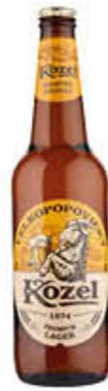
KOZEL BIRRA PREMIUM LAGER VAP 33 CL