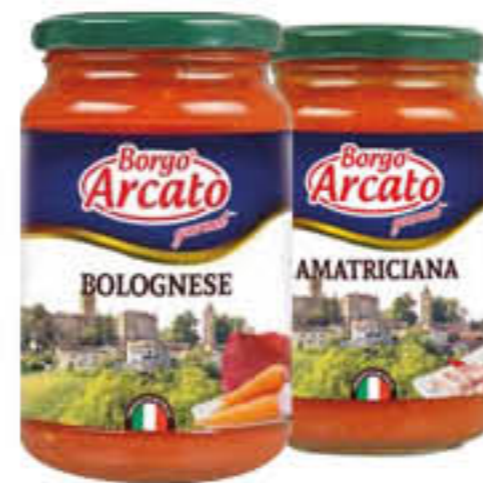
BORGO ARCATO SUGHI AMATRICIANA E BOLOGNESE 350 GR