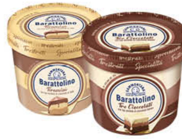
SAMMONTANA BARATTOLINO SPECIALITA' 410 GR