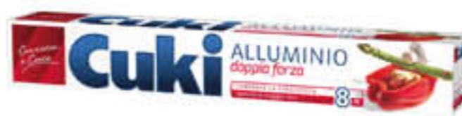
CUKI ALLUMINIO 8 METRI