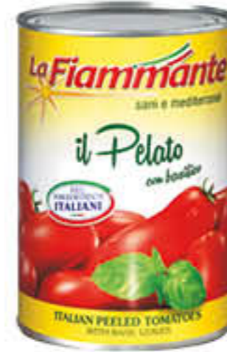
LA FIAMMANTE PELATI C/BASILICO 400 GR