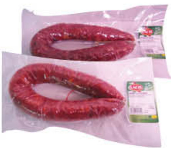
LACIS SALSICCIA CIAMBELLA DOLCE E PICCANTE 300 GR