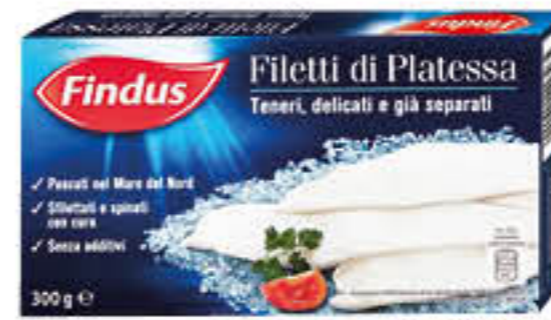
FINDUS FILETTI DI PLATESSA 300 GR