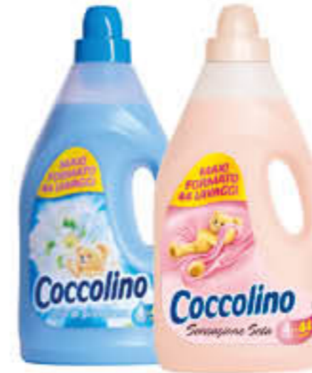
COCCOLINO AMMORBIDENTE TUTTI I TIPI 3 LITRI