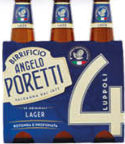
PORETTI 4 LUPPOLI 33 CL X 3