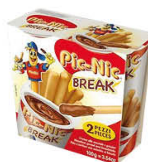
HOSTA PICNIC BREAK BIPACK 100 GR