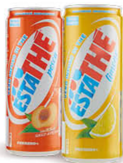
ESTATHE' LIMONE/PESCA LATTINA 33 CL