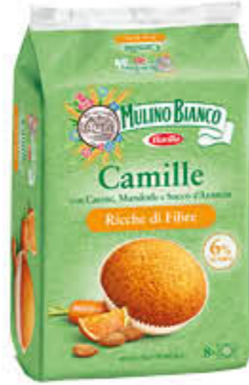
MULINO BIANCO CAMILLE X 8 304 GR