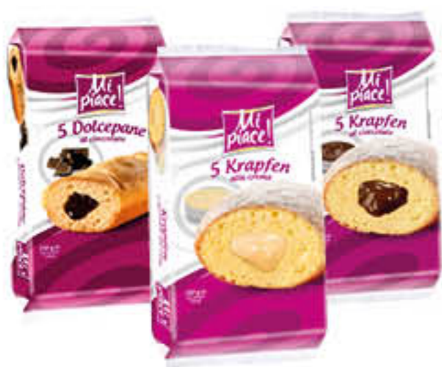
MI PIACE KRAPPEN/ DOLCEPANE X 5