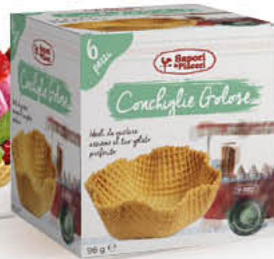
SAPORI&PIACERI CONCHIGLIE GOLOSE 6 PEZZI