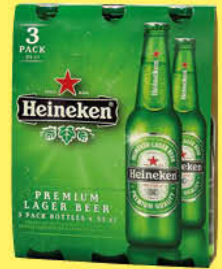
HEINEKEN BIRRA VETRO 33 CL X 3