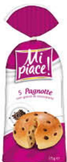
MI PIACE PAGNOTTE 175 GR