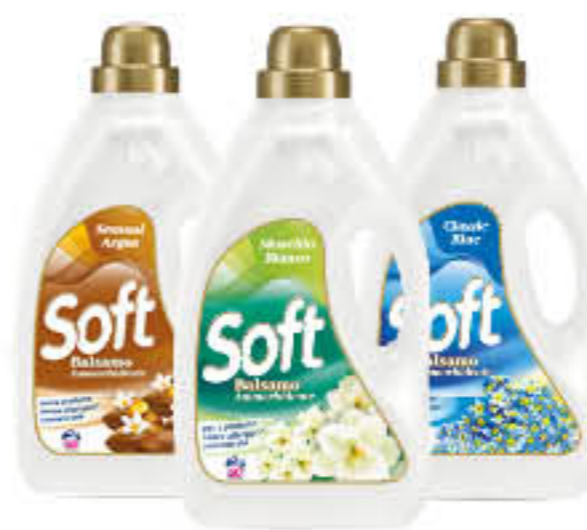
SOFT AMMORBIDENTE TUTTI I TIPI 50 LAVAGGI