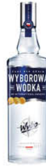
WYBOROVA VODKA 1 LITRO