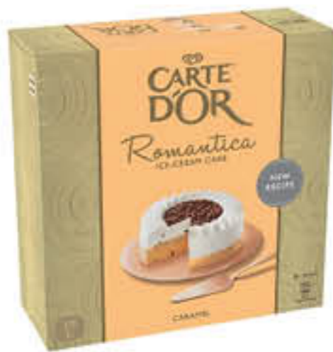
ALGIDA TORTA ROMANTICA 545 GR