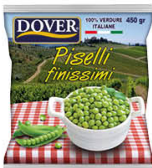
DOVER PISELLI FINISSIMI 450 GR