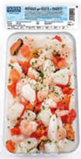
DOVER PREPARATI RISOTTO & SPAGHETTI 200 GR