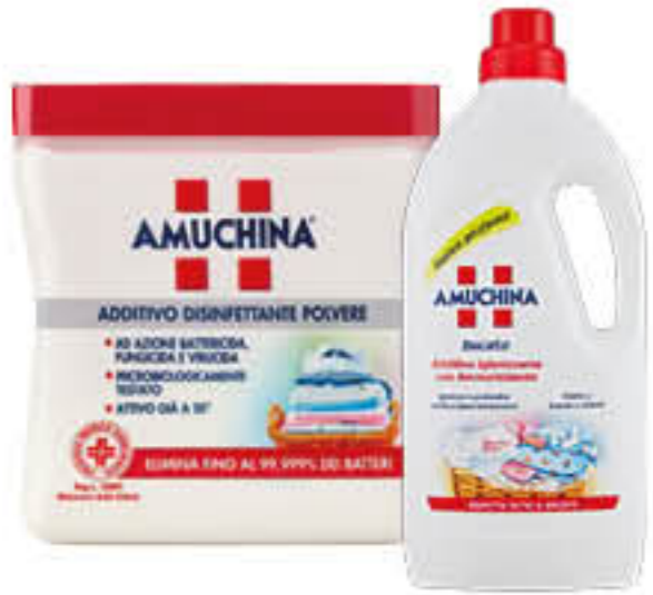
AMUCHINA ADDITIVO BUCATO LIQUIDO 1 LITRO/POLVERE 500 GR