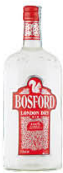
BOSFORD GIN 1 LITRO