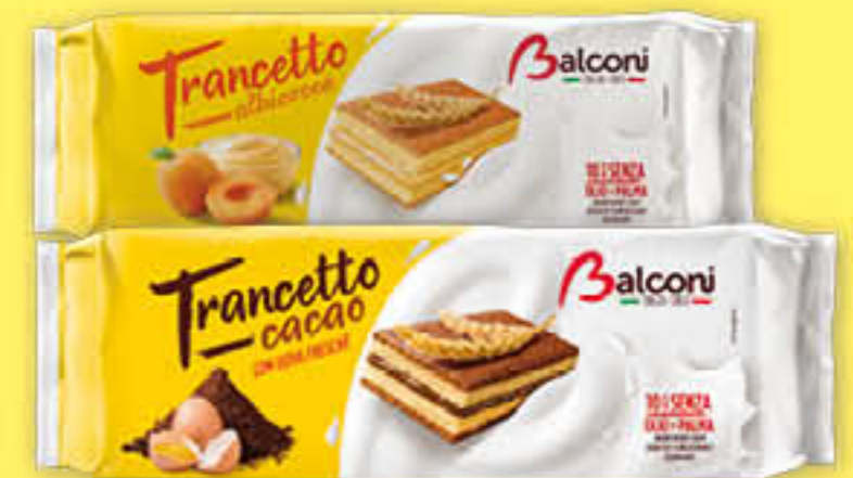
BALCONI TRANCETTO 10 MERENDINE