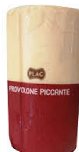
PLAC PROVOLONE TRANCIO T3 SOTTOVUOTO AL KG