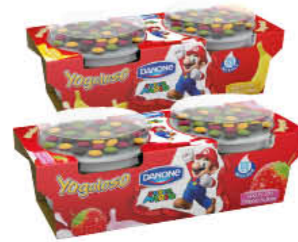
YOGOLOSO SUPERMARIO 110 GR X 2