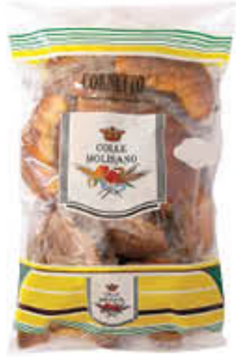
COLLE MOLISANO CORNETTI IMBUSTATI CLASSICI X 9