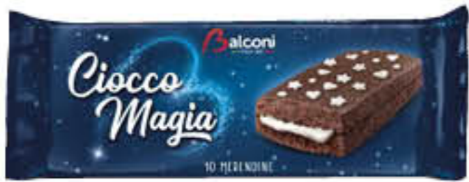
BALCONI CIOCCO MAGIA SNACK X 10 280 GR