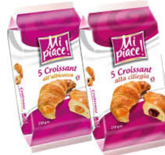
MI PIACE CROISSANT ALBICOCCA/ CILIEGIA X 5