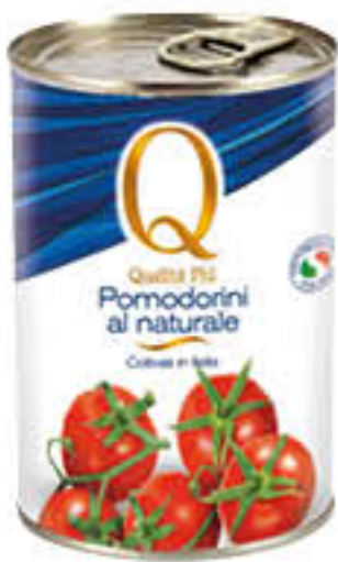
QUALITA' PIU' POMODORINI COLLINA 400 GR