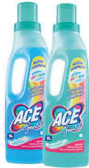
ACE GENTILE 1 LITRO