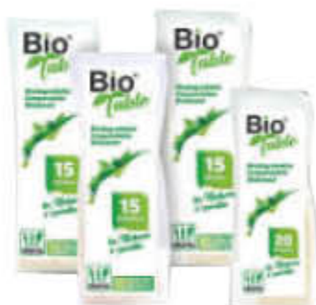
BIO TABLE POSATE X 15/ CUCCHIAINI X 20