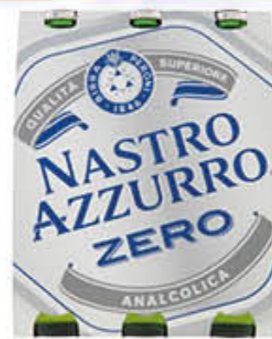
NASTRO AZZURRO BIRRA ZERO 33 CL X 3