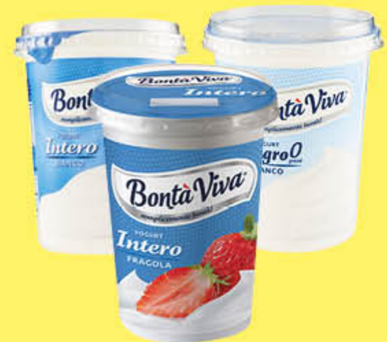
BONTÀ VIVA YOGURT INTERO FRUTTA 500 GR