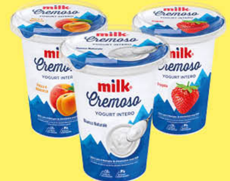
MILK YOGURT ALLA FRUTTA / BIANCO 400 GR