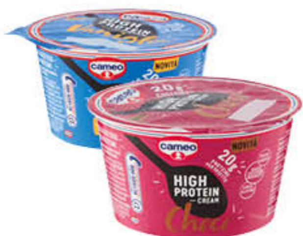
CAMEO HIGH PROTEIN CREAM CHOCO /VANIGLIA 200 GR