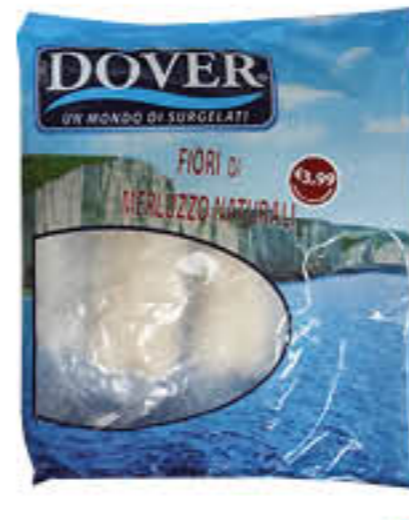
DOVER FIORI MERLUZZO NATURALI 300 GR