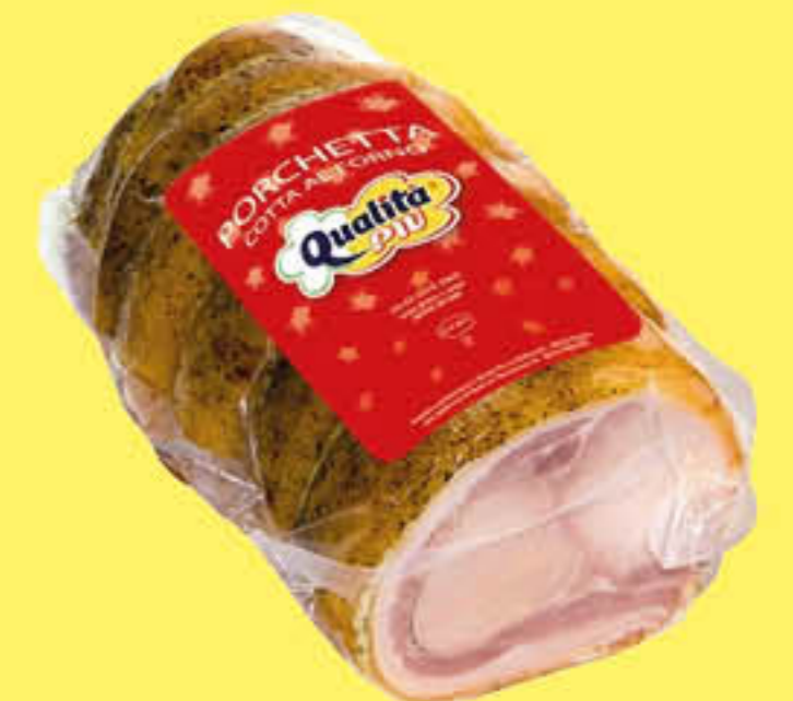
QUALITA' PIU' PORCHETTA 1/2 SV AL KG