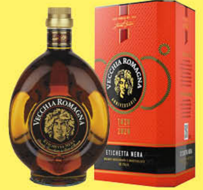
VECCHIA ROMAGNA ETICHETTA NERA 70 CL