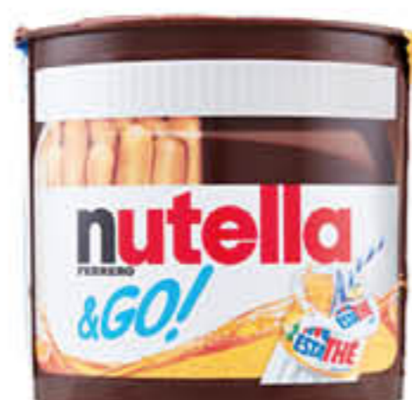
FERRERO NUTELLA & GO 52 GR