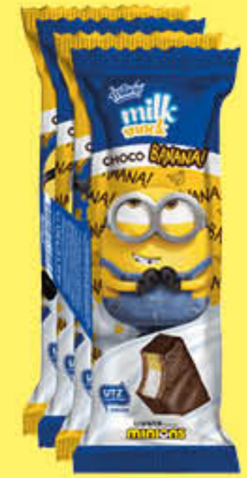
MILK MINIONS SNACK CHOCO BANANA 30 X 4