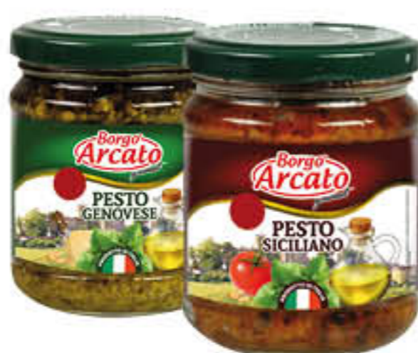
BORGO ARCATO PESTO SICILIANO/GENOVESE 180 GR