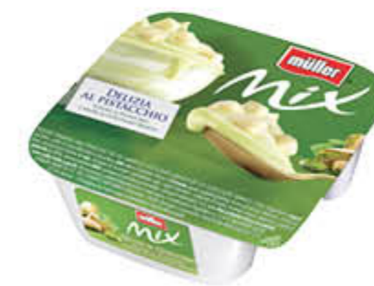
MULLER DELIZIE MIX 150 GR