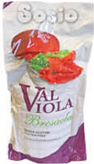
SOSIO BRESAOLA VALVIOLA 1/2 SV AL KG