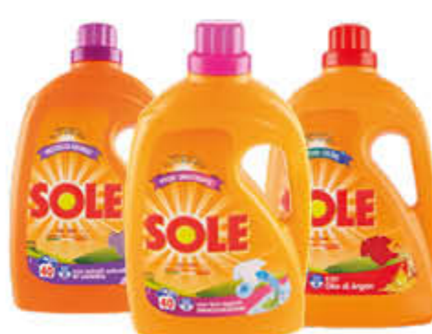
SOLE LIQUIDO LAVATRICE 40/37 LAVAGGI