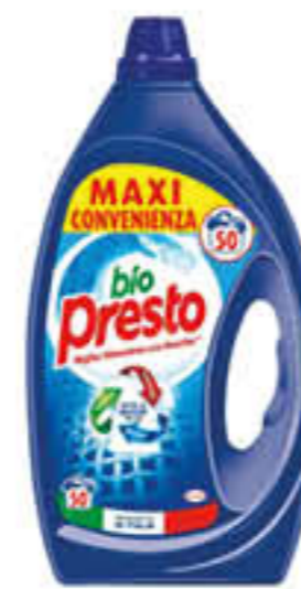
BIO PRESTO LIQUIDO CLASSICO/COLOR/ IGIENE&FRESCHENZA 50 LAVAGGI