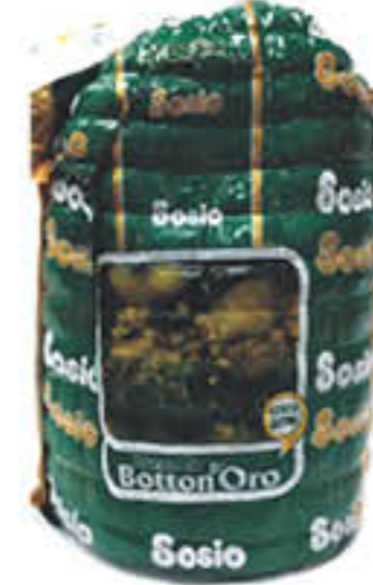
SOSIO BRESAOLA PUNTA D'ANCA 1/2 SV AL KG