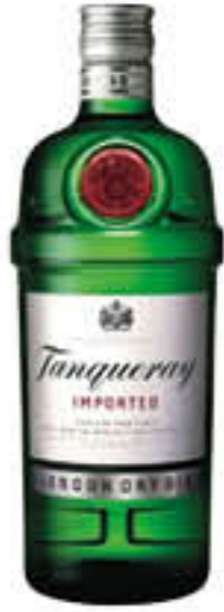
TANQUERAY GIN 1 LITRO