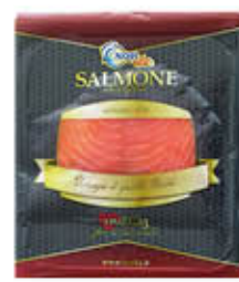
NORITA SALMONE NORVEGESE 50 GR