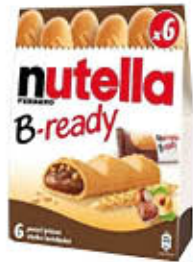
NUTELLA B-READY X 6 132 GR