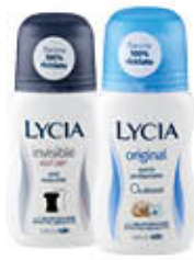
LYCIA DEO ROLL ON 50 ML