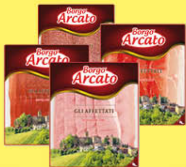
BORGO ARCATO SALUMI TAKEAWAY 50/60/70 GR