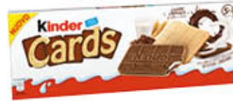
KINDER CARDS X 5 128 GR