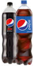
PEPSI COLA CLASSICA/MAX 1,5 LITRI