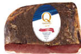
QUALITÀ PIÙ SPECK SELEZIONE ORO 1/2 SV AL KG