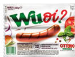
CITTERIO WUOI WURSTEL 100 GR