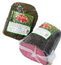
COLLELL SALAME PEPE/ ERBE TUNNEL AL KG