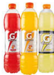
GATORADE 1,5 LITRI