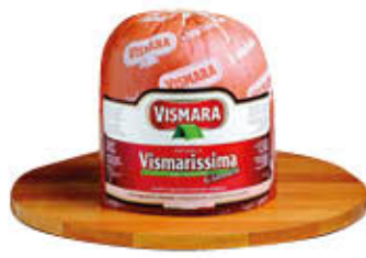
VISMARA MORTADELLA VISMARISSIMA T 6,5 AL KG