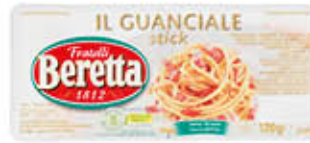
BERETTA GUANCIALE STICK 120 GR