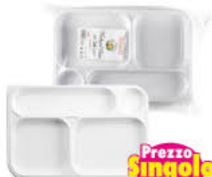
ARISTEA VASSOIO 4 SCOMPARTI