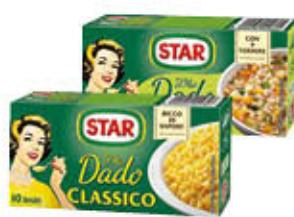
STAR DADO CLASSICO/VEGETALE X 10