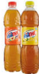
ESTATHE' LIMONE/PESCA 1,5 LITRI