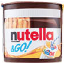
FERRERO NUTELLA&GO 52 GR