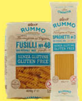
RUMMO PASTA GLUTEN FREE 400 GR