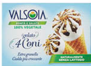
VALSOIA GELATO 4 CONI 300 GR