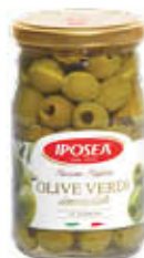
IPOSEA OLIVE VERDI DENOCCIOLATE VETRO 290 GR