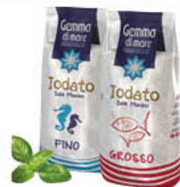
GEMMA SALE IODATO SACCO 1 KG