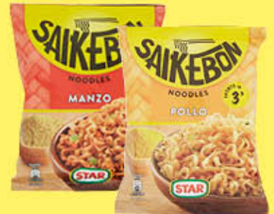
SAIKEBON BUSTA STAR POLLO E MANZO 79 GR