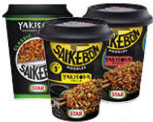
STAR YAKISOBA 93 GR