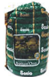
SOSIO BRESAOLA PUNTA D'ANCA 1/2 SV AL KG