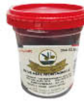
CORCIONE OLIVE MONTAGNOLA ITALIA 250 GR