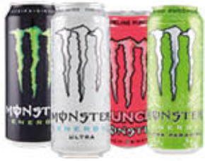
MONSTER 51 CL