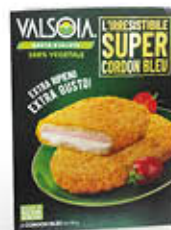
VALSOIA CORDON BLEU 200 GR