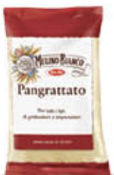
MOLINO BIANCO PAN GRATTATO 400 GR