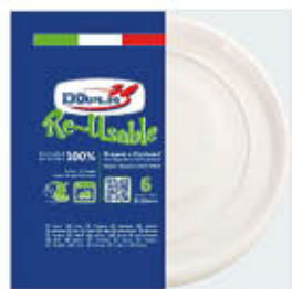
DOPLA PIATTI PIZZA RIUTILIZZABILI X 6 PZ