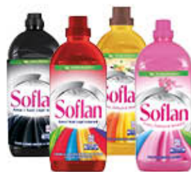
SOFLAN 1 LITRO