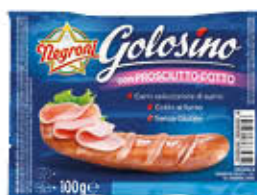
GOLOSINO WURSTEL 100 GR