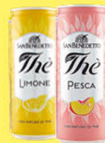
SAN BENEDETTO THE' LATTINA 33 CL