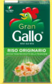
GALLO RISO ORIGINARIO 1 KG