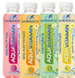
SAN BENEDETTO AQUAVITAMIN 40 CL