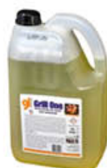
GRILL ONE SGRASSATORE 5 KG