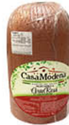
CASA MODENA MORTADELLA GRAN ROSA 1/2 AL KG