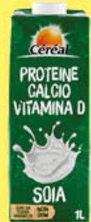
CEREAL SOIA CALCIO 1 LITRO