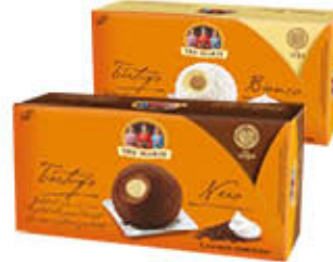
TRE MARIE DESSERT TARTUFO BIANCO/NERO