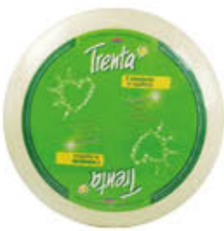
WESTLAND TRENTE SPECIALITÀ SV AL KG