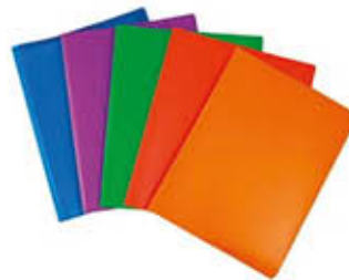
PORTA-LISTINI FLUO 40 BUSTE