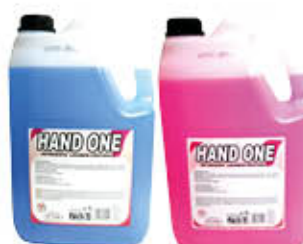
HAND ONE SAPONE MANI LIQUIDO MELOGRANO/CLASSICO 5 KG