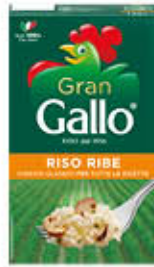
GALLO RISO RIBE 500 GR