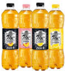
SAN BENEDETTO THE CLASSICO/ZERO 1,5 LITRI