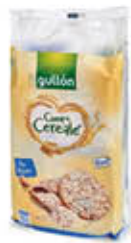
GULLON GALLETTE 109/115 GR