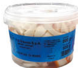
D'AVINO INSALATA DI MARE 500 GR