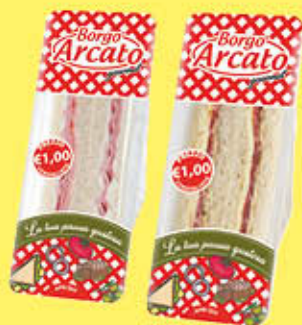
BORGO ARCATO TRAMEZZINI FARCITI 140 GR