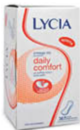
LYCIA PROTEGGI SLIP DISTESO X 36