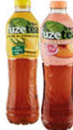
FUZE TEA LEMONGRASS/ PEACH ROSE 1,25 LITRI