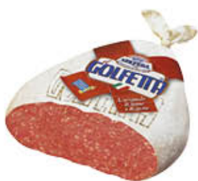
GOLFERA SALAME GOLFETTA SV AL KG