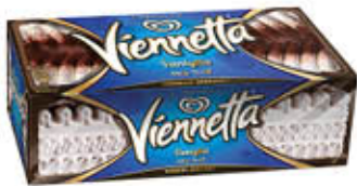
VIENNETTA VANIGLIA 360 GR