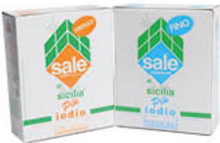
ITALKALI SALE IODATO ASTUCCIO 1 KG