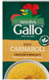
GALLO RISO CARNAROLI 1 KG