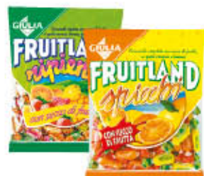
GIULIA CAREMELLE SACCHETTI TUTTI I TIPI 200 GR