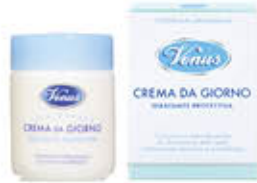
VENUS CREMA DA GIORNO VASO 50 ML