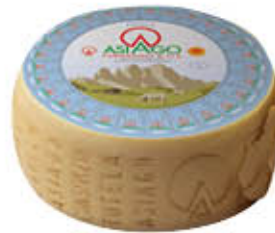
VERRELLO ASIAGO FORMA AL KG