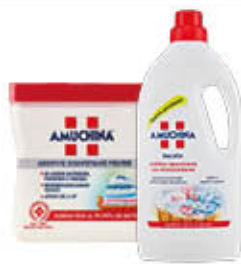
AMUCHINA ADDITIVO BUCATO LIQUIDO 1 LITRO/POLVERE 500 GR