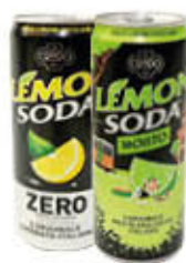
MOJITO SODA/ LEMONSODA ZERO LATTINA 33 CL