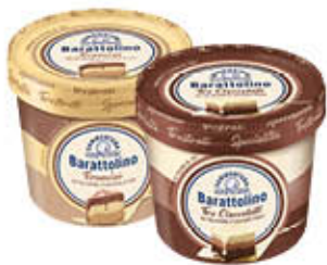
SAMMONTANA BARATTOLINO SPECIALITA' 410 GR