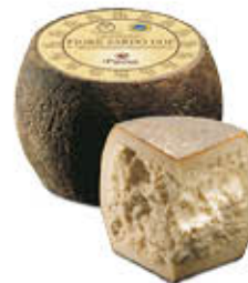
PINNA FIORE SARDO DOP AL KG