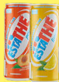
ESTATHE' LIMONE/PESCA LATTINA 33 CL