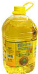
DESANTIS OLIO DI SEMI DI GIRASOLE PET - 5 LITRI