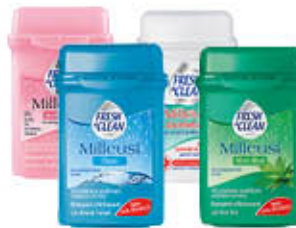
FRESH & CLEAN 40 SALVIETTE TRAVEL