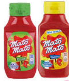
KRAFT MATO MATO SQUIZ DOLCE/PICCANTE 390 GR