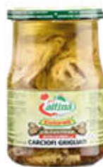
ATTINA' CARCIOFI GRIGLIATI OLIO DI SEMI 580 ML