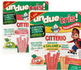
CITTERIO UNDUETRIS BASTONCINI SALAME/ COTTO 132 GR