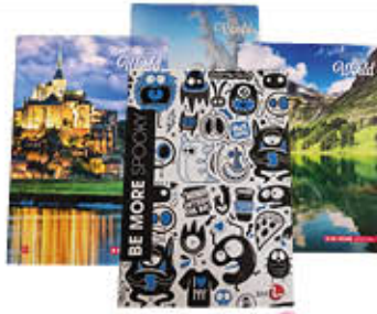
QUADERNI MAXI VARI FORMATI