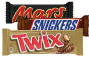
MARS/TWIX SNICKERS/ SINGOLO