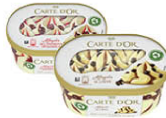
CARTE D'OR AFFOGATI TUTTI I TIPI 500 GR