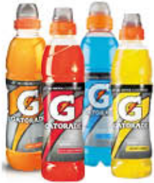
GATORADE LIMONE/ARANCIA ARANCIA ROSSA COOL BLUE - 50 CL