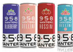
SANTERO SPUMANTE 958 LATTINA VARI TIPI 25 CL