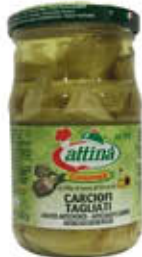
ATTINA' CUORI CARCIOFI OLIO SEMI 314 ML