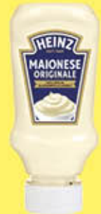
HEINZ MAIONESE SQUISITAMENTE BUONA TOP DOWN 215 GR