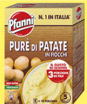
PFANNI PURE DI PATATE FIOCCHI 300 GR 4 B S X 75 GR