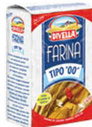
DIVELLA FARINA 00 1 KG