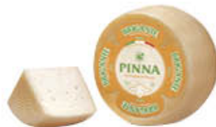
PINNA FORMAGGIO BRIGANTE SARDO AL KG