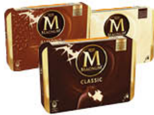
ALGIDA MAGNUM CLASSICO/BIANCO/ MANDORLE X 4