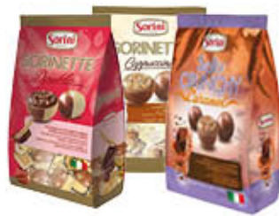
SORINI CIOCCOLATINI ASSORTITI 90/120 GR