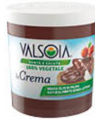
VALSOIA CREMA VEGETALE 200 GR