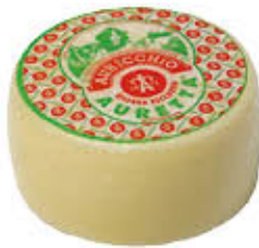
AURICCHIO AURETTA CRY T2 AL KG