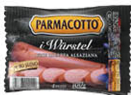
PARMACOTTO BONWURST WURSTEL 4 PZ 100 GR