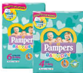
PAMPERS PANNOLINI BABY DRY TUTTE LE MISURE