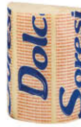
LATTERIA SORESINA PROVOLONE DOLCE TRANCIO SV AL KG