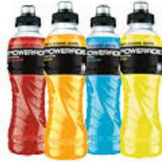
POWERADE 500 ML