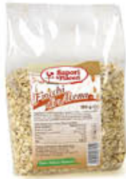
SAPORI & PIACERI FIOCCHI D' AVENA 500 GR