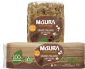
MISURA PASTA DI SEMOLA INTEGRALE 500 GR