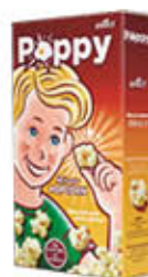
SELECT POP CORN POPPY 250 GR