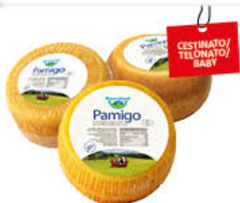
PAMIGO BAYERNLAND SV AL KG