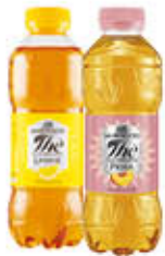
SAN BENEDETTO THE LIMONE/PESCA 50 CL