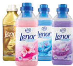
LENOR CONCENTRATO TUTTI I TIPI 550/575 ML