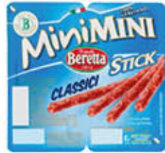
BERETTA STICK MINI CLASSICI 60 GR