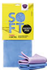
PANNO MAGICO IN PVA 30X30