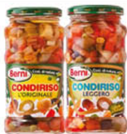
BERNI CONDIRISO L'ORIGINALE/ LEGGERO 285 GR