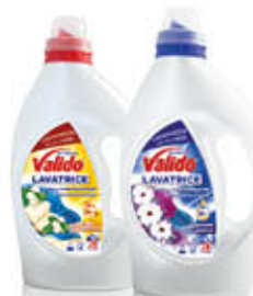
VALIDO DETERSIVO LAVATRICE 28 LAVAGGI 1,3 LITRI