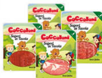
COCCOLONI TAKE AWAY SALUMI 40/50/60/70 GR