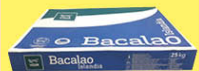
VISIR BACCALÀ ISLANDA 4000 UP 12AA AL KG