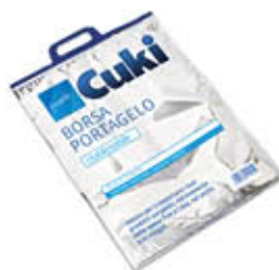
CUKI BORSA PORTAGEOLO 40 X 50