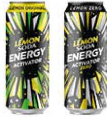
LEMONSODA ENERGY ACTIVATOR 50 CL