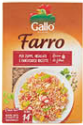
GALLO FARRO NORMALE 400 GR