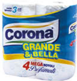
CORONA CARTA IGIENICA GRANDE & BELLA 3 VELI 4 ROTOLI