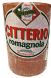
CITTERIO MORTADELLA ROMAGNOLA T 15 AL KG