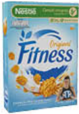
NESTLÉ CEREALI FITNESS 375 GR