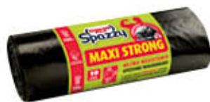
SPAZZY MAXISTRONG 80 X 120 LT 150 X 10