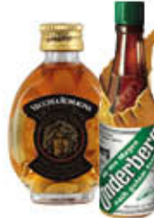
UNDERBERG/ VECCHIA ROMAGNA MIGNON