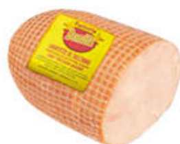
AMADORI BONITA ARROSTATO DI TACCHINO AL KG