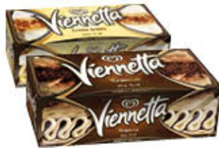
VIENNETTA SELECTION 400 GR