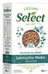
SELECT LENTICCHIE MEDIE 400 GR