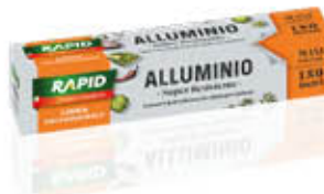
RAPID ALLUMINIO PROFESSIONALE 150 METRI