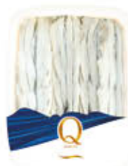
QUALITA' PIU' ALICI MARINATE CLASSICHE 170 GR