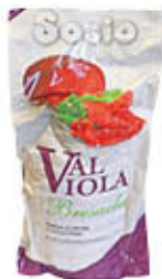
SOSIO BRESAOLA VALVIOLA 1/2 SV AL KG