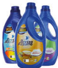
BREZZA AZZURRA LAVATRICE 30 LAVAGGI