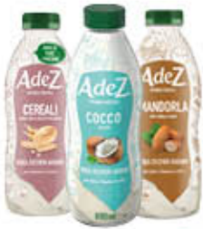
ADEZ BEVANDA VEGETALE CEREALI/COCCO/ MANDORLE 800 ML