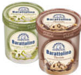
SAMMONTANA BARATTOLINO LE DELIZIE 500 GR