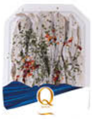
QUALITA' PIU' ALICI MARINATE PICCANTI 200 GR