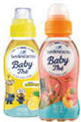
SAN BENEDETTO THE DETAINATO BABY 250 ML