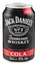
JACK DANIELS JACK & COLA 33 CL