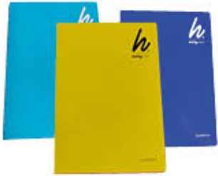
QUADERNONI 20 FOGLI+1 80 GR