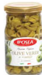
IPOSEA OLIVE VERDI A RONDELLE 314 ML