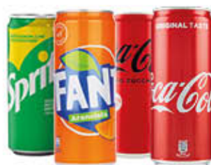
FANTA/ COCA COLA/ SPRITE LATTINA 33 CL