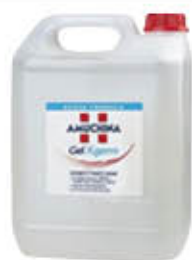
AMUCHINA X-GERM DA 5 LITRI