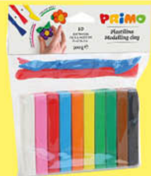
PRIMO PLASTILINA 10 COLORI + 3 ACCESSORI