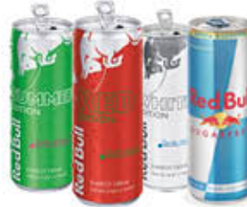
RED BULL SPECIAL EDITION 25 CL