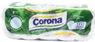
CORONA CARTA IGIENICA 10 ROTOLI 2 VELI