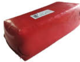
ADAMINO FORMAGGIO 2,5 KG