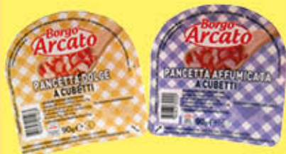
BORGO ARCATO CUBETTI PANCETTA AFFUMICATA/DOLCE 90 GR