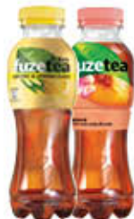
FUZE TEA PET LEMONGRASS/ PEACH ROSE 400 ML