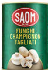
SAOM FUNGHI CHAMPIGNON 390 GR