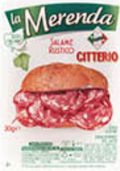
CITTERIO MERENDA SALAME RUSTICO 30 GR