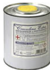
GAM CRESO SOLINA EXTRA LATTINA 1 LITRO