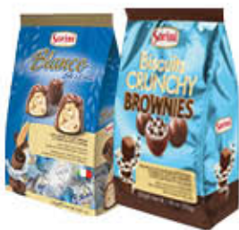
SORINI CIOCCOLATINI DARK/SCACCO/ MOUSSE/BLANCO 250 GR