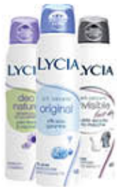
LYCIA DEO SPRAY TUTTI I TIPI 150 ML