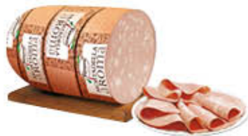
FIORUCCI MORTADELLA AROMA CON PISTACCHI AL KG