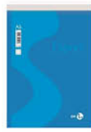
BLOC NOTES 15X21 A5 FG.60