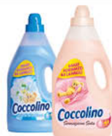
COCCOLINO AMMORBIDENTE TUTTI I TIPI 3 LITRI