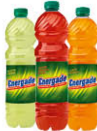
ENERGADE ARANCIATA/ ARANCIATA ROSSA/ LIMONE 1,5 LITRI