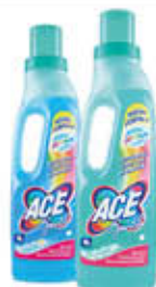
ACE GENTILE 1 LITRO