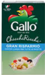
GALLO RISO GRAN RISPARMIO 850 GR