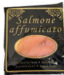
SALMONE NORVEGESE AFFUMICATA BUSTA NERA 100 GR