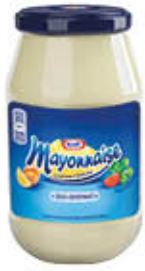
KRAFT MAYONNAISE 490/465 GR