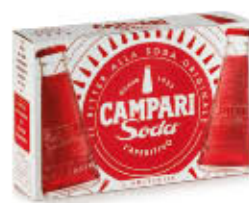
CAMPARI SODA CONFEZIONE X 10