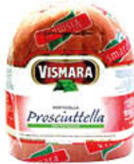
VISMARA MORTADELLA PROSCIUTTELLA 1/2 SV AL KG