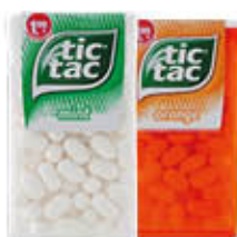
FERRERO TIC TAC