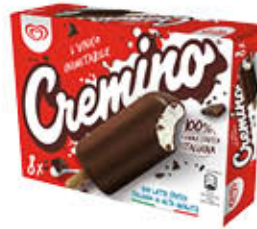
ALGIDA CREMINO 8 PEZZI CLASSICO/BIANCO 336 GR