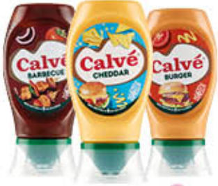
CALVÉ SALSE SQUEEZE VARI TIPI 250 ML