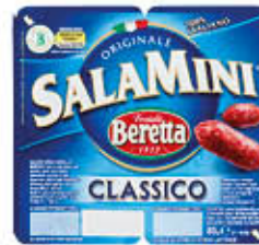
BERETTA SALAMINI CLASSICI 85 GR