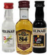
STOCK 84/ MOLINARI CLASSICO E CAFFÈ MIGNON