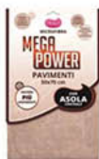
MEGA POWER PANNO PAVIMENTI C/ASOLA 50X70