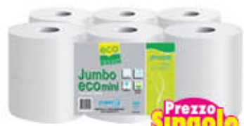
PAPERBLU IGIENICA MINI JUMBO ECO 140 METRI