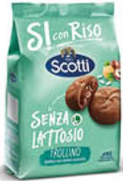
SCOTTI BISCOTTI RIPIENI CREMA NOCCIOLA 200 GR