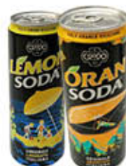
LEMONSODA/ ORANSODA LATTINA 33 CL