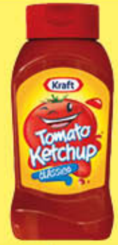
KRAFT TOMATO KETCHUP SQUEEZE CLASSICO 465 GR