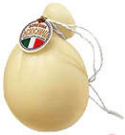
LATTERIA SORESINA CACIOCAVALLO AL KG