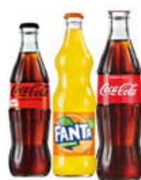
SPRITE/FANTA/ COCA COLA CLASSICA E ZERO VETRO 33 CL