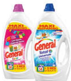
GENERAL LIQUIDO LAVATRICE UNIVERSALE/COLOR 54 LAVAGGI