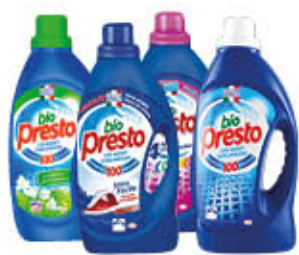
BIO PRESTO LIQUIDO LAVATRICE 18/19 LAVAGGI