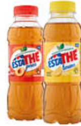
ESTATHE' THE LIMONE/PESCA 400 ML