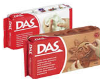
FILA DAS PASTA BIANCA/TERRACOTTA