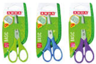
ARDA BLISTER FORBICI BASIC 12CM