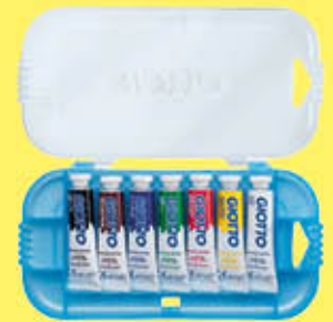
GIOTTO TEMPERA TUBO 7,5 ML 7 PZ