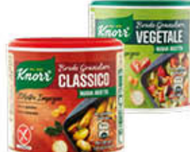
KNORR BRODO GRANULARE TUTTI I TIPI 150 GR