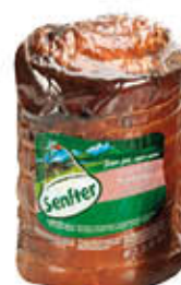
SENFTER PORCHETTA TRANCIO SV AL KG