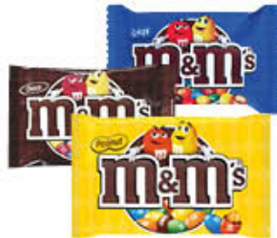
M&M'S ARACHIDI/CHOCO/ CRISPY 36/45 GR