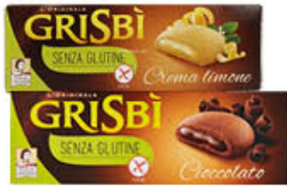
GRISBI BISCOTTI S/GLUTINE CIOCCOLATO/LIMONE 150 GR