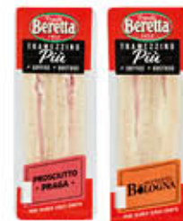
BERETTA TRAMEZZINI PROSCIUTTO COTTO/ COTTOPRAGA/ MORTADELLA 140 GR