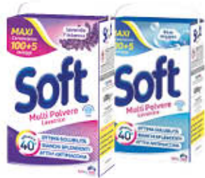
SOFT LAVANDA/ BLU OXYGEN FUSTONE 105 MISURINI