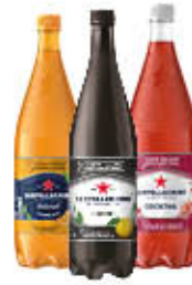
SAN PELLEGRINO BIBITE PET 1,25 LT