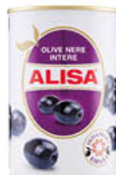
ALISA OLIVE NERE 425 GR