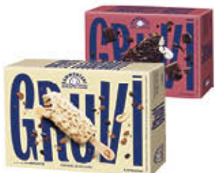
SAMMONTANA STECO GRUVI STRACCIATELLA/CAFFÈ/ PISTACCHIO