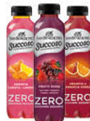
SAN BENEDETTO SUCCOSO ZERO 40 CL