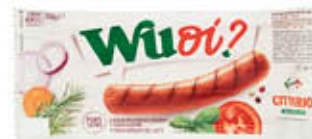
CITTERIO WURSTEL MAXI 250 GR