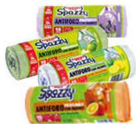
SPAZZY ANTIFORO PROFUMATI 15 SACCHI DA 28 LITRI TUTTI I TIPI