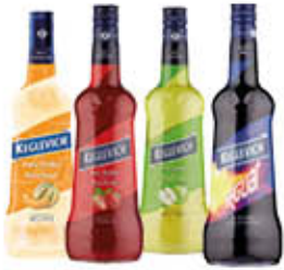
KEGLEVICH VODKA ALLA FRUTTA ESCLUSO LIMONE E PANNA E FRAGOLA 70 CL