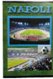
QUADERNI MAXI NAPOLI 4EVER