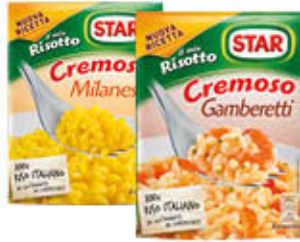
STAR RISOTTI CREMOSI TUTTI I TIPI 2 PORZIONI 175 GR