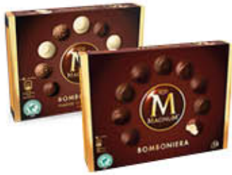
MAGNUM BOMBONIERA CLASSIC/CAV X 12