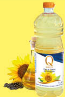
QUALITA' PIU' OLIO DI SEMI DI GIRASOLE PET - 1 LITRO