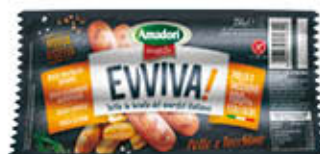
EVVIVA WURSTEL POLLO E TACCHINO 250 GR