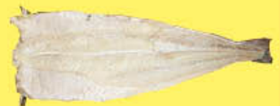
BACCALÀ SALATO NORVEGESE 12A 7/9 AL KG