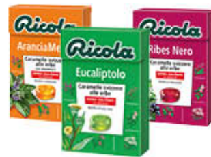
RICOLA SENZA ZUCCHERO TUTTI I TIPI ASTUCCIO 50 GR