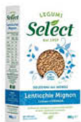
SELECT LENTICCHIE MIGNON 400 GR