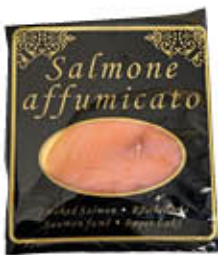
SALMONE NORVEGESE BUSTA NERA 50 GR