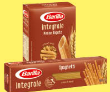
BARILLA PASTA INTEGRALE TUTTI I TIPI 500 GR