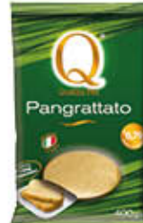
QUALITA' PIU' PANGRATTATO 400 GR