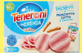
TENERONI MERENDA 170 GR