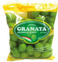
GRANATA OLIVE VERDI GIGANTI 500 GR SGOCCIOLATO