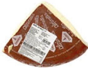
FONTAL FORMAGGIO 1/4 SV AL KG