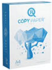
COPY PAPER CARTA PER FOTOCOPIATRICE/ STAMPANTE F500 A4