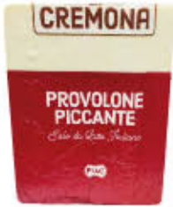
PLAC PROVOLONE TRANCIO T5 SOTTOVUOTO AL KG