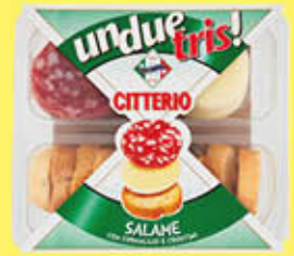
CITTERIO UNDUETRIS SALAME 100 GR