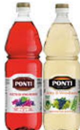
PONTI ACETO DI VINO BIANCO/ROSSO PET - 1 LITRO