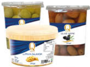
QUALITA' PIU' OLIVE VERDI/NERE/ LUPINI SECCHIELLO 250 GR