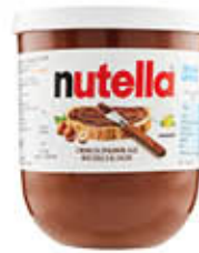
NUTELLA BIBITA 200 GR