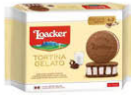
LOACKER GELATO TORTINA X4 LATTE 264 GR