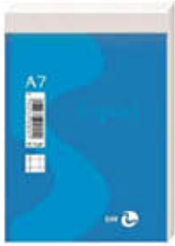
BLOC NOTES 8 X12 A7 FG.70