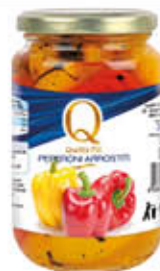
QUALITA' PIU' PEPERONI ARROSTITI 340 GR