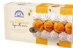
SAMMONTANA TRANCIO ST. HONORE 500 GR