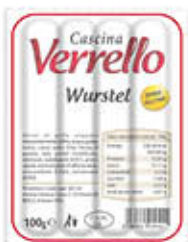
CASCINA VERRELLO WURSTEL 100 GR