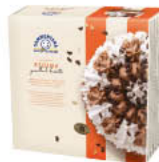
SAMMONTANA TORTA REGINA 1 KG