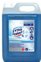
LYSOFORM PROFESSIONALE SUPERFICI 5 LITRI