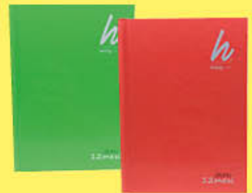
HOBBY COLOR 12MESI