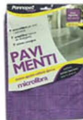
PANNOPELL PANNO PAVIMENTI MICROFIBRA 50X70