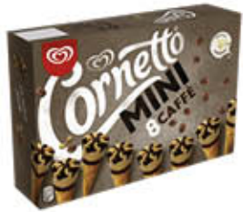
ALGIDA CORNETTI MINI CAFFÈ X 8