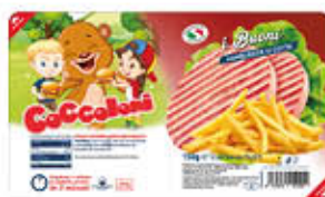
COCCOLONI HAMBURGER PROSCIUTTO COTTO 150 GR