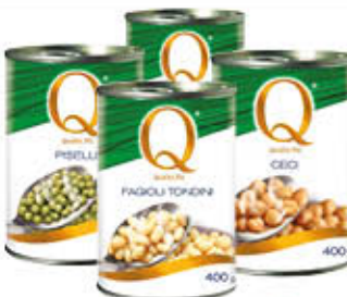
QUALITA' PIU' CECI/LENTICCHIE/ PISELLI /FAGIOLI LATTINA 400 GR