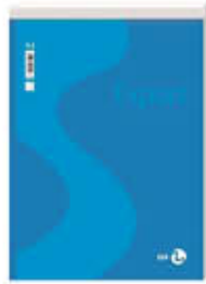
BLOC NOTES 21X29 A4 FG.60