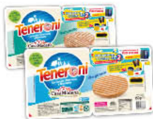
CASAMODENA TENERONI Tutti i Tipi 180/150 gr