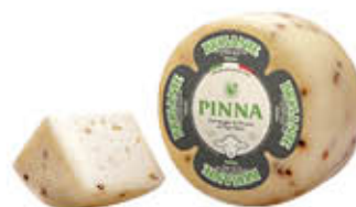
PINNA FORMAGGIO BRIGANTE AL PEPE AL KG