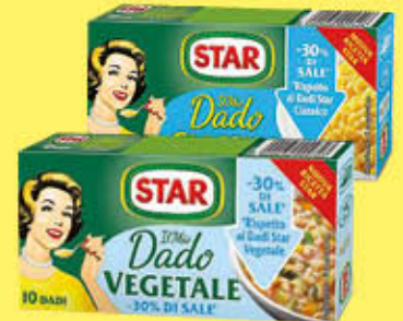
STAR DADO -30% DI SALE 10 CUBI