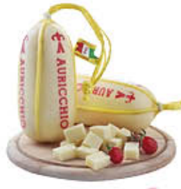
AURICCHIO PROVOLONE DOLCE GIOVANI AL KG