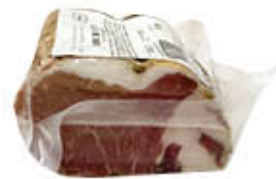
LACIS CUOR DI FILETTO 1/2 SV AL KG