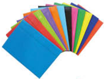
CARTELLA C/ELASTICO FLUO