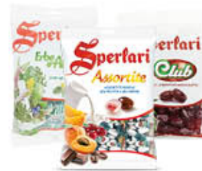
SPERLARI CAREMELLE SACCHETTI TUTTI I GUSTI 175/200 GR