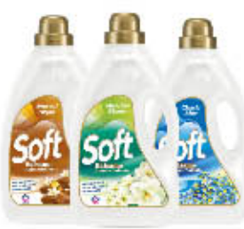
SOFT AMMORBIDENTE TUTTI I TIPI 50 LAVAGGI