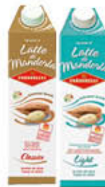
CONDORELLI LATTE DI MANDORLA CLASSICO/LIGHT 1 LITRO