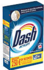
DASH PROFESSIONAL FUSTONE 79 MISURINI