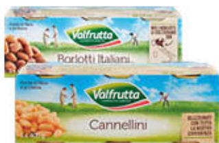
VALFRUTTA FAGIOLI CANNELLINI/ BORLOTTI/CECI LATTINA 400 GR X 3