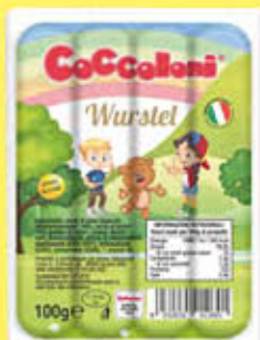
COCCOLONI WURSTEL 100 GR