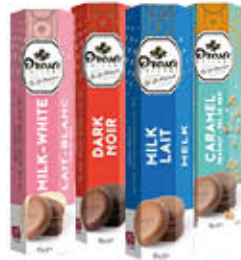
DROSTE CIOCCOLATO TUBO 85/80 GR