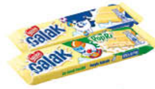
NESTLÉ GALAK 35 GR