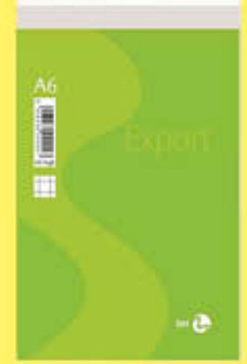
BLOC NOTES 10X15 A6 FG.60