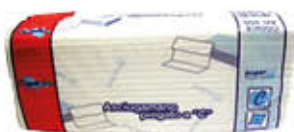
PAPERBLU ASCIUGAMANI PIEGATI A C X 150