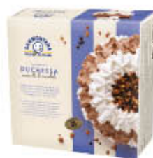
SAMMONTANA TORTA DUCHESSA 750 GR