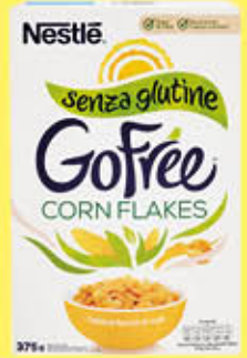
NESTLÉ CORN FLAKES SENZA GLUTINE 375 GR