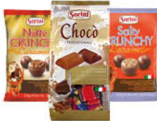
SORINI CIOCCOLATINI ASSORTITI 90/120 GR