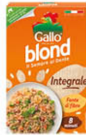
GALLO RISO BLOND INTEGRALE 500 GR