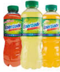
ENERGADE ARANCIA/LIMONE ARANCIA ROSSA 50 CL