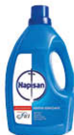
NAPISAN LIQUIDO 1,2 LITRI