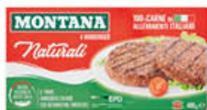
MONTANA HAMBURGER CLASSICO 400 GR