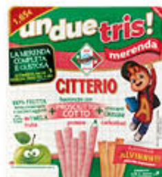
CITTERIO UNDUETRIS BASTONCINI COTTO 132 GR