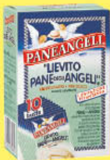
PANEANGELI 10 BUSTE