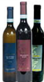
LA GUARDIENSE AGLIANICO FALANGHINA DOP CODA DI VOLPE DOC 75 CL