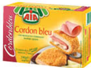
AIA CORDON BLEU 240 GR