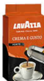
LAVAZZA CAFFÈ GUSTO FORTE 250 GR