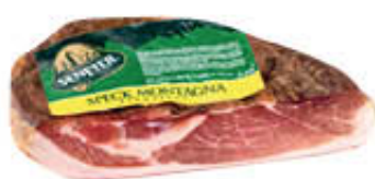
SENFTER SPECK 1/2 SV AL KG 7,99