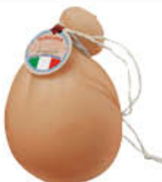
SORESINA CACIOCAVALLO AFFUMICATO AL KG