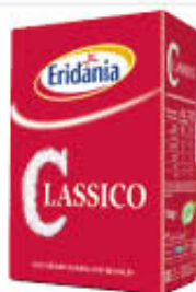
ERIDANIA ZUCCHERO CLASSICO ASTUCCIO 1 KG