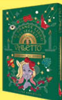
VIALETO CALENDARIO AVVENTO 240 GR