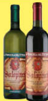
VINICOLA DEL TTERNO VINO SOLOPACA DOP 75 CL