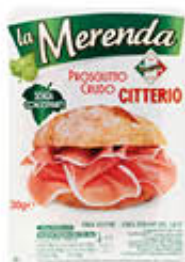
CITTERIO MERENDA PROSCIUTTO CRUDO 30 GR