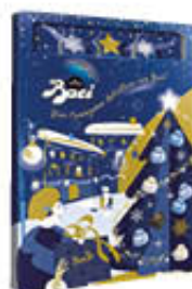
PERUGINA BACI CALENDARIO DELL'AVVENTO 300 GR