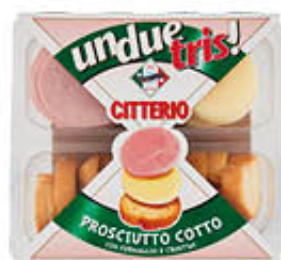
CITTERIO UNDUETRIS PROSCIUTTO COTTO 100 GR