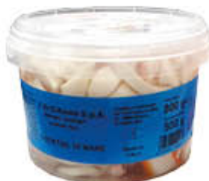
D'AVINO INSALATA DI MARE 500 GR