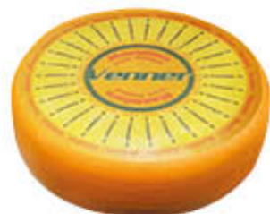
MAASDAMMER FORMA AL KG