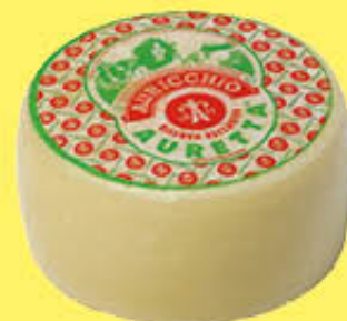
AURICCHIO AURETTA CRY T2 AL KG