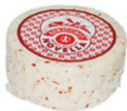
AURICCHIO CACIOTTA NOVELLA AL PEPERONCINO T2 CRY AL KG