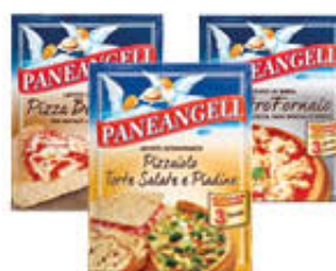
PANEANGELI MASTROFORNAIO/ PIZZAIOLO/ PIZZA ALTA 3 BUSTE