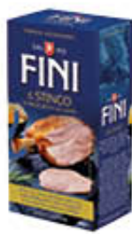
FINI STINCO DI PROSCIUTTO 600 GR