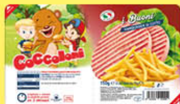
COCCOLONI HAMBURGER PROSCIUTTO COTTO 150 GR