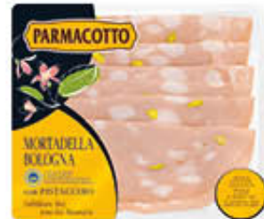
PARMACOTTO MORTADELLA BOLOGNA 120 GR