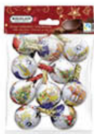
RIEGEIN PALLINE NATALE CIOCCOLATO 100 GR