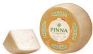
PINNA FORMAGGIO BRIGANTE SARDO AL KG