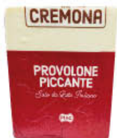
PLAC PROVOLONE TRANCIO T5 SOTTOVUOTO AL KG