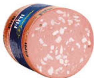
FINI MORTADELLA EMILIA CON E SENZA PISTACCHI AL KG 3,79