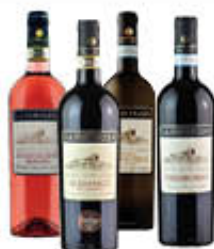
LA FORTEZZA AGLIANICO/ROSATO DOCG-FALANGHINA/ PIEDIROSSO DOC 75 CL