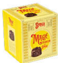
ALBERTI MAGIE STREGA ASSORTITE 200 GR