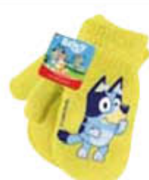
DOLFIN MUFFOLE CON CARAMELLE 65 GR