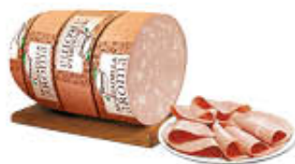
FIORUCCI MORTADELLA AROMA CON PISTACCHI AL KG 3,79