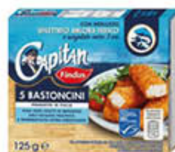
FINDUS BASTONCINI 5 PEZZI 125 GR