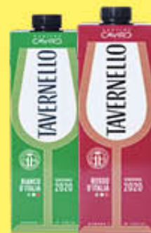
TAVERNELLO VINO BIANCO/ROSSO BRIK - 1 LITRO