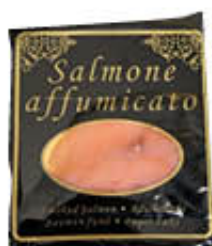
SALMONE NORVEGESE AFFUMICATO BUSTA NERA 100 GR