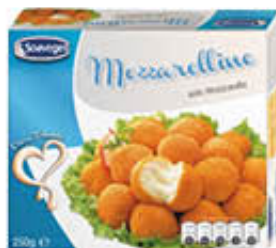
SOAVEGEL MOZZARELLINE PANATE 250 GR