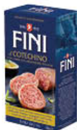
FINI COTECHINO MODENA IGP 500 GR