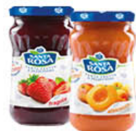
SANTA ROSA CONFETTURE CLASSICHE 350 GR