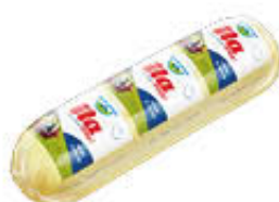
BAYERNLAND FORMAGGIO FILATO T5 SV AL KG