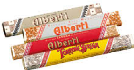
STREGA ALBERTI TORRONE T 40