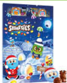
NESTLE SMARTIES CALENDARIO DELL'AVVENTO 193,90 GR