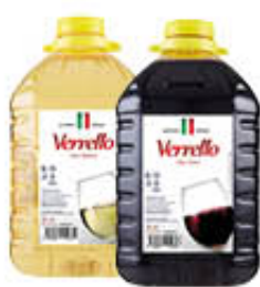
VERRELLO VINO BIANCO/ROSSO 5 LITRI