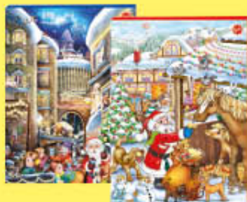
RIEGEIN CALENDARIO AVVENTO 75 GR