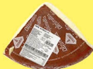
FONTAL FORMAGGIO 1/4 SV AL KG