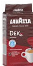
LAVAZZA CAFFÈ DEK INTENSO 250 GR