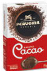
PERUGINA CACAO AMARO 75 GR