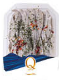
QUALITA' PIU' ALICI MARINATE PICCANTI 200 GR