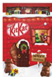
KIT KAT CALENDARIO AVVENTO 208 GR