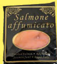
SALMONE NORVEGESE BUSTA NERA 50 GR