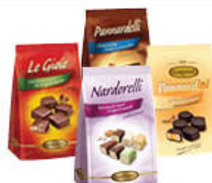
NARDONE PANNARDINI/ NARDORELLI/GIOIE/ PANNARDELLI 150 GR