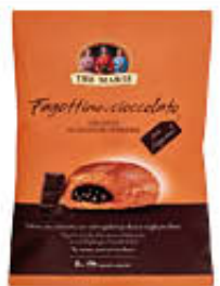
TRE MARIE FAGOTTINO CIOCCOLATO 390 GR