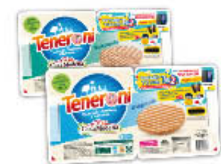
CASAMODENA TENERONI TUTTI I TIPI 180/150 GR