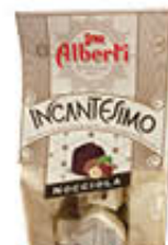
ALBERTI CIOCCOLATO INCANTESIMO 150 GR