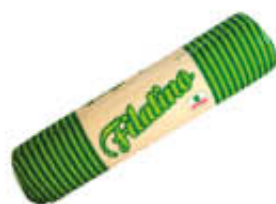
PREALPI FILATINO T5 AL KG