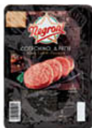
NEGRONI COTECHINO A FETTE 200 GR