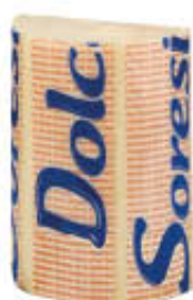
LATTERIA SORESINA PROVOLONE DOLCE TRANCIO SV AL KG