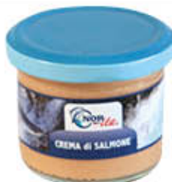
NORITA CREMA DI SALMONE 100 GR