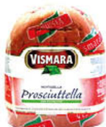
VISMARA MORTADELLA PROSCIUTTELLA 1/2 SV AL KG 5,29