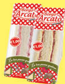
BORGIO ARCATO TRAMEZZINI FARCITI 140 GR