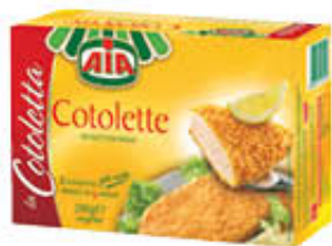
AIA COTOLETTE 280 GR