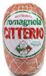
CITTERIO MORTADELLA ROMAGNOLA T15 AL KG 4,99