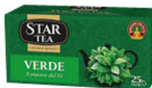
STAR TEA VERDE 25 FILTRI