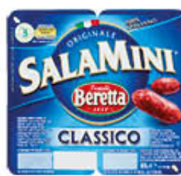
BERETTA SALAMINI CLASSICI 85 GR