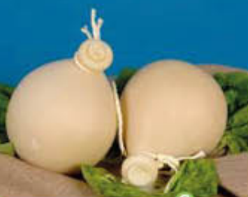
PLAC FIASCETTE T2 AL KG