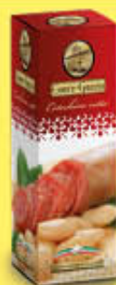
CORTE GRAZIA COTECHINO 500 GR