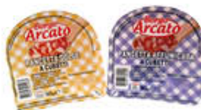
BORGIO ARCATO CUBETTI PANCETTA AFFUMICATA/DOLCE 90 GR