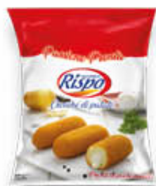
RISPO CROCCHE PROSCIUTTO E MOZZARELLA 500 GR