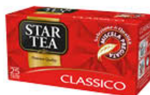
STAR TE ASTUCCIO 25 FILTRI