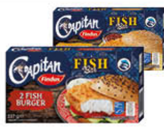
FINDUS FISH BURGER 227 GR