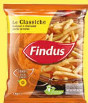
FINDUS PATATINE FRITTE PAT BON 1 KG