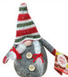
DOLFIN GNOMETTO CON MONETE 50 GR