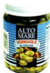
ALTO MARE VONGOLE AL NATURALE VASO - 130 GR