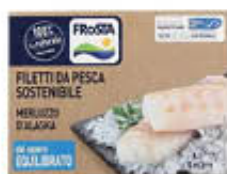
FROSTA FILETTI DI MERLUZZO 400 GR