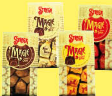
ALBERTI MAGIE STREGA TUTTI I TIPI 250 GR