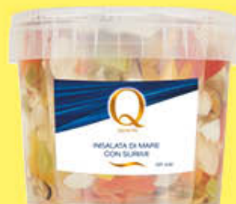
QUALITA' PIU' INSALATA DI MARE CON SURIMI SECCHELLO 500 GR