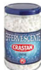
CRASTAN EFFERVESCENTE VASO VETRO 250 GR