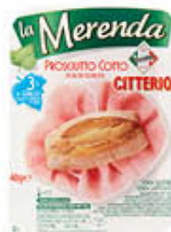
CITTERIO MERENDA PROSCIUTTO COTTO 40 GR