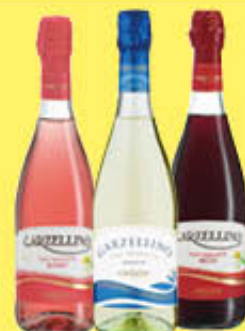
GARZELLINO VINO VARI TIPI 75 CL