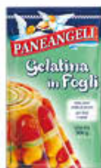
PANEANGELI GELATINA IN FOGLI 12 GR