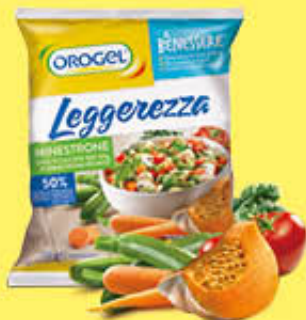
OROGEL MINISTRONE LEGGEREZZA 750 GR