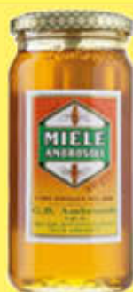
AMBROSOLI MIELE VASETTO 500 GR