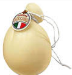
LATTERIA SORESINA CACIOCAVALLO AL KG