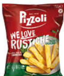
PIZZOLI PATATE WE LOVE RUSTICHE 750 GR