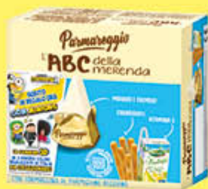
PARMAREGGIO L'ABC DELLA MERENDA CON FORMAGGINO