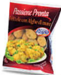
RISPO FRITTELLE ALGHE PRONTO FORNO 500 GR