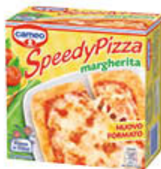
CAMEO SPEEDYPIZZA MARGHERITA X 3 225 GR