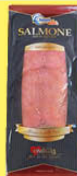
NORITA SALMONE NORVEGESE 200 GR