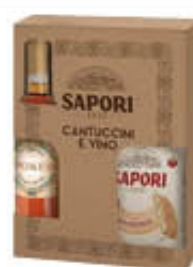
SAPORI CANTUCCINI 175 GR + VINO LIQUOROSO 375 ML