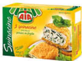
AIA SPINACINE 300 GR