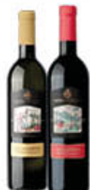
CANTINA DI SOLOPACA VINO IGP AGLIANICO/ FALANGHINA 75 CL