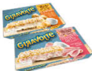
CASA MODENA GIRAVOLTE 170/150 GR