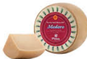
PINNA PECORINO SARDO MATURO MEDORO AL KG