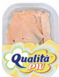
QUALITA' PIU' SALMONE MARINATO 200 GR