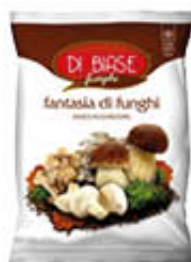
DI BIASE FANTASIA DI FUNGHI 300 GR