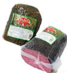
COLLELL SALAME PEPE ERBE TUNNEL AL KG 5,99