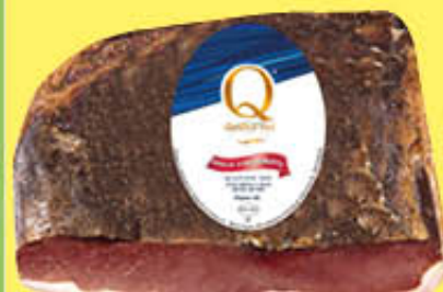
6,79 QUALITA' PIU' SPECK SELEZIONE ORO 1/2 SV AL KG