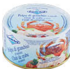
CAPITAN BYRD POLPA DI GRANCHIO 200 GR