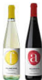
CANTINA SOLOPACA FALANGHINA E AGLIANICO FRIZZANTE 75 CL