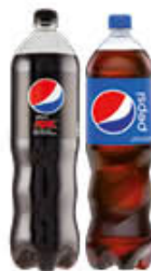
PEPSI COLA CLASSICA/MAX 1,5 LITRI