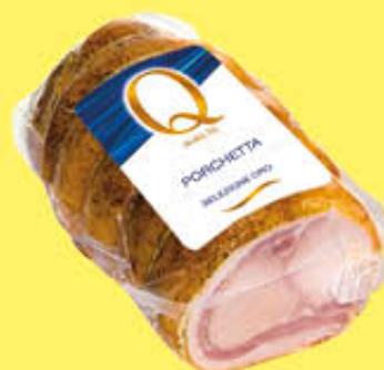
6,39 QUALITA' PIU' PORCHETTA 1/2 SV AL KG