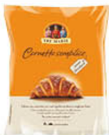
TRE MARIE 6 CORNETTI SURGELATI 330 GR