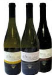
VILLA GRECI AGLIANICO/ FALANGHINA IGP CODA DI VOLPE IGT 75 CL