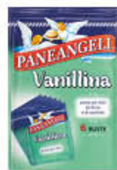
PANEANGELI VANILLINA PURA 6 BUSTE