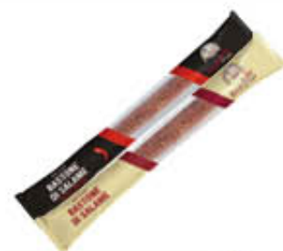
BECHER SALAME BASTONE DOLCE/PICCANTE 250 GR