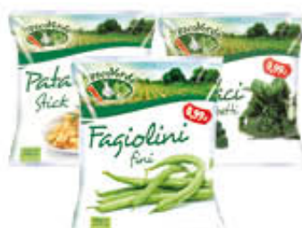
FRESCOVERDE PATATE/PISELLI SPINACI/FAGIOLINI MINISTRONE 600 GR