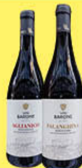
BARONE VINO AGLIANICO/ FALANGHINA IGP BN 75 CL