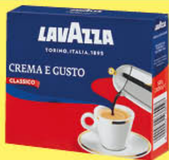
LAVAZZA CAFFÈ CREMA E GUSTO CLASSICO 250 GR X 2