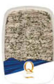
QUALITA' PIU' ALICI MARINATE CLASSICHE 170 GR