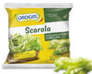
OROGEL SCAROLA CUBETTI 450 GR