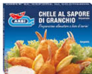
ARBI CHELE AL SAPORE DI GRANCHIO 250 GR