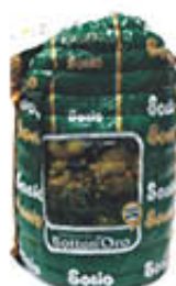
SOSIO BRESAOLA PUNTA D'ANCA 1/2 SV AL KG 20,99