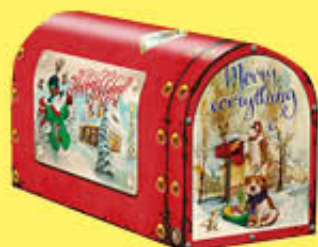
SORINI CASSETTA POSTALE CON CIOCCOLATO 300 GR