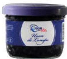
NORITA UOVA DI LOMPO NERE/ROSSE 80 GR