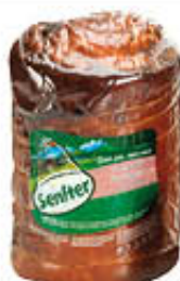
SENFTER PORCHETTA TRANCIO SV AL KG 7,49