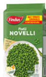
FINDUS PISELLI NOVELLI 1 KG