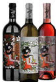
BOZZOVICH BIANCO/ROSE/ NERO 75 CL