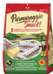
PARMAREGGIO PARMIGIANO REGGIANO SNACK 20 GR X 5