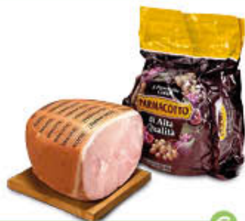
PARMACOTTO PROSCIUTTO COTTO ORIGINALE AL KG