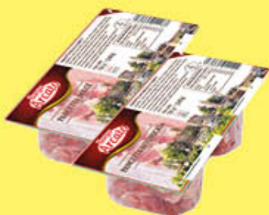
BORGIO ARCATO PANCETTA CUBETTI DOLCE/AFFUMICATA 65 GR X 2