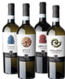
FEUDO DUCALE VINO D.O.P. AGLIANICO/ FALANGHINA/ GRECO/FIANO 75 CL