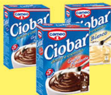
CIOBAR CLASSICO/FONDENTE/ BIANCO X 5