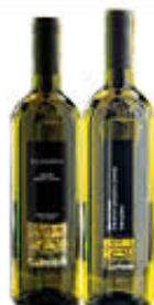
PENGUE AGLIANICO/ FALANGHINA IGP 75 CL