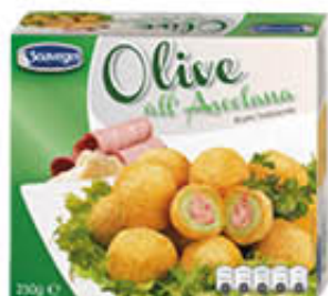
SOAVEGEL OLIVE ALL'ASCOLANA 250 GR