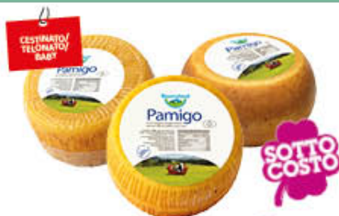
PAMIGO BAYERNLAND SV AL KG