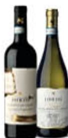
CANTINE IORIO FALANGHINA E AGLIANICO DOP 75 CL