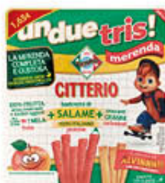
CITTERIO UNDUETRIS BASTONCINI SALAME 122 GR