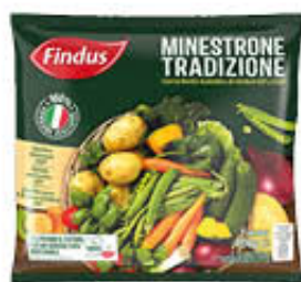
FINDUS MINISTRONE TRADIZIONE 400 GR