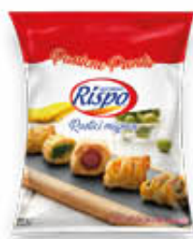
RISPO RUSTICI MIGNON ASSORTITI 500 GR