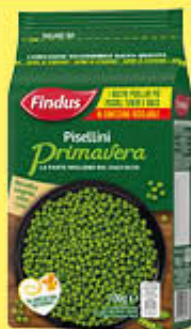
FINDUS PISELLINI PRIMAVERA 700 GR