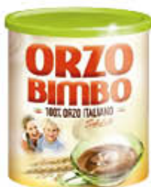
ORZO BIMBO SOLUBILE 120 GR