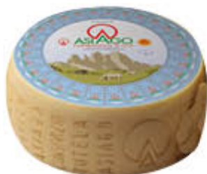
VERRELLO ASIAGO FORMA AL KG