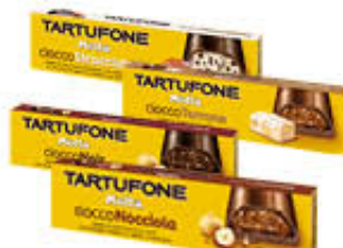
MOTTA TARTUFONE BARRA 150 GR