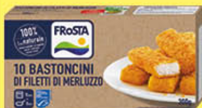
FROSTA BASTONCINI X 10 300 GR