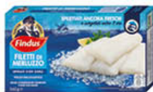
FINDUS FILETTI DI MERLUZZO 360 GR