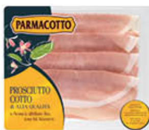
PARMACOTTO PROSCIUTTO COTTO 100 GR