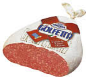
GOLFERA SALAME GOLFETTA SV AL KG 13,49