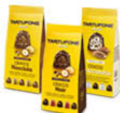
MOTTA TARTUFONE PRALINE CIOCCO NOCCIOLA/ NOIR/STRACCIATELLA