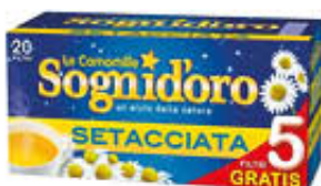
SOGNID'ORO CAMOMILLA 20 FILTRI