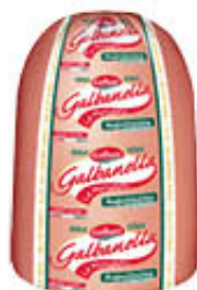
GALBANI GALBANELLA MORTADELLA AUGUSTISSIMA AL KG 5,49