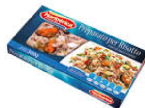
NORIBERICA PREPARATO RISOTTO 300 GR