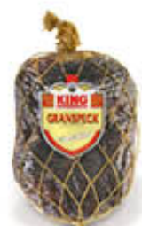
KING'S GRANSPECK AL KG 10,49