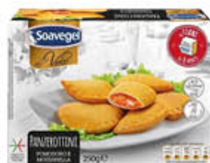
SOAVEGEL PANZEROTTINI PRONTO FORNO 250 GR