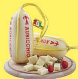
AURICCHIO PROVOLLETTE GIOVANI AL KG