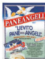
PANEANGELI LIEVITO 3 BUSTE