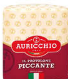
AURICCHIO PROVOLONE PICCANTE TRANCIO AL KG