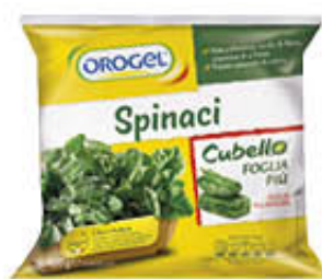
OROGEL SPINACI FOGLIA PIU' 900 GR