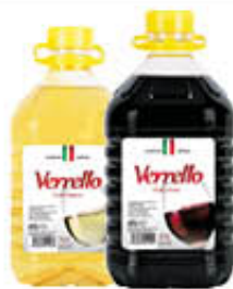
VERRELLO VINO BIANCO/ ROSSO 3 LITRI