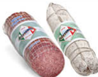
CITTERIO SALAME MILANO UNGHERESE AL KG 12,79