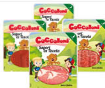
COCCOLONI TAKE AWAY SALUMI 40/50/60/70 GR