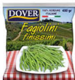
DOVER FAGIOLINI FINISSIMI 450 GR