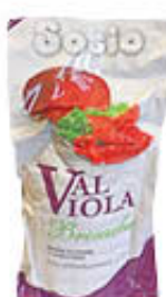
SOSIO BRESAOLA VALVIOLA 1/2 SV AL KG 19,99