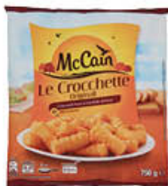
MC CAIN CROCHETTE 1 KG