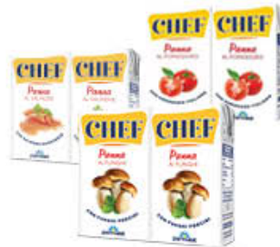
PARMALAT PANNA AGLI AROMI TUTTI I TIPI 125 GR X 2