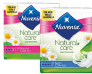
NUVENIA NATURAL CARE NORMAL/NOTTE