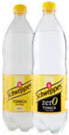
SCHWEPES TONICA CLASSICA/ZERO PET - 1 LITRO