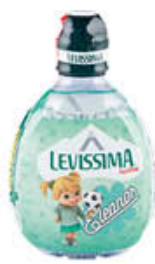
LEVISSIMA ACQUA MINERALE ISSIMA 33 CL