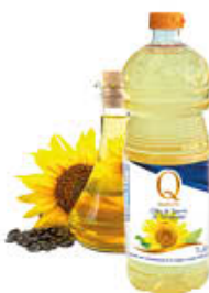
QUALITA' PIU' OLIO DI SEMI DI GIRASOLE PET 1 LITRO