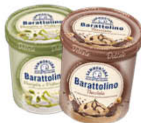
SAMMONTANA BARATTOLINO LE DELIZIE 500 GR