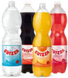
GUIZZA BEVANDE TUTTI I TIPI 1,5 LITRI