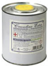
GAM CREOSOLINA EXTRA LATTINA 1 LITRO