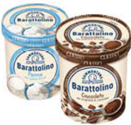
SAMMONTANA BARATTOLINO NORMALE GR 500