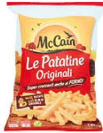
MC CAIN PATATE 1 KG