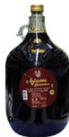
BARONE VINO AGLIANICO IGP BN 5 LITRI