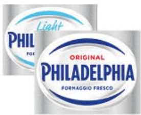
PHILADELPHIA CLASSICA/ LIGHT 80 GR