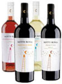
NOTTEROSSA VINI DEL SALENTO IGP 75 CL