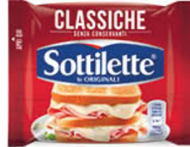
KRAFT SOTTILETTE 400 GR