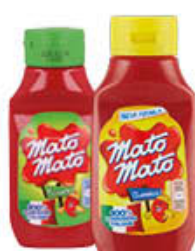
KRAFT MATO MATO SQUIS DOLCE/PICCANTE 390 GR