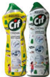
CIF CREMA TUTTI I TIPI 750 ML