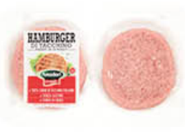
AMADORI HAMBURGER TACCHINO 80 GR X 2 STD