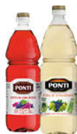
PONTI ACETO DI VINO BIANCO/ROSSO PET - 1 LITRO