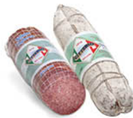
CITTERIO SALAME MILANO/ UNGERESE AL KG