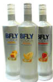
BFLY VODKA FRUTTA TUTTI I TIPI 1 LITRO