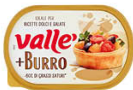
VALLE+ BURRO MARGARINA 250 GR