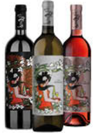
BOZZOVICH BIANCO/ROSE/ NERO 75 CL