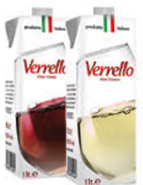
VERRELLO VINO BRIK 1 LITRO