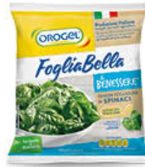
OROGEL SPINACI FOGLIA BELLA 450 GR