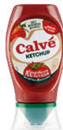
CALVE' KETCHUP SQUEEZE 250 ML