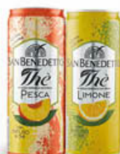
SAN BENEDETTO THE' LATTINA 33 CL