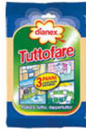
DIANEX TUTTOFARE 3 PEZZI