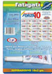
FATIGATI COLLA SUPERADESIVA FORZA 10 3 GR