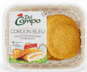
DEL CAMPO CORDON BLEU 250 GR