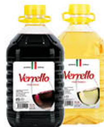
VERRELLO VINO BIANCO/ ROSSO 3 LITRI