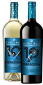
MARADONA FALANGHINA/ AGLIANICO SANNIO DOC 75 CL