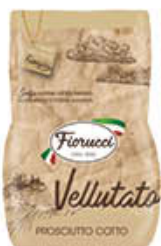
FIORUCCI PROSCIUTTO COTTO VELLUTATO BAULETTO AL KG