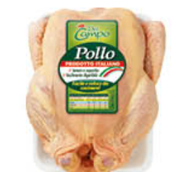
DEL CAMPO POLLO A BUSTO AL KG