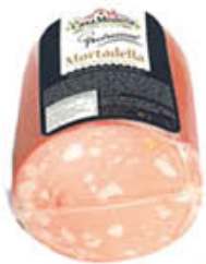
CASAMODENA MORTADELLA CON PISTACCHIO T3 AL KG