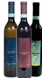
LA GUARDIENSE AGLIANICO FALANGHINA DOP CODA DI VOLPE DOC 75 CL