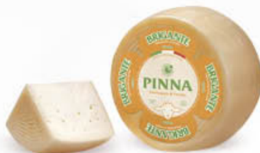
PINNA FORMAGGIO BRIGANTE SARDO AL KG