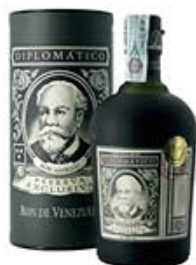
DIPLOMATICO RUM RISERVA ESCLUSIVA 70 CL