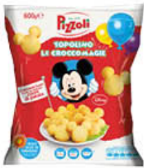
PIZZOLI CROCCOMAGIE TOPOLINO 600 GR