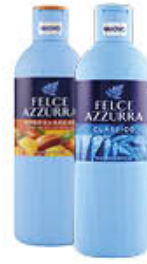
FELCE AZZURRA BAGNOSCHIUMA TUTTI I TIPI 650 ML