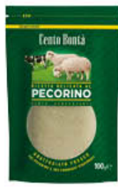
BIRAGHI RICETTA AL PECORINO GRATTUGIATO 100 GR