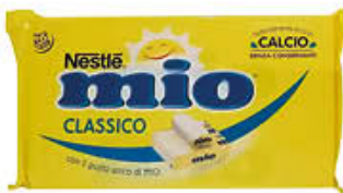
NESTLE' FORMAGGINO MIO 125 GR