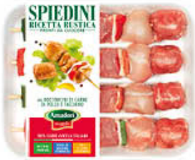
AMADORI SPIEDINO RUSTICO MAXI AL KG