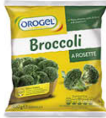
OROGEL BROCCOLI ROSETTE 400 GR