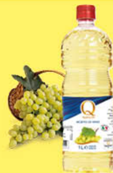
QUALITA' PIU' ACETO BIANCO PET 1 LITRO