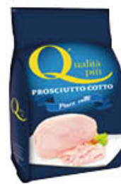
QUALITÀ PIÙ PROSCIUTTO COTTO PIACE COTTO AL KG