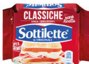
KRAFT SOTTILETTE 200 GR