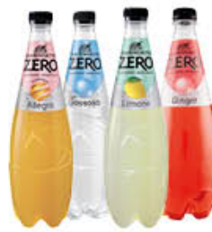
SANBENEDETTO BIBITE ZERO 75 CL