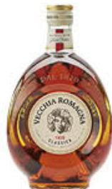
VECCHIA ROMAGNA ETICHETTA CLASSICA 70 CL