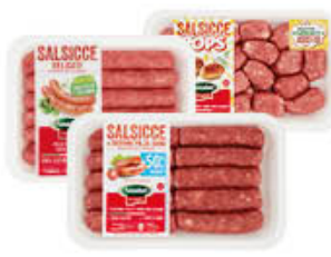
AMADORI SALSICCIA - 50%GRASSI/ DELICATA/POPS 360/400 GR