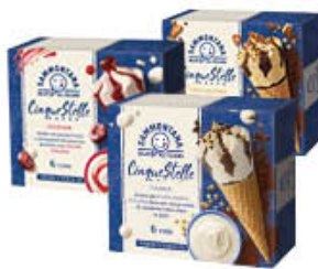
SAMMONTANA CONO 5 STELLE TUTTI I TIPI X 6