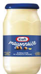
KRAFT MAYONNAISE 490/465 GR