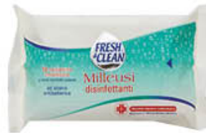
FRESH E CLEAN SALVIETTE POCKET DISINFETTANTI X 12