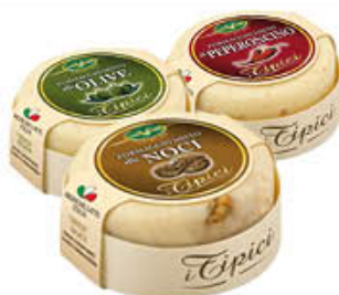
TREVALLI FORMAGGIO MISTO OLIVE/NOCI/ PEPERONCINO 180 GR