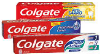
COLGATE DENTIFRICI BASE 75 ML