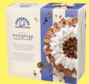
SAMMONTANA TORTA DUCHESSA 750 GR