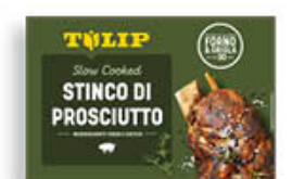
TULIP STINCO DI SUINO COTTO 600 GR