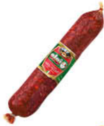
CLAI SALAME NAPOLI PICCANTE SV AL KG