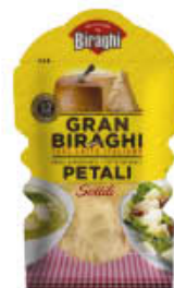
GRANBIRAGHI PETALI SOTTILI 80 GR