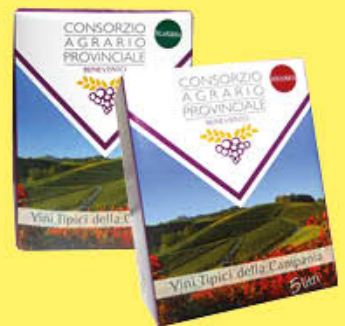
CONSORZIO AGRARIO BENEVENTO VINO AGLIANICO/ FALANGHINA BAG IN BOX - 5 LITRI