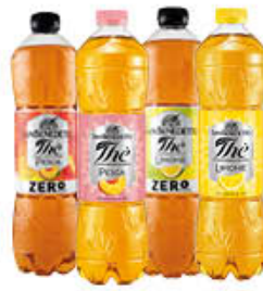
SAN BENEDETTO THE CLASSICO/ZERO 1,5 LITRI