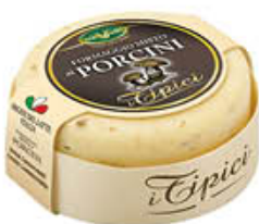
TREVALLI CACIOTTA MISTA FUNGHI PORCINI 180 GR