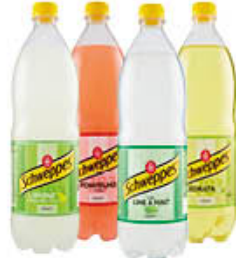
SCHWEPES ALLA FRUTTA TUTTI I TIPI PET - 1 LITRO