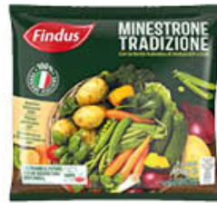
FINDUS MINISTRONE TRADIZIONE 400 GR