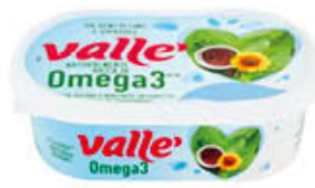
VALLE OMEGA3 MARGARINA 250 GR