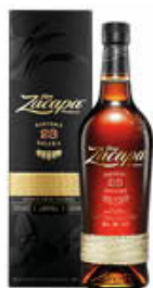
RON ZACAPA SOLERA GRAN RESERVA 23 ANNI - 70 CL