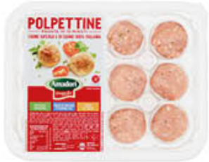
AMADORI POLPETTINE 240 GR