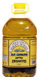
DESANTIS OLIO EXTRAVERGINE SAN GIOVANNI 5 LITRI