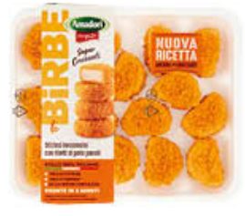
AMADORI BIRBE DI POLLO 300 GR