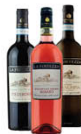
LA FORTEZZA ROSATO DOCG-FALANGHINA/ PIEDIROSSO DOC 75 CL