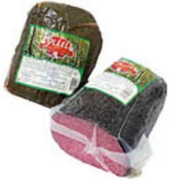
COLLELLI SALAME PEPE/ ERBE TUNNEL AL KG