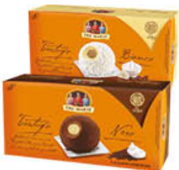
TRE MARIE DESSERT TARTUFO BIANCO/NERO