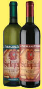
VINICOLA DEL TITERNO VINO SOLOPACA DOP 75 CL