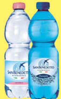
SAN BENEDETTO ACQUA NATURALE/FRIZZANTE 50 CL