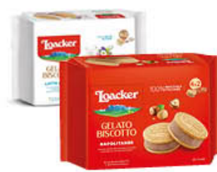
LOACKER GELATO BISCOTTO LATTE/NAPOLITANER 264 GR X 4