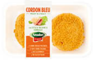
AMADORI CORDON BLEU PROSCIUTTO E FORMAGGIO 250 GR