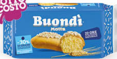
MOTTA BUONDI CLASSICO 6 PEZZI