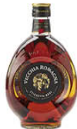
VECCHIA ROMAGNA ETICHETTA NERA 1 LITRO