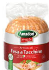
AMADORI GRANROSTY FESA DI TACCHINO AL KG