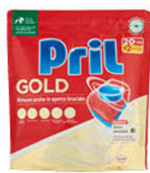
PRIL GOLD 20+2 TABS