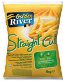
GOLDEN RIVER PATATE 1 KG