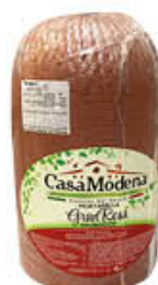
CASA MODENA MORTADELLA GRAN ROSA 1/2 AL KG