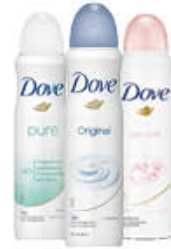
DOVE DEODORANTE SPRAY TUTTI I TIPI 150 ML