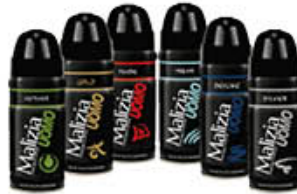
MALIZIA DEODORANTI UOMO TUTTE LE PROFUMAZIONI 150 ML