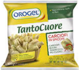
OROGEL CUORI CARCIOFI SPICCHI 300 GR