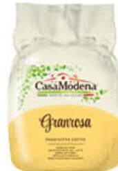
CASA MODENA PROSCIUTTO COTTO GRANROSA AL KG