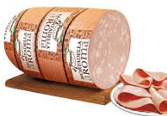
FIORUCCI MORTADELLA AROMA CON PISTACCHI AL KG