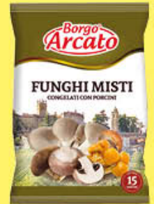
BORGO ARCATO FUNGHI MISTO PORCINI 450 GR