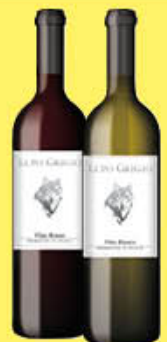
LUOPGRIGIO VINO DA TAVOLA 75 CL