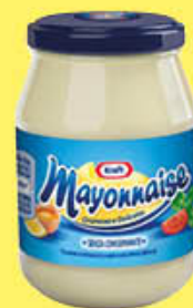
KRAFT MAYONNAISE VASO 175 GR