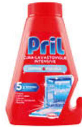
PRIL CURA LAVASTOVIGLIE 250 ML