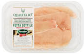
AMADORI PETTO POLLO FETTE SOTTILI 250 GR