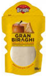
GRANBIRAGHI GRATTUGIATO 100 GR