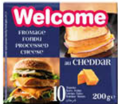
WELCOME FORMAGGIO FETTINE CHEDDAR 200 GR