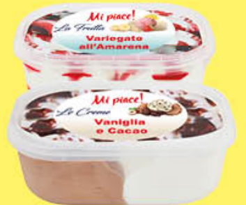
MI PIACE VASCHETTA GELATO 1 KG