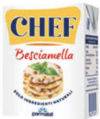
PARMALAT BESCIAMELLA CHEF 200 ML