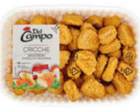
DEL CAMPO CRICCHE POLLO 230 GR