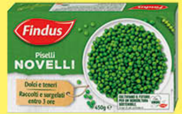
FINDUS PISELLI NOVELLI 450 GR