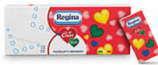
REGINA FAZZOLETTI REGINA DI CUORI X 10