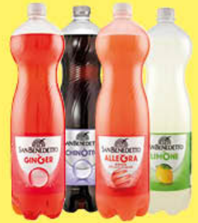
SAN BENEDETTO BIBITE TUTTI I TIPI 1,5 LITRI