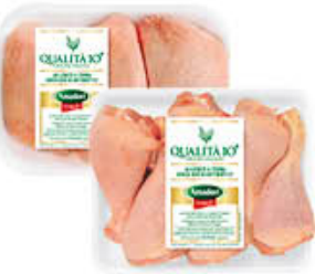
AMADORI FUSI DI POLLO/ SOVRACOSCE MAXI AF10+ AL KG