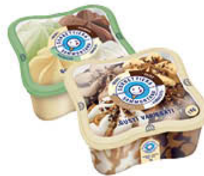
SAMMONTANA SORBETTIERA 1 KG