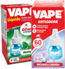
VAPE RICARICA LIQUIDA 60 NOTTI