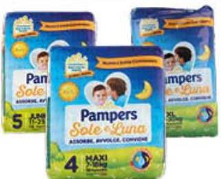
PAMPERS SOLE E LUNA PANNOLINI TUTTE LE MISURE