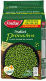
FINDUS PISELLINI PRIMAVERA 700 GR