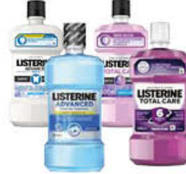
LISTERINE COLLUTORIO 500 ML