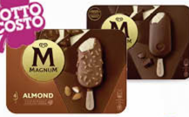
ALGIDA MAGNUM CLASSICO/BIANCO/ MANDORLE X 4