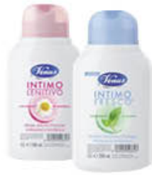
VENUS IGIENE INTIMA 200 ML