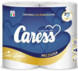
CARESS CARTA IGIENICA PREZIOSA 4 ROTOLI 3 VELI