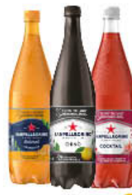
SAN PELLEGRINO BIBITE PET 1,20 LT