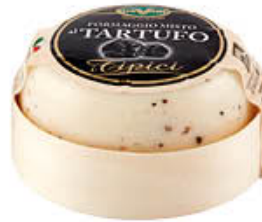
TREVALLI CACIOTTA MISTA TARTUFO 180 GR