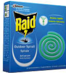
RAID SPIRALE ANTIZANZARE 10 PEZZI