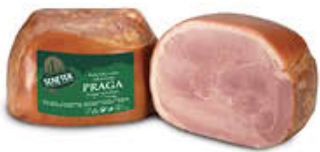
SENFTER PROSCIUTTO COTTO PRAGA 1/2SV AL KG