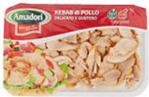
AMADORI KEBAB POLLO FETTE 280 GR