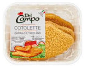
DEL CAMPO COTOLETTA POLLO 220 GR