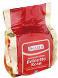
GASSER PROSCIUTTO COTTO BELCOTTO ROSA AL KG