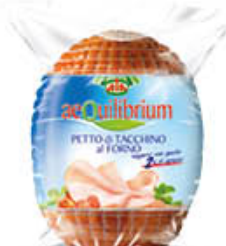
AEQUILIBRIUM PETTO TACCHINO ARROSTO MASCHIO AL KG