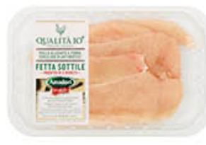
AMADORI PETTO POLLO FETTE SOTTILI 250 GR