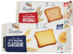
GENTILINI FETTE BISCOTTATE CLASSICHE/ INTEGRALI 175/185 GR