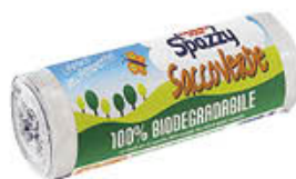
SPAZZY SACCOVERDE BIODEGRADABILE 15 PEZZI 20 LITRI