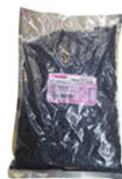
BARRA GOCCE DI CIOCCOLATO 1 KG