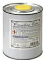
GAM CREOSOLINA EXTRA LATTINA 1 LITRO