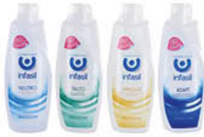
INFASIL BAGNOSCHIUMA TUTTI I TIPI 500 ML