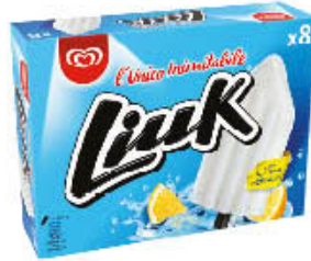
LIUK X 8