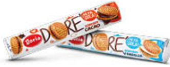
DORICREM TUBO 150 GR