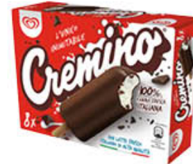
ALGIDA CREMINO 8 PEZZI CLASSICO 336 GR