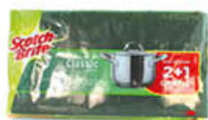
SCOTCH-BRITE SPUGNA+ABRASIVO 3 PEZZI