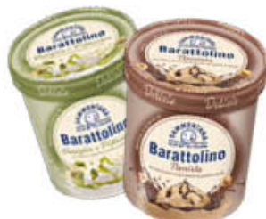
SAMMONTANA BARATTOLINO LE DELIZIE 500 GR