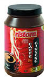
RISTORA CAFFÈ & GINSENG 1 KG