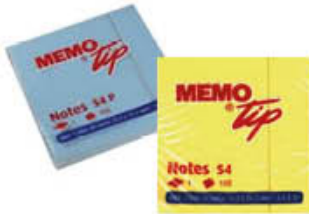
MEMO TIP 76x76 100 FOGLI