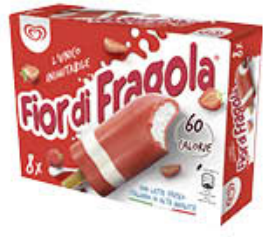
ALGIDA FIOR DI FRAGOLA X 8