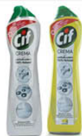
CIF CREMA 500 ML