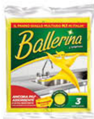
PANNO BALLERINA ORIGINALE 3 PZ