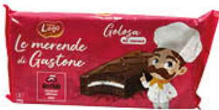
LAGO GOLOSA AL CACAO 195 GR