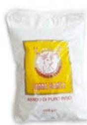
AMIDERIA IL CERVO ZANNA BIANCA AMIDO DI RISO 1 KG