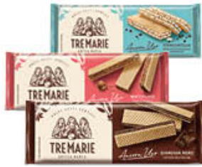
TRE MARIE WAFER 175/140 GR