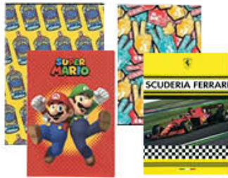
QUADERNI MAXI VARI FORMATI