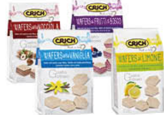
CRICH WAFERS SACCHETTO 250 GR