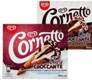
ALGIDA CORNETTO CUORE CROCCANTE CIOCCOLATO/BIANCO X 6