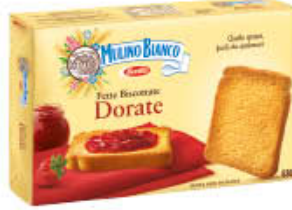
MULINO BIANCO FETTE BISCOTTATE DORATE 630 GR