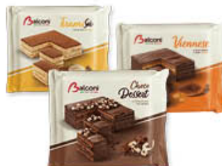
BALCONI TORTE TIRAMISÙ/WIENNESE CHOCOdessert 400 GR