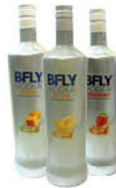
BFLY VODKA FRUTTA TUTTI I TIPI 1 LITRO