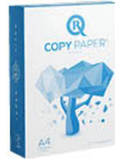
COPY PAPER CARTA PER FOTOCOPIATRICE/ STAMPANTE F500 A4