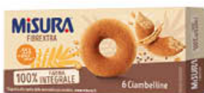
MISURA CIAMBELLINE INTEGRALI 230 GR