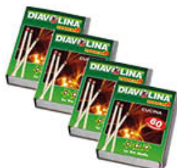
DIAVOLINA FIAMMIFERI CUCINA F60