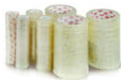
NASTRO ADESIVO 15X33 COMET