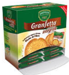
SAN SEPOLCRO BIFETTE DORATE/INTEGRALI 16X2