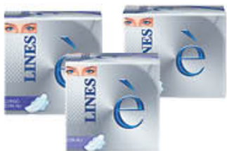
LINES SETA E TUTTI I TIPI X 7/8