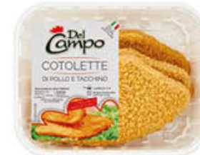
DEL CAMPO COTOLETTE POLLO 220 GR