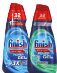
FINISH GEL TUTTO IN 1 LEMON/REGULAR 600 ML