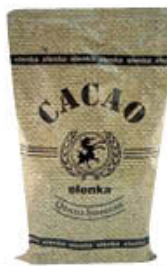
ELENKA CACAO AMARO 1 KG