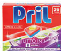
PRIL TABS ALL IN ONE X 26