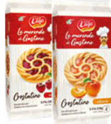
LAGO CROSTATINA ALBICOCCA/CILIEGIA 6 PEZZI