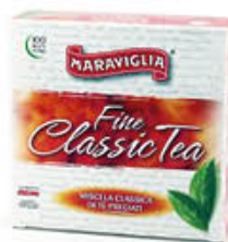
RISTORA TE MARAVIGLIA 100 FILTRI