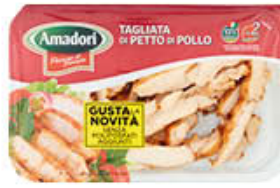
AMADORI TAGLIATA DI POLLO 280 GR