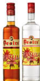
DESIRE' RHUMA FANTASIA BIANCA/SCURA 1 LITRO