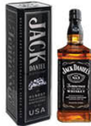
JACK DANIEL'S WHISKY 70 CL