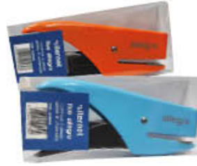
CUCITRICE A PINZA