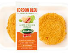
AMADORI CORDON BLEU PROSCIUTTO E FORMAGGIO 250 GR