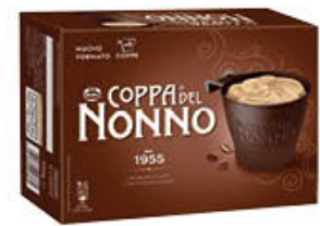
MOTTA COPPA DEL NONNO X 6