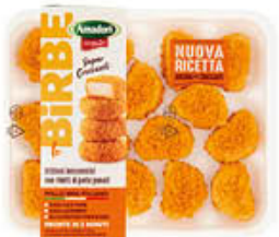
AMADORI BIRBE DI POLLO 300 GR