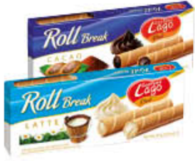
LAGO ROLL BREAK LATTE/CACAO 80 GR