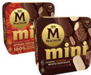
MAGNUM MINI X 6