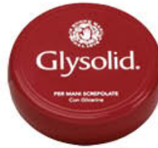
GLYSOLID SCATOLA 100 ML