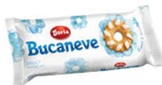
DORIA BISCOTTI BUCANEVE 28 GR