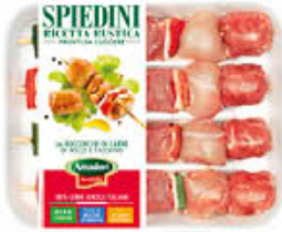
AMADORI SPIEDINO RUSTICO MAXI AL KG