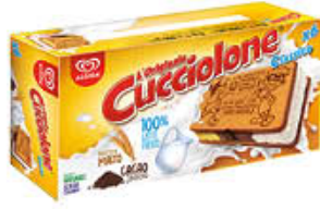
ALGIDA CUCCIOLONE CLASSICO X 6 480 GR