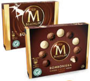
MAGNUM BOMBONIERA CLASSICA/CAW X 12