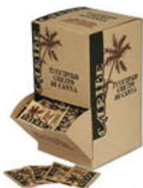
RISTORA ZUCCHERO DI CANINA 150 BUSTINE