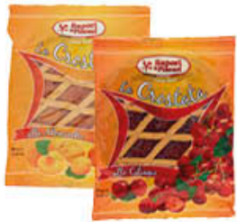
SAPORI & PIACERI CROSTATE 350 GR