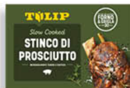
TULIP STINCO DI SUINO COTTO 600 GR