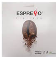
ESPRESSO 100 CIALDE CAFFÈ SUBLIME