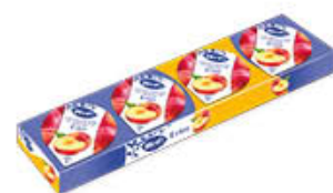
HERO CONFETTURE MONO 25 GR X 4 ESCLUSO MIELE/FRUTTI DI BOSCO/MIRTILLO