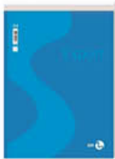
BLOC NOTES 21X29 A4 FG.60