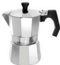
CAFFETTIERA MOKA BARONETTA 3 TAZZE