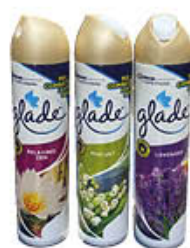
GLADE DEODORANTE PER AMBIENTE SPRAY MIX "E LIMITED" 300 ML