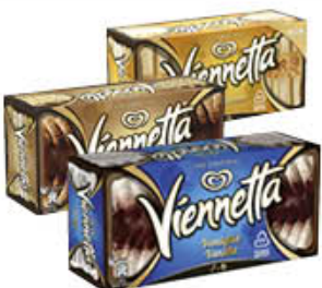
ALGIDA VIENNETTA VANIGLIA/ CAPPUCCINO/ CARAMELLO SALATO 320 GR