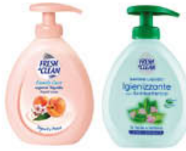
FRESH & CLEAN SAPONE LIQUIDO 300 ML