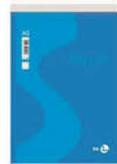
BLOC NOTES 15X21 A5 FG.60