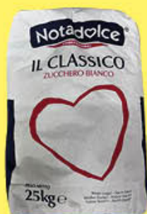
NOTADOLCE ZUCCHERO IN SACCHI DA 25 AL KG