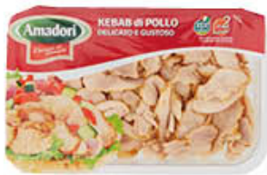
AMADORI KEBAB POLLO FETTE 280 GR