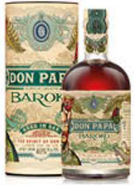
DON PAPA RUM BAROKO ASTUCCIO 70 CL