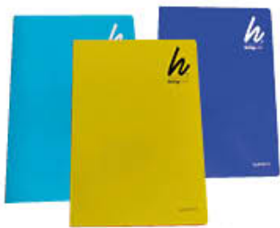
QUADERNONI 20 FOGLI+1 80 GR