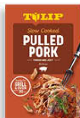
TULIP PULLED PORK 550 GR