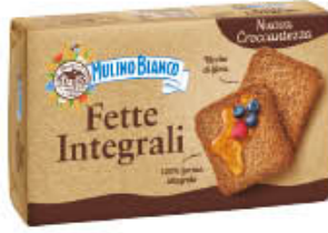
MULINO BIANCO FETTE BISCOTTATE LE INTEGRALI 630 GR