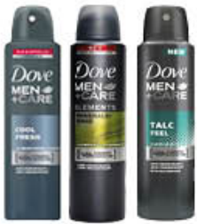
DOVE DEODORANTE MEN SPRAY 150 ML