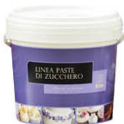
IRCA PASTA DI ZUCCHERO MODELLABILE DAMA - 5 KG