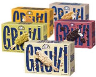
SAMMONTANA STECCHO GRUVI X 4