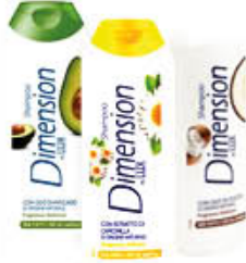
DIMENSION BY LUX SHAMPOO E 2 IN 1 TUTTI I TIPI 250 ML