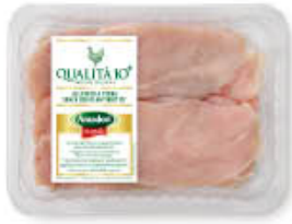
AMADORI PETTO POLLO FETTE 400 GR