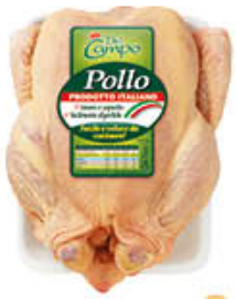
DEL CAMPO POLLO A BUSTO AL KG