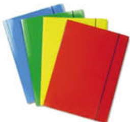
CARTELLA C/ELASTICO X3