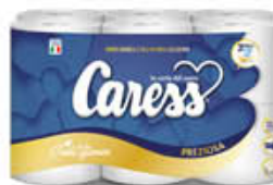
CARESS CARTA IGIENICA PREZIOSA 12 ROTOLI 3 VELI