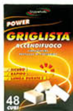
IL GRIGLISTA ACCENDIFUOCO X 48