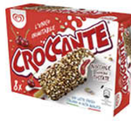
ALGIDA CROCCANTE AMARENA X 8 464 GR