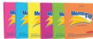
POST IT MM. 76X51 100FOGLI