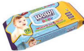
WOW SALVIETTE BIMBI POP-UP X 72