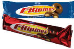
FILIPINOS DARK/WHITE E LATTE 128 GR