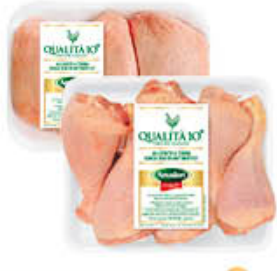
AMADORI FUSI DI POLLO/ SOVRACOSCE MAXI AF10+ AL KG