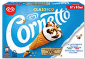
ALGIDA CORNETTO CLASSICO X 8