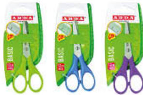
ARDA BLISTER FORBICI BASIC 12CM