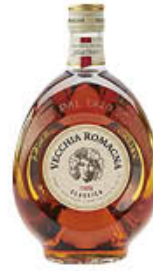
VECCHIA ROMAGNA ETICHETTA CLASSICA 70 CL