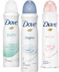
DOVE DEODORANTE SPRAY TUTTI I TIPI 125 ML