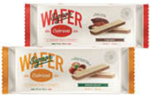
CABRIONI WAFER PIU' CACAO/NOCCIOLA VANIGLIA 150 GR