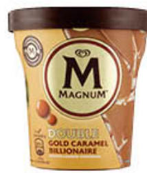
ALGIDA MAGNUM SECCHIELLO BILLIONAIRE 303 GR