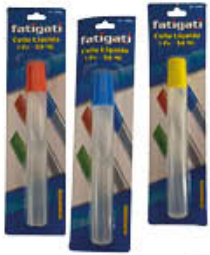
FATIGATI COLLA LIQUIDA 50 ML