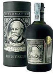
DIPLOMATICO RUM RISERVA ESCLUSIVA 70 CL