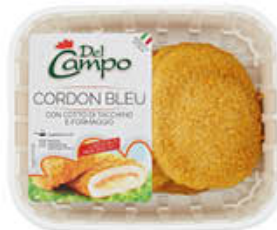
DEL CAMPO CORDON BLEU 250 GR