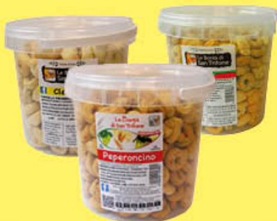
SAN TRIFONE TARALLI SECCHELLO TUTTI I TIPI 900 GR