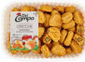
DEL CAMPO CRICCHE POLLO 230 GR