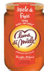
LUNA DI MIELE MIELE DI FIORI 1 KG