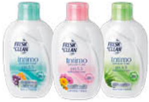
FRESH & CLEAN INTIMO 200 ML