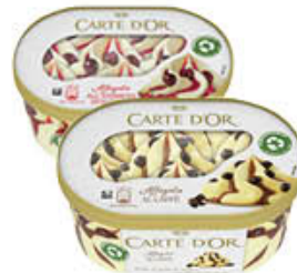
CARTE D'OR AFFOGATI TUTTI I TIPI 500 GR