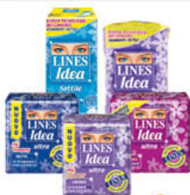
LINES IDEA ULTRA E SOTTILE TUTTI I TIPI