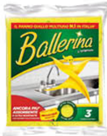
PANNO BALLERINA ORIGINALE 3 PZ