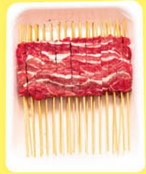
INALCA ARROSTICINI MISTI SFIZIOSI AL KG