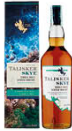
WHISKY TALISKER SKY CL70