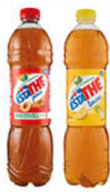
ESATHE THE' CLASSICO LIMONE/PESCA 1,5 LITRI