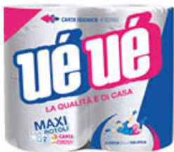
UÉUÉ CARTA IGIENICA T240 4 ROTOLI