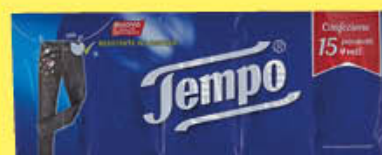
TEMPO FAZZOLETTI 15 PEZZI