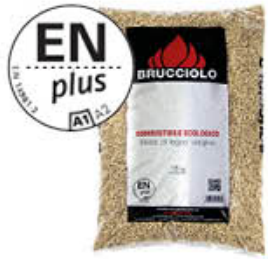
BRUCIOLO PELLET EN PLUS A1 15 KG