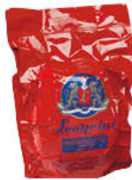
LEONCINI PROSCIUTTO COTTO TIROLO AL KG