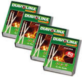
DIAVOLINA FIAMMIFERI CUCINA F60