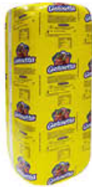
BEHELLI SPALLA COTTA TOAST GUSTOSETTA AL KG