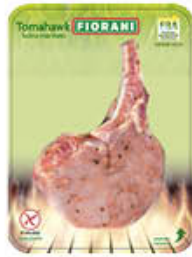
INALCA TOMAHAWK DI SUINO MARINATA T390 - AL KG