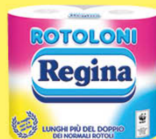
REGINA ROTONONI CARTA IGIENICA X 4