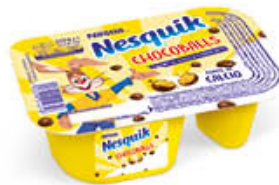
NESTLÉ NESQUIK CHOCOBALLS 120 GR