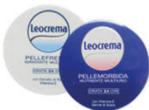
LEOCREMA PELLEFRESCA PELLEMBORBITA 150 ML