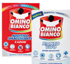
OMINO BIANCO POLVERE BIANCOVIVO/ADDITIVO SMACCHIANTE