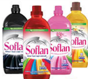
SOFLAN 1 LITRO