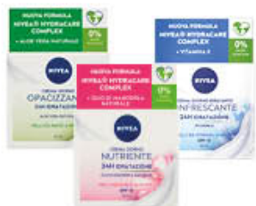
NIVEA VISO CREMA RINFRESCANTE/ OPACIZZANTE/ NUTRIENTE 50 ML