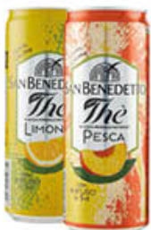
SAN BENEDETTO THE LATTINA 33 CL