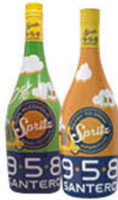
SANTERO APERITIVO SPRITZ ALCOLICO/ANALCOLICO 75 CL