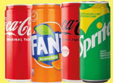
FANTA/SPRITE/ COCA COLA CLASSICA/ZERO LATTINA 33 CL