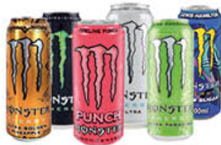
MONSTER 51 CL