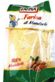
FATINA FARINA MANDORLE 200 GR