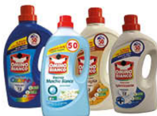
OMINO BIANCO DETERSIVO LAVATRICE TUTTI I TIPI 50 LAVAGGI