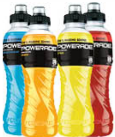
POWERADE 50 CL