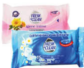
FRESH & CLEAN SALVIETTE POCKET TUTTI TIPI X12/15/18