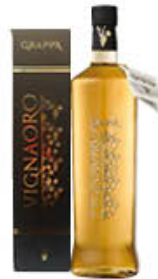
DESIRE GRAPPA VIGNAIORO SCURA 70 CL