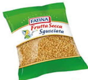
FATINA GRANELLA NOCCIOLE 100 GR