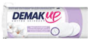
DEMAK UP ORIGINAL X 60