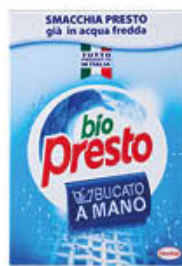
BIOPRESTO A MANO 600 GR