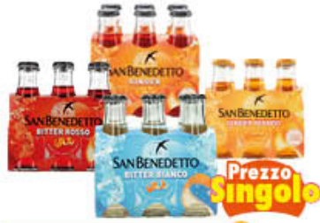
SAN BENEDETTO BITTER BIANCO/ ROSSO GINGER CLASSICO/BIONDO 10 CL