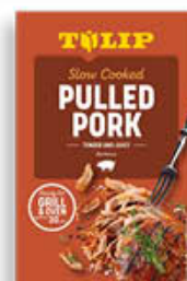
TULIP PULLED PORK 550 GR