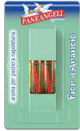
PANEANGELI FIOR D' ARANCIO PER PASTIERA X 2