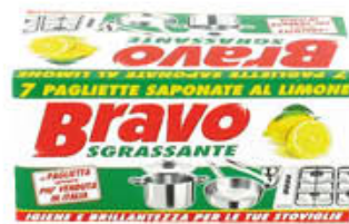
BRAVO SGRASSANTE 7 PAGLIETTE CON SAPONE