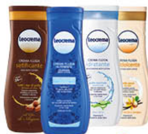
LEOCREMA FLUIDA 250 ML