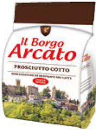
BORG ARCATO PROSCIUTTO COTTO AL KG