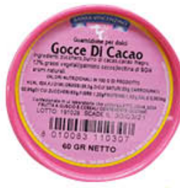
BARRA GOCCE DI CIOCCOLATO 60 GR