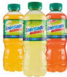
ENERGADE ARANCIA/LIMONE/ ARANCIA ROSSA 50 CL