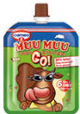
MUU MUU GO CIOCCO-VANIGLIA 80 GR