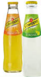
SCHWEPES ARANCIA/ LIMONE 18 CL