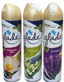
GLADE DEODORANTE PER AMBIENTE SPRAY MIX "E LIMITED" 300 ML