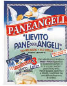
PANEANGELI LIEVITO 3 BUSTE 48 GR