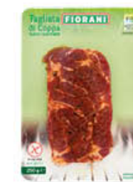
INALCA TAGLIATA COPPA SUINO MARINATA 250 GR