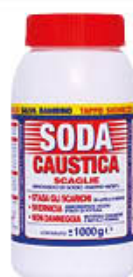
SODA CAUSTICA SCAGLIE BARATTOLO 1 KG