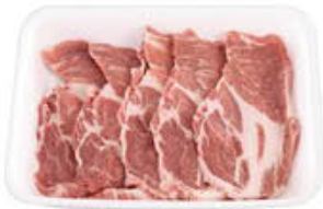
INALCA CAPOCOLLO SUINO AL KG