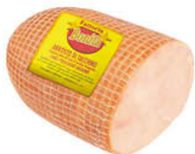
AMADORI BONITA ARROSTO DI TACCHINO AL KG