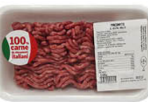
INALCA MACINATO BOVINO ADULTO ATM 400 GR