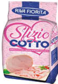
RIVAFIORITA SFZIOCOTTO AL KG