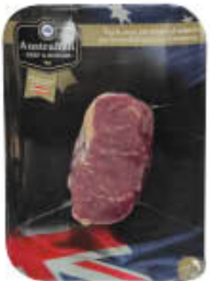
INALCA TAGLIATA BOVINO ADULTO AUSTRALIA AL KG