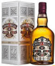
CHIVAS WHISKY 12 ANNI 70 CL