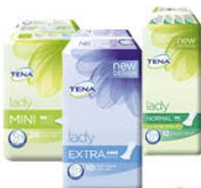
TENA LADY ASSORBENTI MINI/NORMAL EXTRA