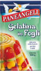
PANEANGELI GELATINA IN FOGLI 12 GR