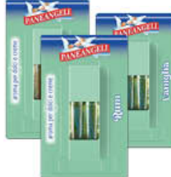
PANEANGELI AROMI PER DOLCI/ CREME - 4 ML