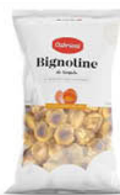
CABRIONI BIGNOLINE 100 GR