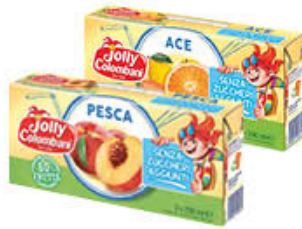
JOLLY COLOMBANI SUCCHI DI FRUTTA S/ZUCCHERI AGGIUNTI 200 ML X 3