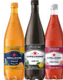
SAN PELLEGRINO BIBITE PET 1,20 LT