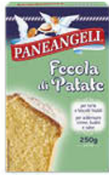
PANEANGELI FECOLA DI PATATE 250 GR