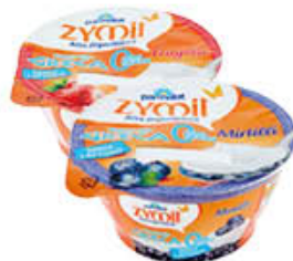
ZYMIL YOGURT ALLA GRECA VARI GUSTI 150 GR