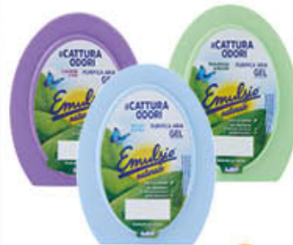
EMULSIO CATTURA ODORI GEL 150 GR