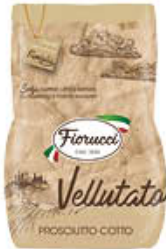
FIORUCCI PROSCIUTTO COTTO VELLUTATO BAULETTO AL KG