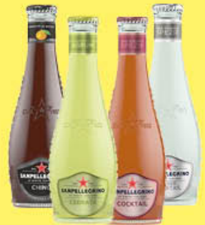
SAN PELLEGRINO BIBITE VETRO TUTTI I TIPI 20 CL