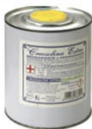
GAM CRESOSOLINA EXTRA LATTINA 1 LITRO