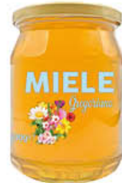
GREGORIANO MIELE VV 450 GR