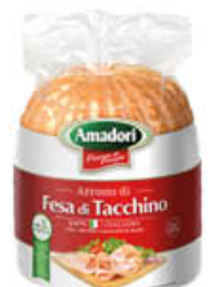
AMADORI GRANROSTY FESA DI TACCHINO AL KG