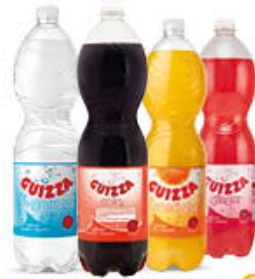
GUIZZA BEVANDE TUTTI I TIPI 1,5 LITRI