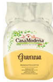
CASA MODENA PROSCIUTTO COTTO GRANROSA AL KG