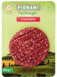
INALCA HAMBURGER CHIANINA 200 GR