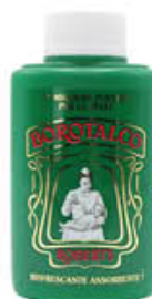
ROBERTS BOROTALCO BARATTOLO DA VIAGGIO 100 GR