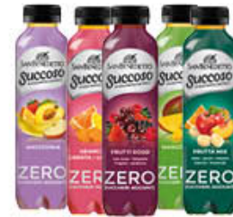
SAN BENEDETTO SUCCOSO ZERO 40 CL