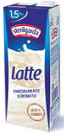
STERILGARDA LATTE PS BRIKI 1,5 LITRI