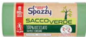
SPAZZY SACCO VERDE 70 X 105 110 LITRI X 10