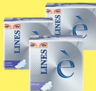
LINES SETA E TUTTI I TIPI X 7/8