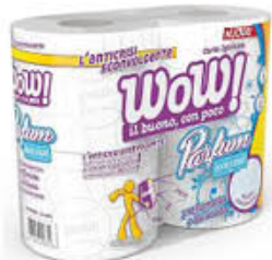
WOW CARTA IGIENICA PROFUMATA 4 MAXI ROTOLI 2 VELI