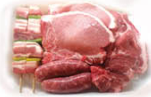
INALCA GRIGLIATA MISTA SUINO AL KILO