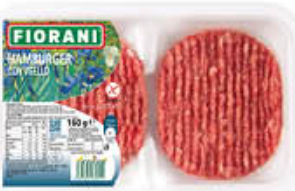
INALCA HAMBURGER VITELLO 160 GR