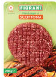
INALCA MAXI HAMBURGER SCOTTONA 250 GR