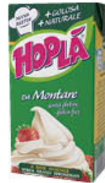
HOPLÀ DA MONTARE ZUCCHERATA 500 ML