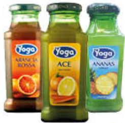
YOGA SUCCHI BAR BOTTIGLIA QUADRA GUSTI CLASSICI 20 CL