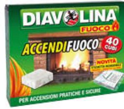
DIAVOLINA ACCENDIFUOCO 40 CUBI