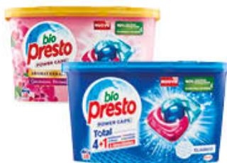
BIOPRESTO POWER CAPS CLASSICO/COLOR X 18