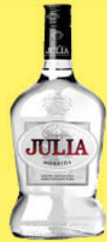
JULIA GRAPPA MORBIDA 70 CL