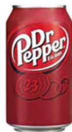
DR PEPPER 33 CL