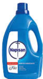
NAPISAN LIQUIDO 1 LITRO