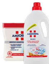
AMUCHINA ADDITIVO BUCATO LIQUIDO 1 LITRO/POLVERE 500 GR