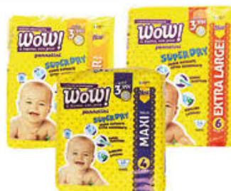
WOW PANNOLINI TUTTE LE MISURE