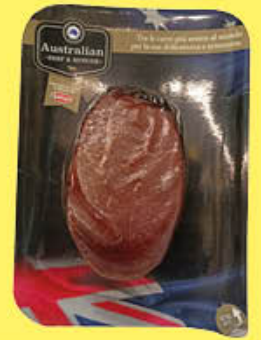
INALCA BISTECCA REALE AUSTRALIANA AL KG