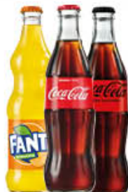
FANTA/COCA COLA CLASSICA E ZERO VETRO 33 CL