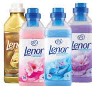
LENOR CONCENTRATO TUTTI I TIPI 550/575 ML