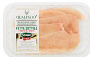
AMADORI PETTO POLLO FETTE SOTTILI 250 GR