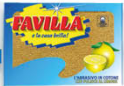
FAVILLA ABBRASIVO POTENZIATO