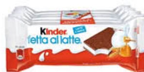
FERRERO FETTA A LATTE X 5