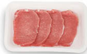
INALCA LONZA FETTE DI SUINO AL KG