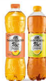
SAN BENEDETTO THE' CLASSICO 1,5 LITRI