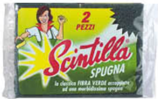
SCINTILLA PULIZIA SPUGNA 2 PEZZI