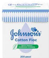
JOHNSON COTTON FIOC 200 PEZZI