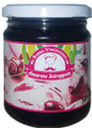
KIRSCHEN AMARENE 240 GR