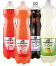
SAN BENEDETTO BIBITE TUTTI I TIPI 1,5 LITRI