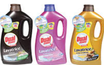
DUAL LAVATRICE 40 LAVAGGI