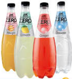
SANBENEDETTO BIBITE ZERO 75 CL