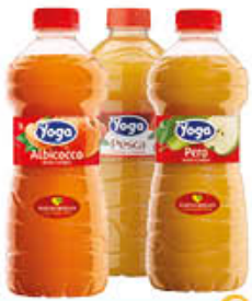
YOGA SUCCHI DI FRUTTA TUTTI I TIPI PET 1 LITRO