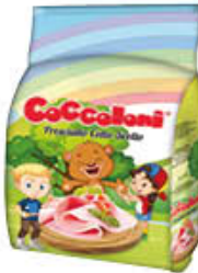
COCCOLONI PROSCIUTTO COTTO SCELTO AL KG