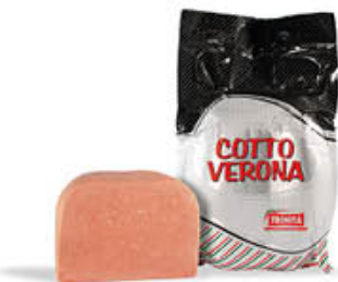
VERONA COTTO TRINITÀ AL KG