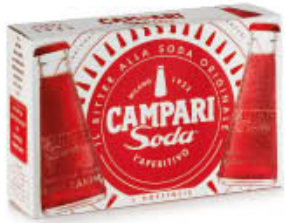
CAMPARI SODA CONFEZIONE X 10