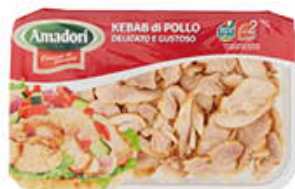
AMADORI KEBAB POLLO FETTE 280 GR