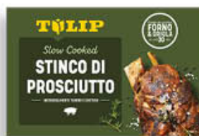
TULIP STINCO DI SUINO COTTO 600 GR