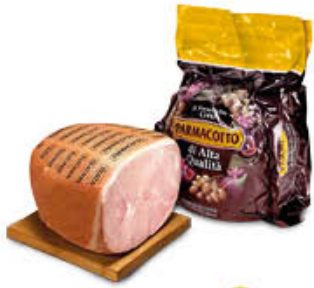
PARMACOTTO PROSCIUTTO COTTO ORIGINALE AL KG