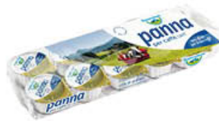
BAYERNLAND PANNA CAFFÈ GR 10 X 10 PZ