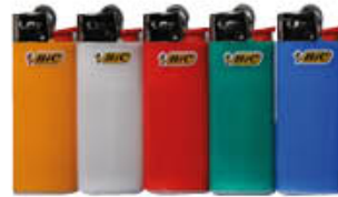
BIC ACCENDINO MINI J 25