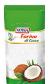
FATINA FARINA DI COCCO 200 GR