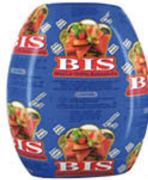
BEHELLI SPALLA COTTA BIS AL KG