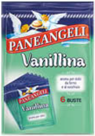
PANEANGELI VANILLINA PURA 6 BUSTE