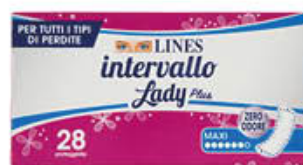
LINES ASSORBENTI INTERVALLO MAXI X 28