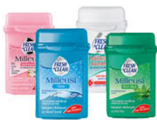
FRESH & CLEAN 40 SALVIETTE TRAVEL