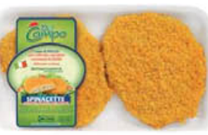
DEL CAMPO SPINACETTE STD 220 GR