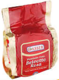
GASSER PROSCIUTTO COTTO BELCOTTO ROSA AL KG