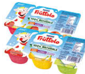
FRUTTOLO VARI GUSTI 300 GR