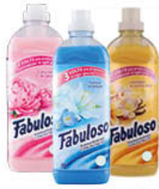
FABULOSO AMMORBIDENTE CONCENTRATO VARIE PROFUMAZIONI 56 LAVAGGI