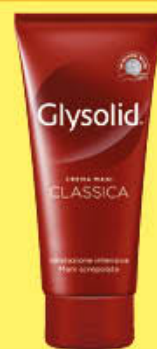
GLYSOLID TUBO 100 ML