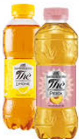
SAN BENEDETTO THE LIMONE/PESCA 50 CL