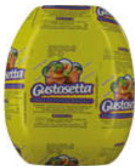
BEHELLI SPALLA COTTA GUSTOSETTA BAULETTO AL KG