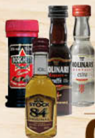
STOCK 84/ MOLINARI CLASSICO E CAFFÈ/ BORGHETTI LIQUORE CAFFÈ MIGNON