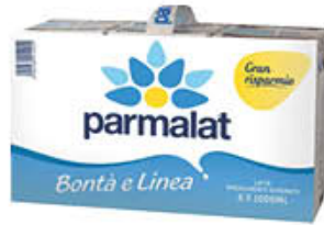
PARMALAT LATTE PARZIALMENTE SCREMATO BRICK - 1 LITRO X 6