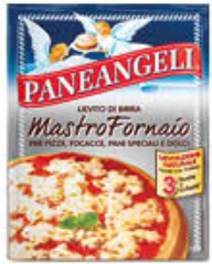
PANEANGELI MASTROFORNAIO 3 BUSTE