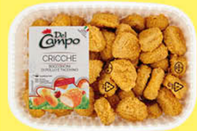
DEL CAMPO CRICCHE POLLO 230 GR