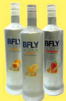
BFLY VODKA FRUTTA TUTTI I TIPI 1 LITRO