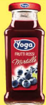
YOGA SUCCO BAR MIRTILLO 20 CL