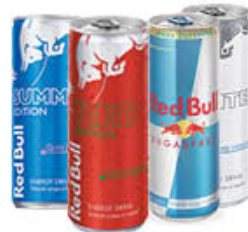
RED BULL SPECIAL EDITION 25 CL