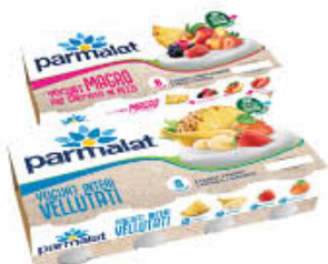
PARMALAT YOGURT FRUTTA E MAGRO 125 GR X 8