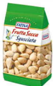
FATINA MANDORLE PELATE 200 GR