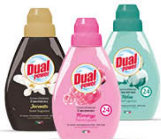
DUAL AMMORBIDENTE CONCENTRATO 24 LAVAGGI