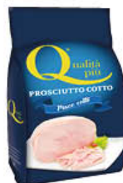
QUALITA' PIU' PROSCIUTTO COTTO PIACE COTTO AL KG